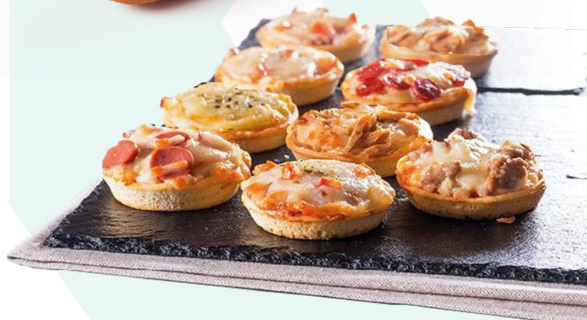
MINI PIZZAS LA NIÑA DEL SUR 3KG. 100 UNIDADES VARIADAS