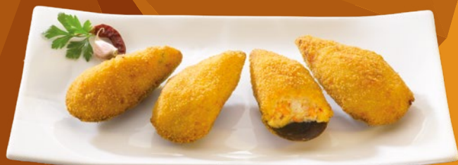
MEJILLÓN TIGRE ALVENT – 1X2,5KG.