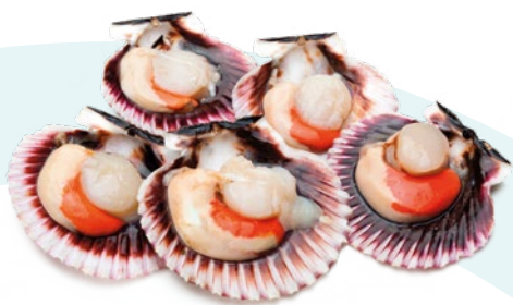
ZAMBURIÑA 20/30 PESCATRADE – 10X1KG.