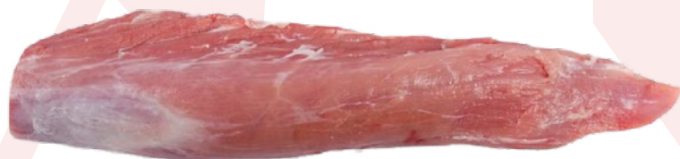
SOLOMILLO DE CERDO CARNES OLIVA – 10KG. APROX.