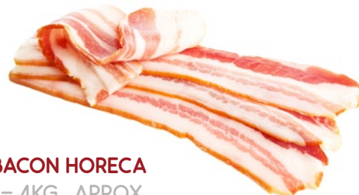
BACON HORECA VELILLA – 4KG. APROX.