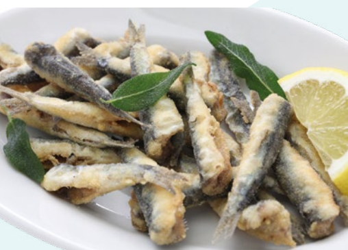
BOQUERÓN ENHARINADO AINUK – 1X2KG.