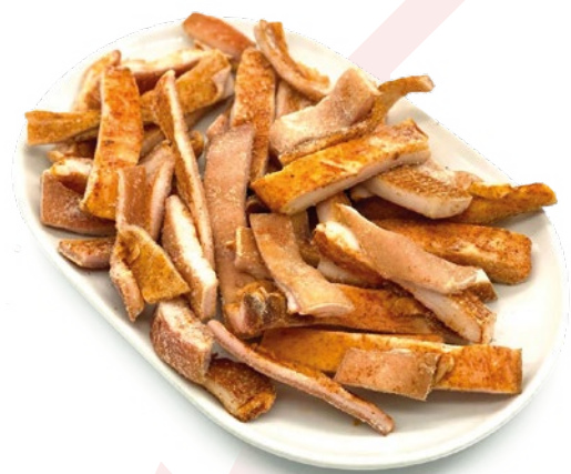
TORREZNOS AINUK – 4KG.