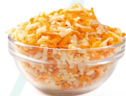
QUESO PARA GRATINAR AINUK – 6X1KG.