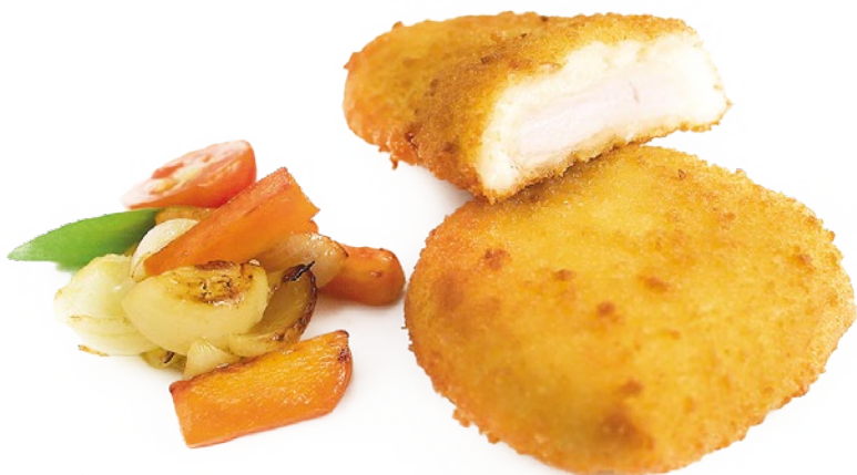
PECHUGA VILLARROY AINUK - 4X1KG.