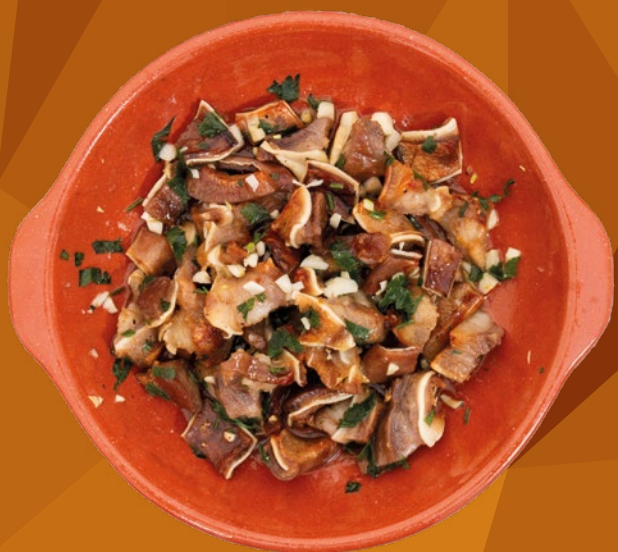
OREJA AL AJILLO VIGGER – 10X500GR.