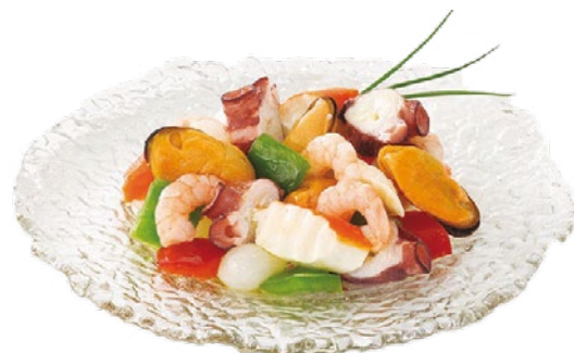
SALPICÓN DE MARISCO AINUK – 2X1KG.