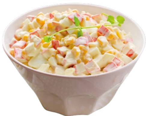
ENSALADA DE CANGREJO MAHN MAC – 4X1KG.