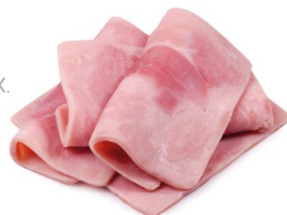
PALETA DE YORK IIXII VELILLA – 3KG. APROX.