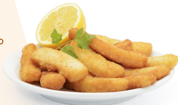
RABAS EMPANADAS AINUK - 4X1KG.