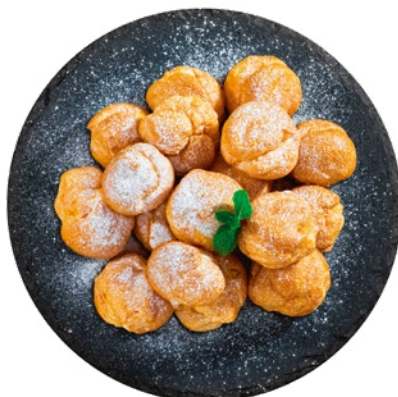
PROFITEROLES CLAVO – 8X500GR.