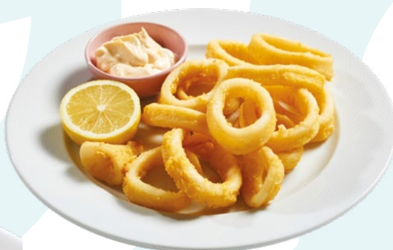
ANILLA ENHARINADA PCS – 1X1,5KG.