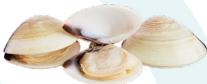
ALMEJA BLANCA 40/60 SEAWORK – 6X1KG.