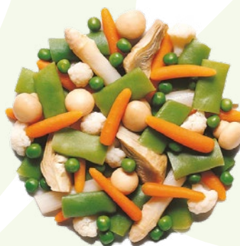
MENESTRA ESPECIAL CON PUNTAS DE ESPÁRRAGOS BONDUELLE – 4X2,5KG.