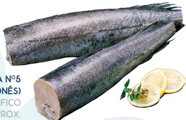
MERLUZA ENTERA Nº5 (CORTE JAPONÉS) EUROPACIFICO 3KG. APROX.