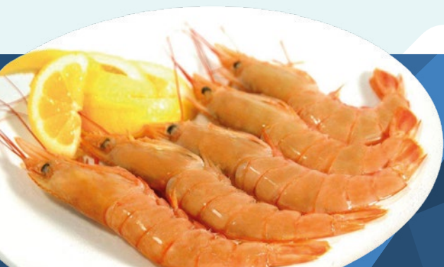
GAMBÓN Nº2 (ABORDO) VERAZ – 6X2KG.