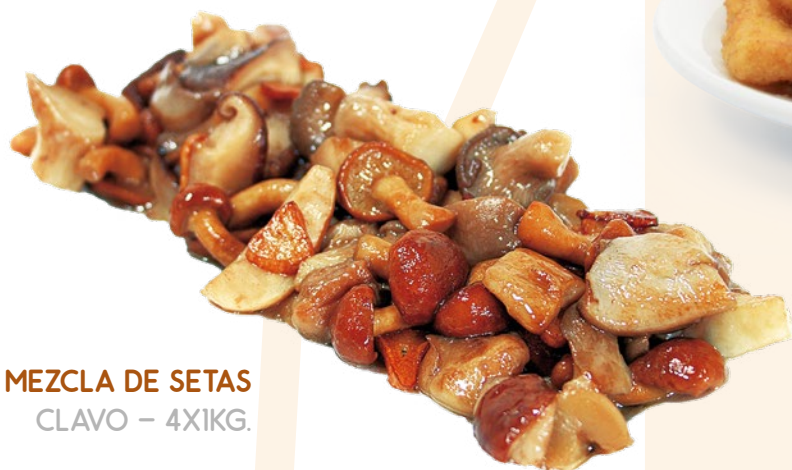
MEZCLA DE SETAS CLAVO - 4X1KG.