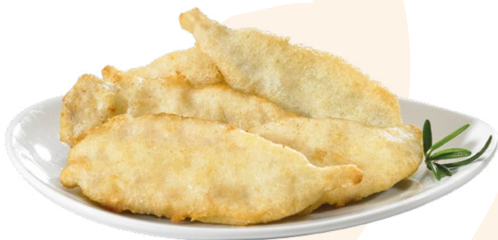
BOQUERÓN EN TEMPURA IBERCOOK – 10X500GR.