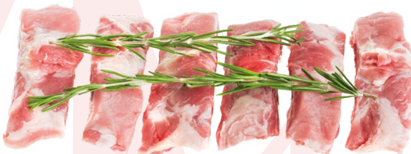
COSTILLA TROCEADA AVIMAHER – 4KG.