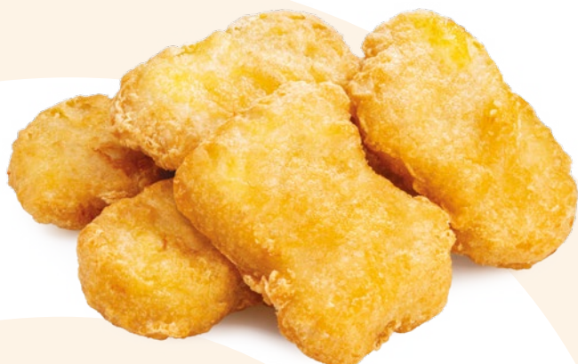
NUGGETS DE POLLO AINUK – 8X500GR.