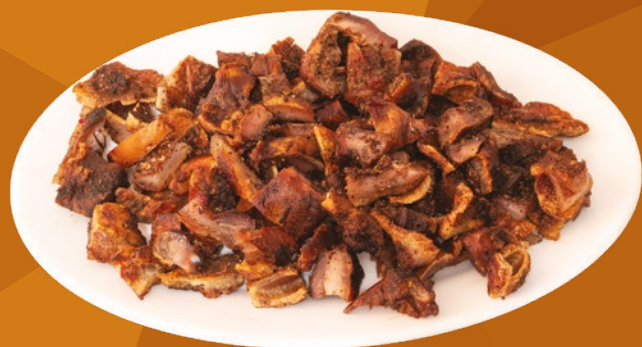
OREJA ADOBADA VIGGER – 10X500GR.