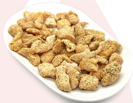
TAPA DE POLLO EMPANADO AVIMAHER – 3KG.