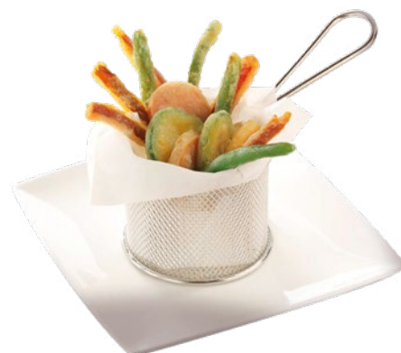
TEMPURA DE VERDURAS BONDUELLE – 4X1KG.