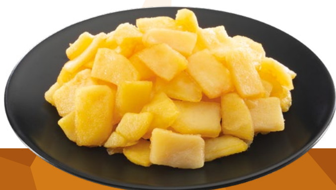
FONDO DE PATATA SIN CEBOLLA (TU TORTILLA EN 10 MIN.) AINUK - 8X1KG.