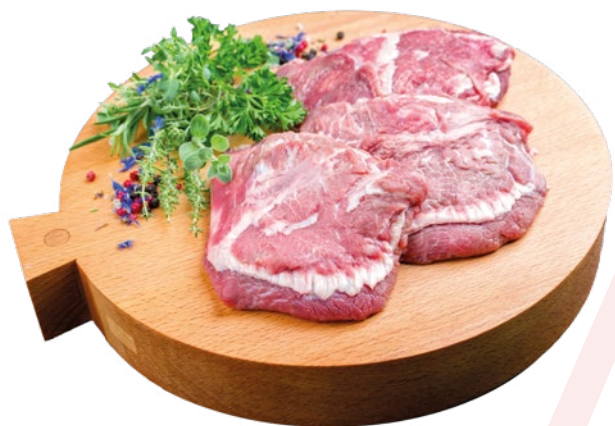
CARRILLADA CERDO SIN HUESO EXTERNA CARNES OLIVA – 6KG. APROX.