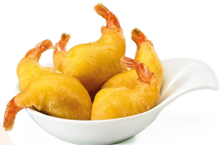
GAMBA COLA VISTA IBERCOOK – 2X1KG.