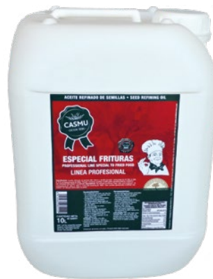
ACEITE DE FREIDORA CASMU – 10 LITROS