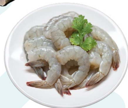
LANGOSTINO PELADO VANAMEI ECUADOR 31/35 PESCATRADE – 10X1KG.