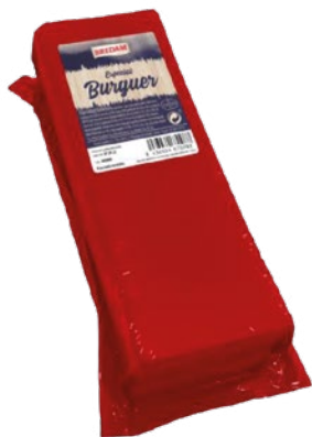
QUESO BARRA SÁNDWICH BREDAM – 3 KG. APROX.