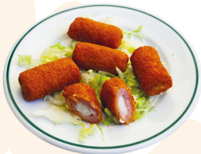
CROQUETA SUPREMA DE JAMÓN AINUK – 8X500GR.