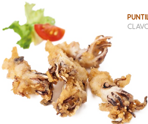
PUNTILLA ENHARINADA CLAVO - 1X2KG.