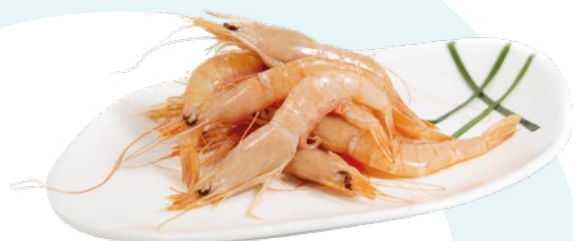
GAMBA BLANCA 80/100 DELFIN – 9X1KG.