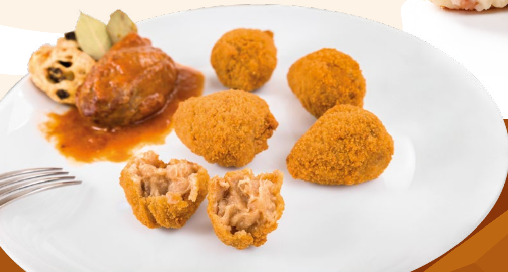
CROQUETA DE RABO DE TORO CLAVO – 6X500GR.