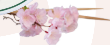
ROLLITO DE PRIMAVERA IBERCOOK – 4X1KG.