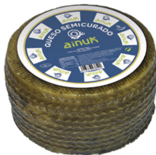
QUESEURO MEZCLA SEMICURADO AINUK – 3KG. APROX.