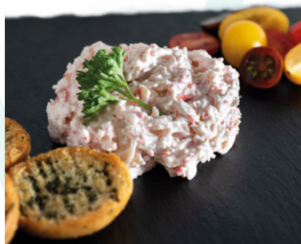
PINCHO DEL NORTE MAHNMAC – 4X1KG