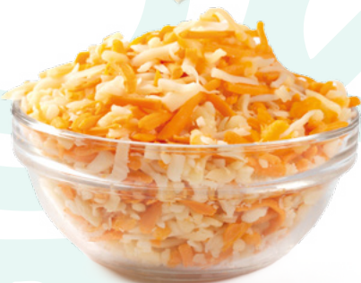
QUESO DE GRATINAR 2 COLORES Q. SANABRIA - 6X1KG.