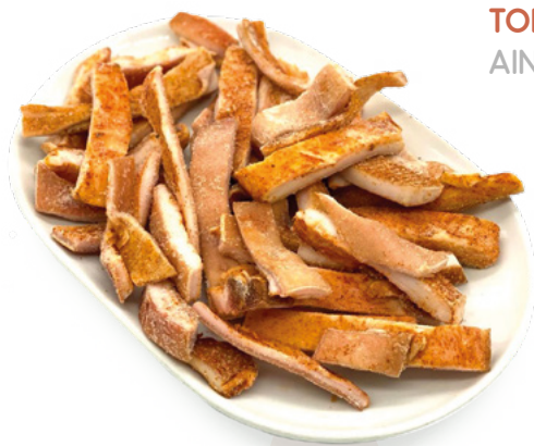
TORREZNOS PARA FREIR AINUK – 2X2KG.