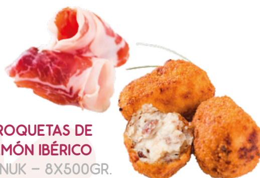
CROQUETAS DE JAMÓN IBÉRICO AINUK – 8X500GR.