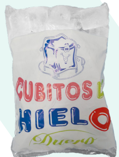
CUBITOS DE HIELO HIELOS DUERO – 5X2KG.