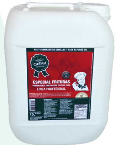
ACEITE DE FREIDORA CASMU – 10 LITROS