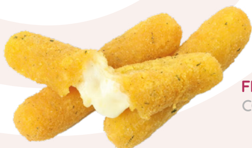
FINGER DE MOZZARELLA CONFREMAR – 5X1KG.