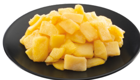
FONDO DE PATATA SIN CEBOLLA AINUK – 8X1KG.