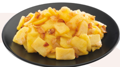
FONDO DE PATATA CON CEBOLLA AINUK – 8X1KG.