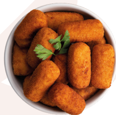
CROQUETA APERITIVO JAMON CONGALSA – 4X1KG.