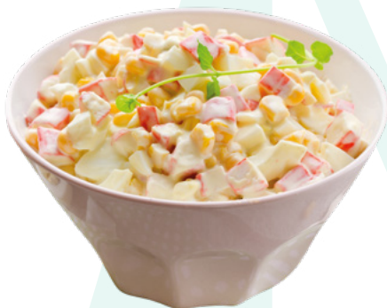
ENSALADA DE CANGREJO MAHNMAC – 4X1KG