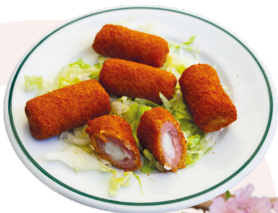
MINI FLAMENQUIN AINUK – 8X500GR.