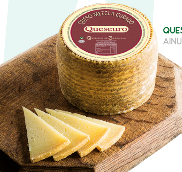
QUESEURO MEZCLA CURADO AINUK – 3KG. APROX.