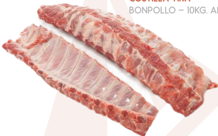
COSTILLA TIRA BONPOLLO – 10KG. APROX.