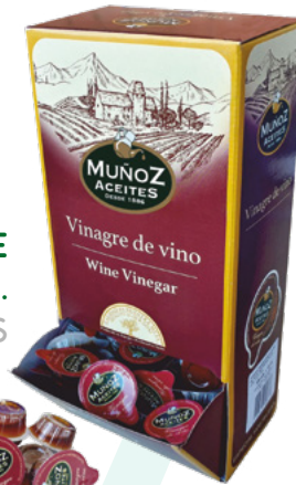
MONODOSIS VINAGRE DE VINO 10ML. MUÑOZ – 168 UNIDADES