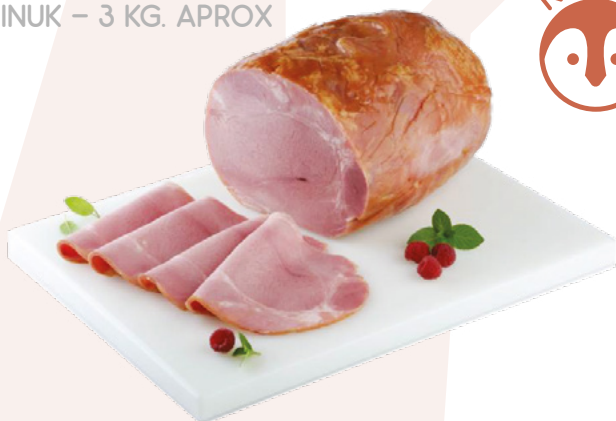
LACON ASADO AINUK – 3 KG. APROX