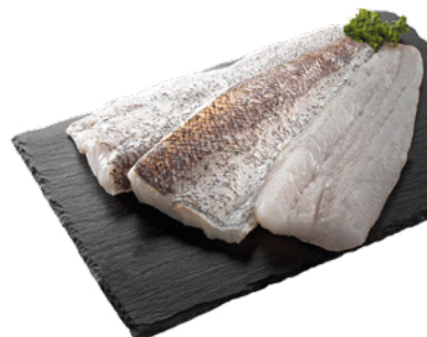
FILETE DE MERLUZA C/P 4/6 CONFREMAR - 5KG.