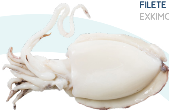
SEPIA 600/800 G AINUK - 6KG.