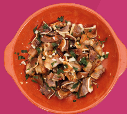
OREJA AL AJILLO VIGOGER - 10X500GR.