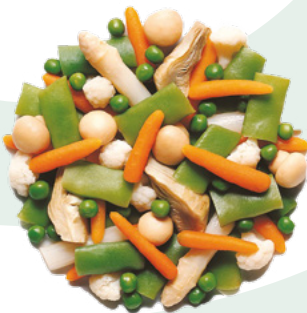
MENESTRA ESPECIAL CON PUNTA DE ESPARRAGOS BONDUELLE 4X2,5KG.