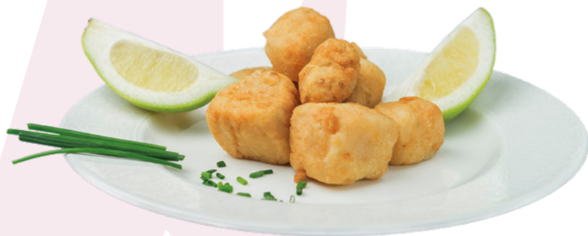
DADOS DE CAZÓN ENHARINADO MEGAMAR - 10X500GR.