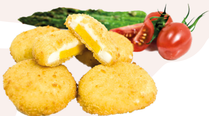
HUEVO CON BECHAMEL AINUK – 8X500GR.