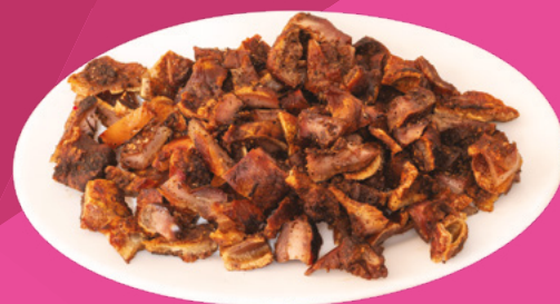
OREJA ADOBADA VIGOGER - 10X500GR.