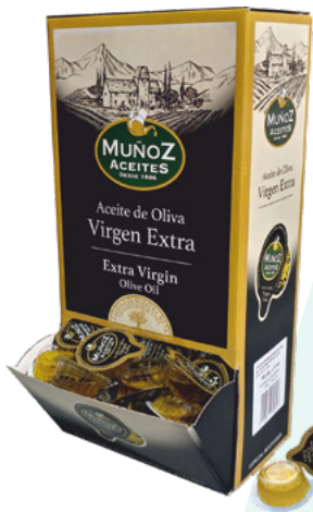
MONODOSIS OLIVA VIRGEN EXTRA 10ML. MUÑOZ – 168 UNIDADES