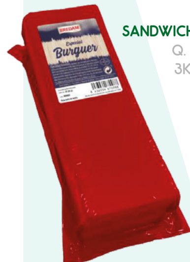
BARRA DE SANDWICH PREMIUM Q. SANABRIA 3KG. APROX.