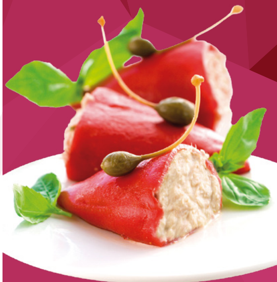
PIMIENTOS DEL PIQUILLO RELLENOS DE BACALO AINUK - 8X500GR.