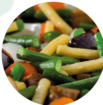
SALTEADO CAMPESTRE BONDUELLE - 4X2,5KG.