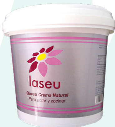
QUESO CREMA CUBO LASEU – 2KG.