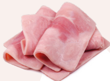
PALETA DE JAMON YORK IIXII AINUK – 3 KG. APROX