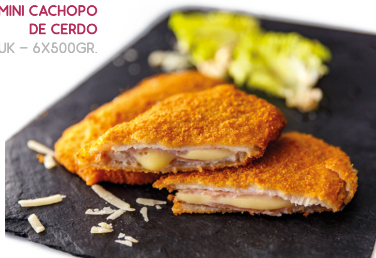
MINI CACHOPO DE CERDO AINUK – 6X500GR.