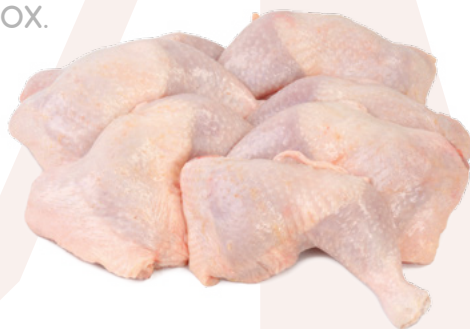
TRASEROS DE POLLO 300/400 BONPOLLO – 5KG