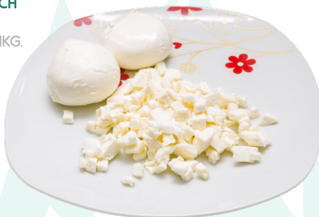
MOZZARELA EN DADOS Q. SANABRIA - 6X1KG.