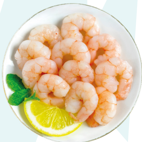
GAMBA PELADA 10/30 AINUK – 5X1KG.