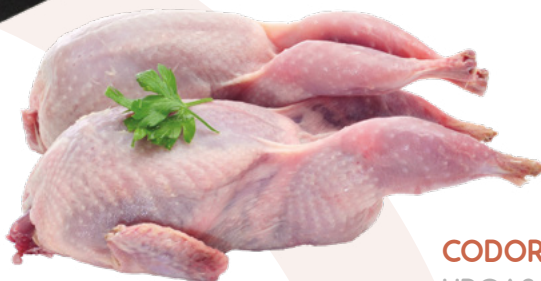
CODORNIZ ESPECIAL 4 UNIDADES URGASA - 6X4UNIDADES