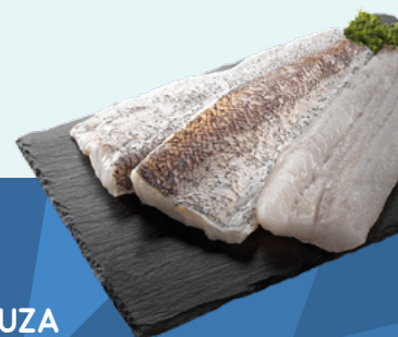
FILETE DE MERLUZA AUSTRAL 300-500 GR. FRIOSUR – 7KG.