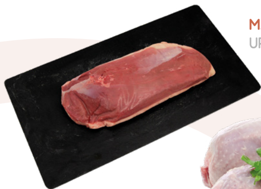
MAGRET DE PATO URGASA - 5KG.