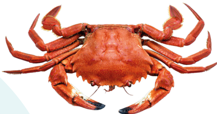
NECORA 6/8. AYR – 6X800GR.