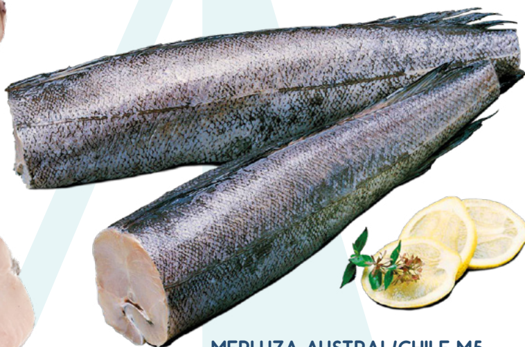
MERLUZA AUSTRAL/CHILE M5 FRIOSUR – 5X11KG.