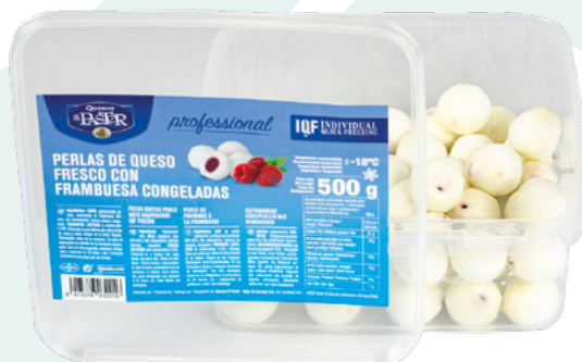
PERLAS DE QUESO CON FRAMBUESA EL PASTOR – 500GR.