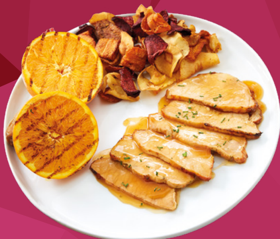
LOMO DE CERDO A LA NARANJA CLAVO - 2X1KG.