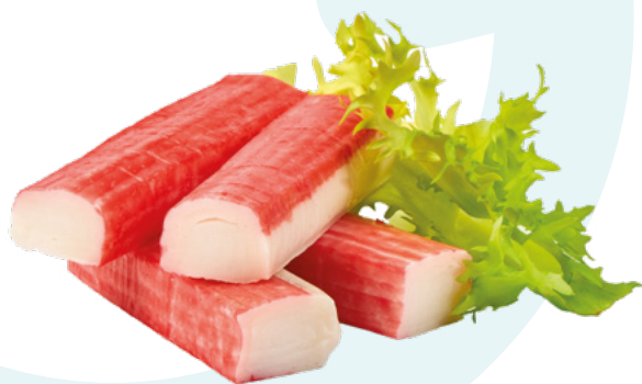
PALITO SURIMI AYR – 10X1KG.