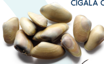
TELLINA EXKIMO – 12X250GR.