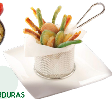
MIX DE VERDURAS EN TEMPURA BONDUELLE – 4X1KG