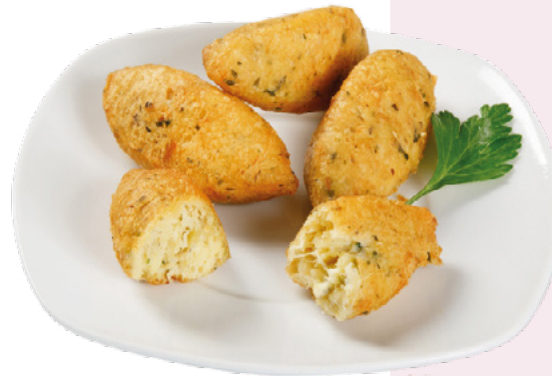
PASTEIS DE BACALAO IBERCOOK – 6X800