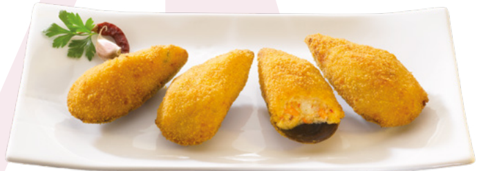
MEJILLÓN TIGRE BARQUETA 1KG AINUK – 4X1KG.