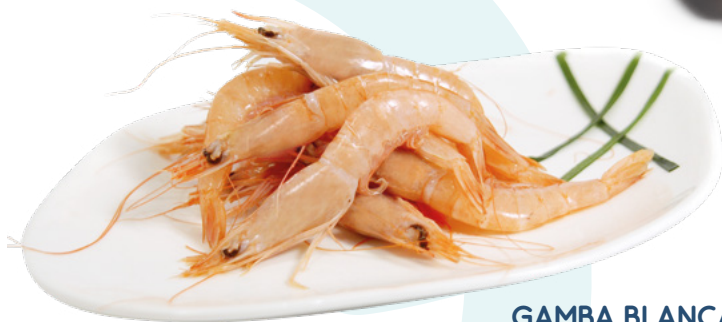
GAMBA BLANCA Nº1 80/100 PIEZAS DELFIN – 9X1KG