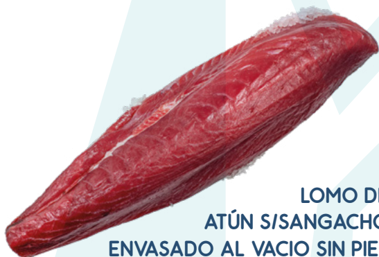
LOMO DE ATÚN S/SANGACHO ENVASADO AL VACIO SIN PIEL ALFRIO – CAJA A PESO VARIABLE