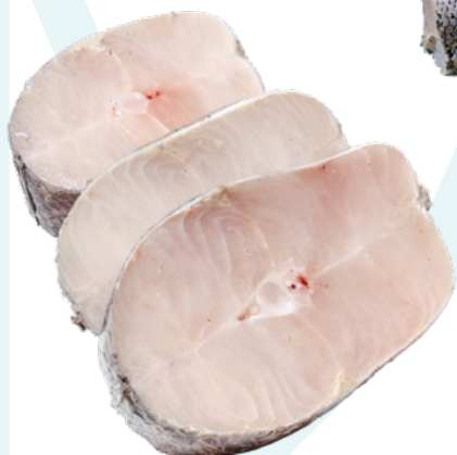
RODAJA MERLUZA AUSTRAL +260GR. EUROPACIFICO – 5KG.