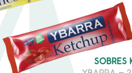
SOBRES KETCHUP YBARRA – 252X12ML.