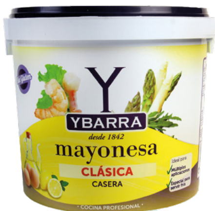
MAYONESA YBARRA YBARRA – 5KG.