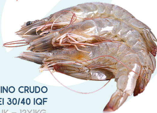
LANGOSTINO CRUDO VANNAMEI 30/40 IQF AINUK – 12X1KG.