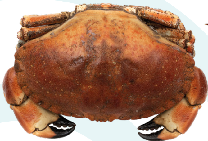
BUEY DE MAR COCIDO 600/800 – 14 UNIDADES. AYR – 10KG.