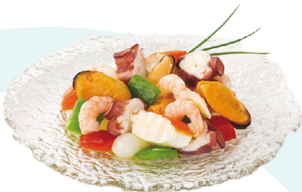
SALPICÓN DE MARISCO AINUK – 2X1KG