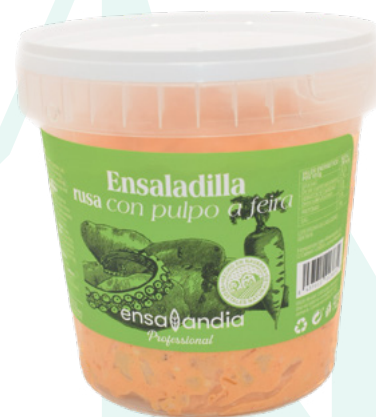
ENSALADILLA PULPO ENSALANDIA - 4X1 KG