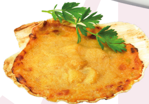
VIEIRA GRATINADA IBERCOOK – 18X120GR.