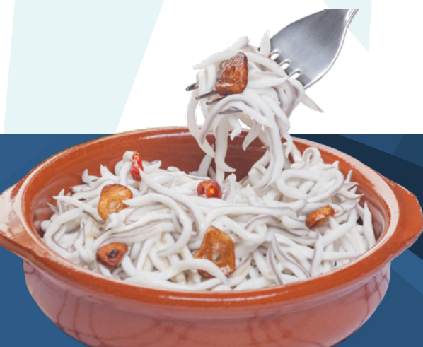
SUCEDANEO DE ANGLAS AINUK – 8X250GR.