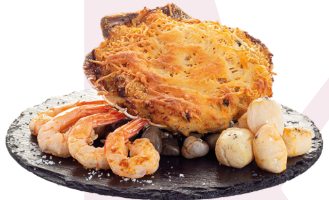
VIEIRA SUPREMA CON LANGOSTINOS DELEITA – 150GR X 14 UNIDADES