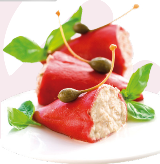
PIMIENTOS DE PIQUILLO BACALAO AINUK - 8X500KG.