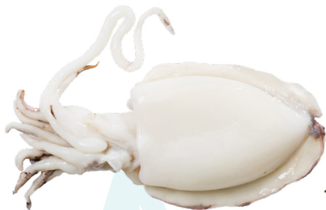
SEPIA 600/800 G 5KG.