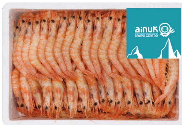
GAMBA ROJA COCIDA (PEINADA). 60/80 PESCATRADE – 6X1KG.