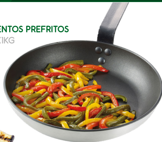
JULIANA DE PIMIENTOS PREFRITOS BONDUELLE – 6X1KG