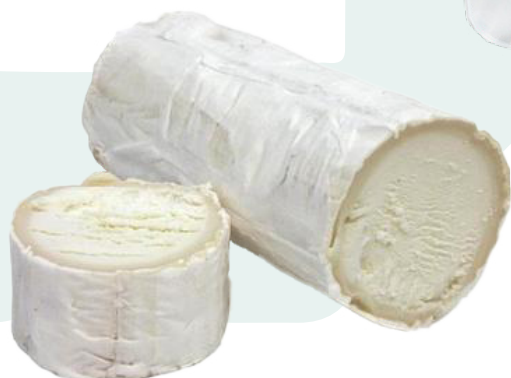
RULO DE CABRA AINUKL – 2X1KG