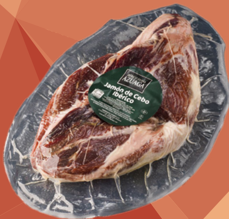
CENTRO DE JAMÓN CEBO IB 50% (ATADO, PEL Y PUL) AZUAGA – 2X4,5KG. APROX.