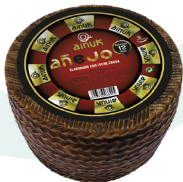
QUESO AÑEJO DE OVEJA DELMORAL – 2 UNIDADES