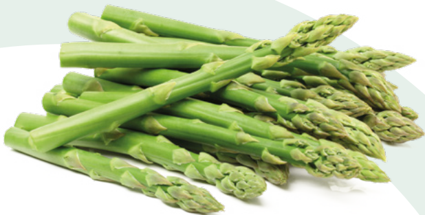
ESPARRAGO VERDE CLAVO – 5X1KG