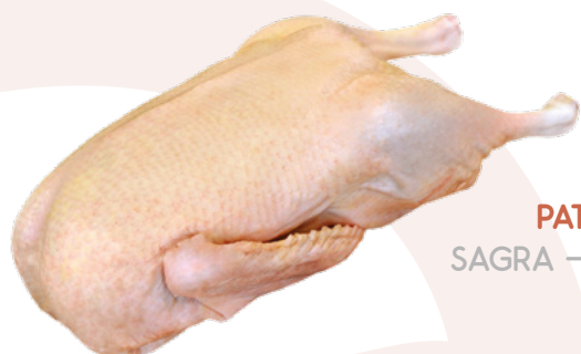
PATO DE PEKIN SAGRA - 6X2.200KG