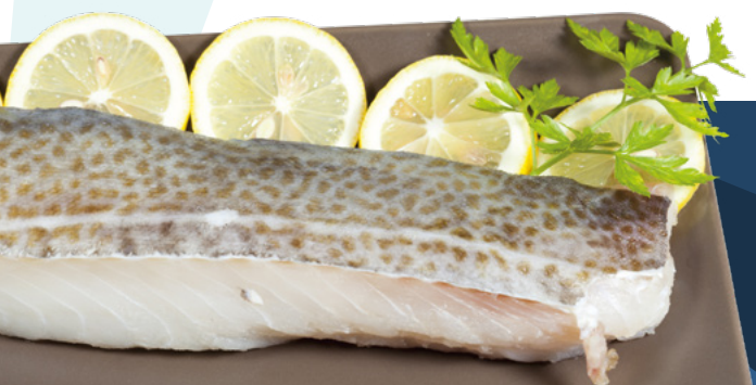
BACALAO LOMO GREENLAND 1200/1500 ELBA – 6KG.