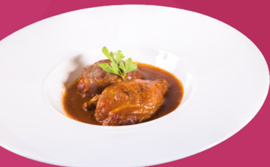
CARRILLERA DE CERDO AL VINO TINTO CLAVO - 6X400GR