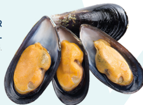
MEJILLON MEDIA CONCHA SUPER 70/80. GRANEL AINUK – CAJA 2,5KG.