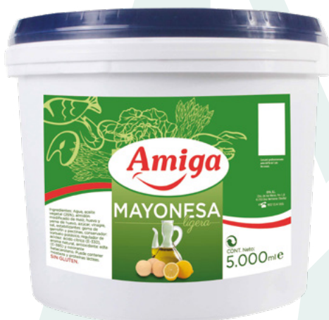
MAYONESA AMIGA YBARRA – 3,5KG.