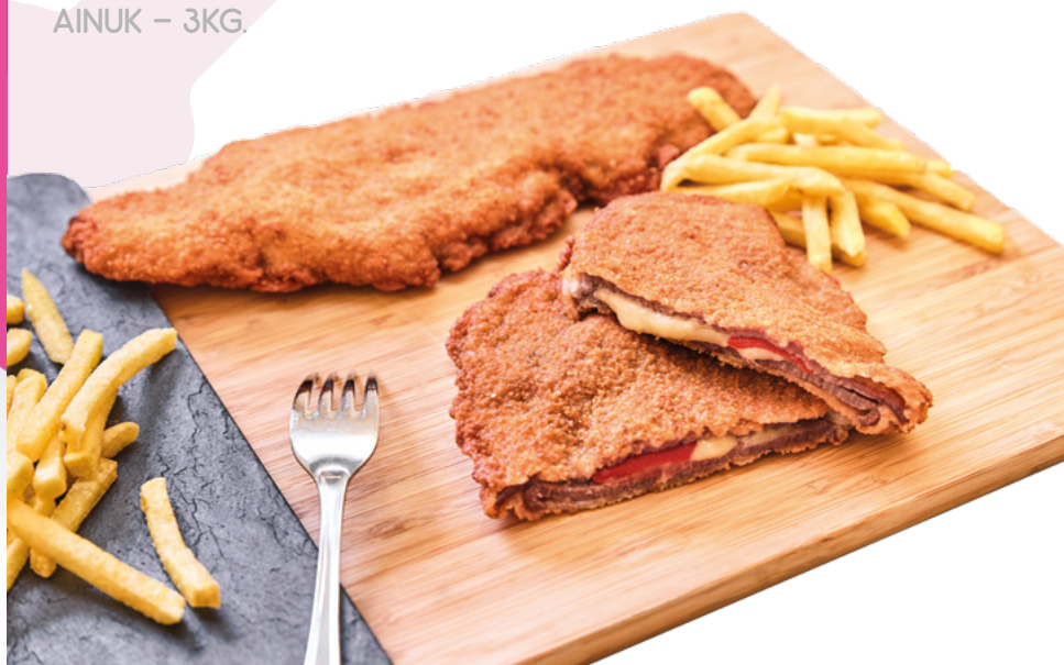
CACHOPO TERNERA AINUK - 3KG.