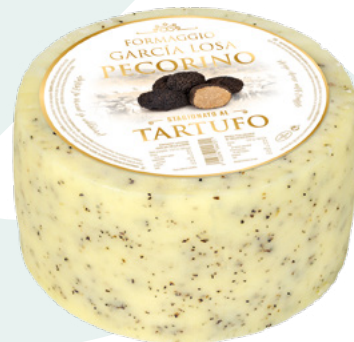
QUESO OVEJA MADURADO CON TRUFA PECORINO GARCIA LOSA – 1X3KGS