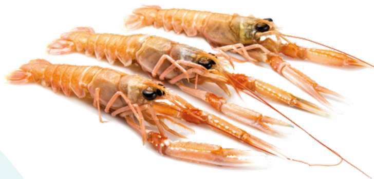
CIGALA ORIGEN ESCOCIA TAMAÑOS 0 Y 1. SEAWORK – 4X1,5KG.