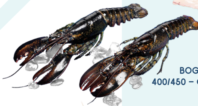
BOGAVANTE CRUDO 400/450 – CAJA DE 13 UND. EXKIMO – 6KG