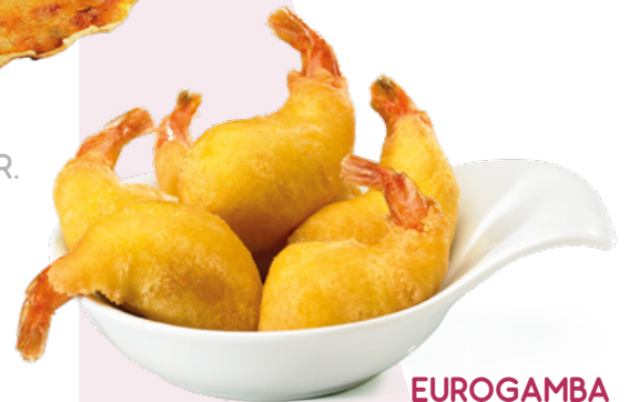
EUROGAMBA IBERCOOK – 2X1