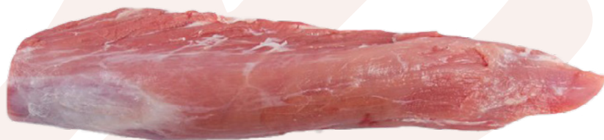
SOLOMILLO DE CERDO CARNES OLIVA - 10KG