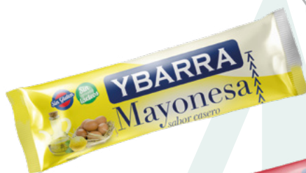
MAYONESA YBARRA YBARRA – 252X12ML.