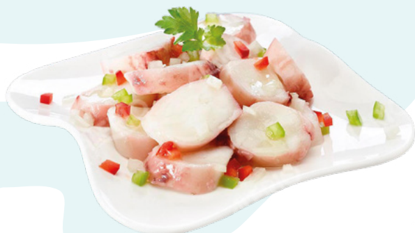
RODAJA DE POTON PREMIUM NEW CONCISA – 6X1KG.