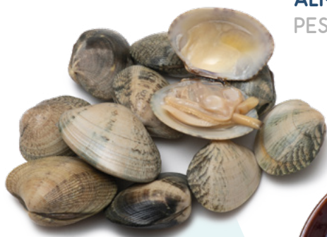
ALMEJA NEGRA 40/60 PESCATRADE – 10X1KG.