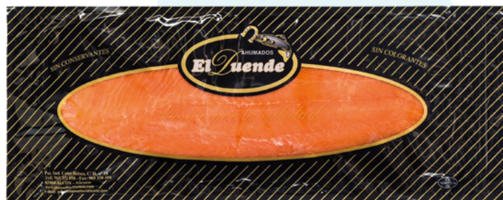
PLANCHA DE SALMON AHUMADO PRECORTADO EL DUENDE – 1,6GR.