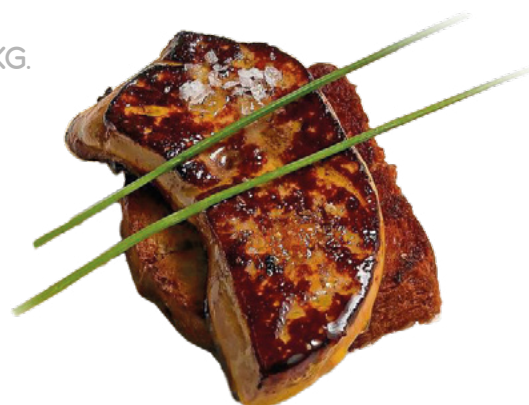
FOIE URGASA - 5KG.