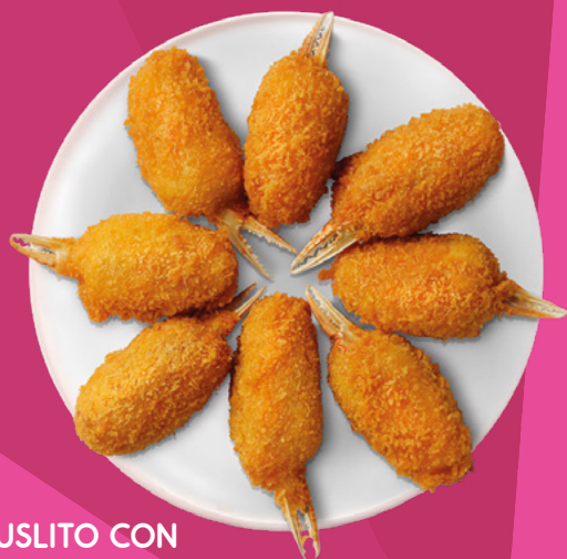
MUSLITO CON PINZA TALLA 32 PESCATRADE - 10X1KG.