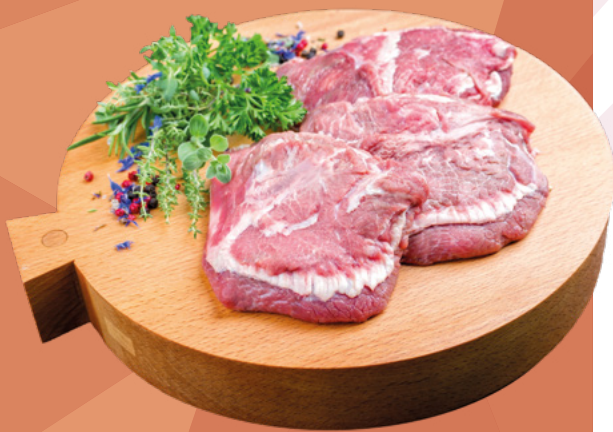
CARRILLADA DE CERDO MARBEIRA – 6KG