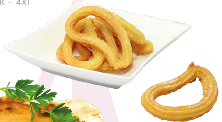
CHURRO LAZO IBERCOOK – 4X1