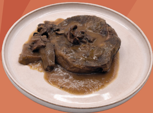
MELOSO DE ESPALDILLA DE AÑOJO CONFITADO. 220GR.-240GR. 18UNID. GICARNS – CAJA ±4KG