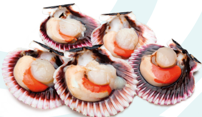
VIEIRA MEDIA CONCHA 8/12 DELFIN – 8X800GR.