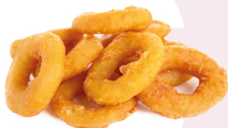
ANILLA REBOZADA IBERCOOK -4X1