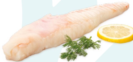
COLAS RAPE 200/300 AYR - 5X600G