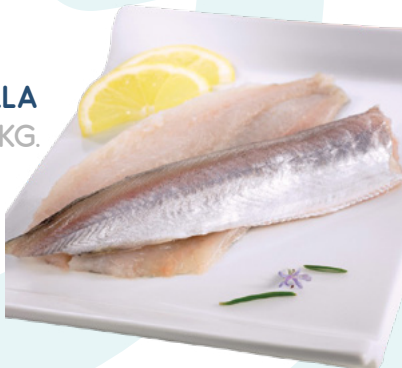
FILETE BACALADILLA IBERCOOK - 1X4,5KG.