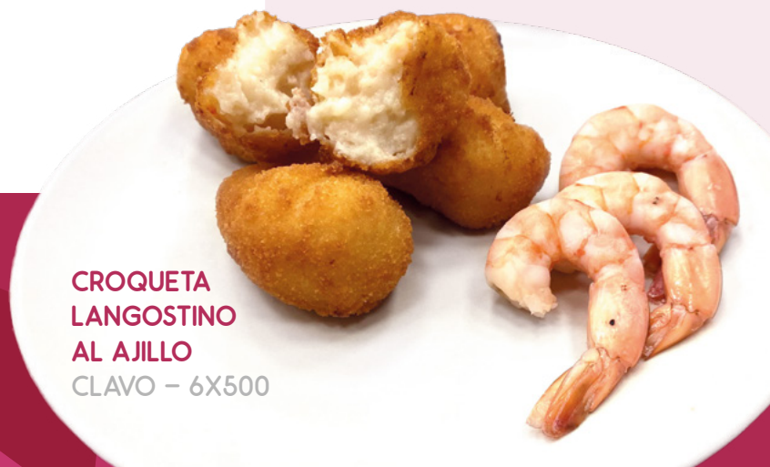
CROQUETA LANGOSTINO AL AJILLO CLAVO – 6X500