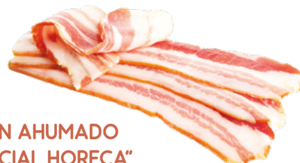
BACON AHUMADO "ESPECIAL HORECA" EMBUTIDOS VELILLA 4KG. APROX.