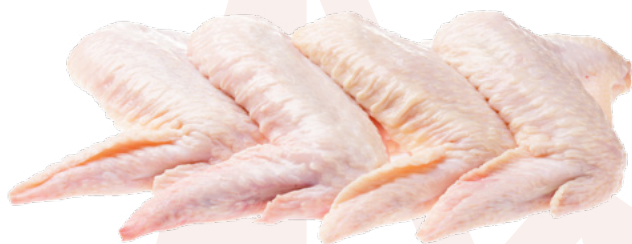
ALAS ENTERAS CARNES OLIVA - 6KG