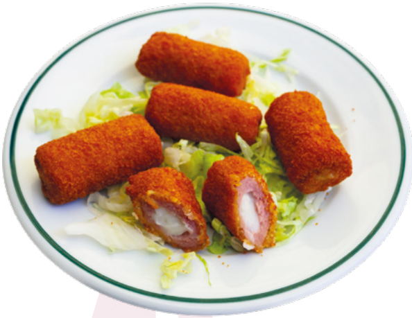
MINI FLAMENQUIN AINUK – 8X500GR.