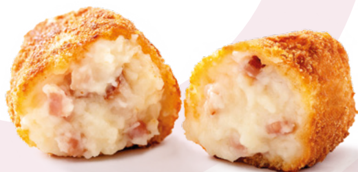
CROQUETA SUPREMA JAMON AINUK -8X500GR.