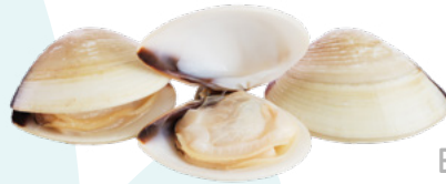
ALMEJA BLANCA 40/60 EXKIMO - 6X1KG.