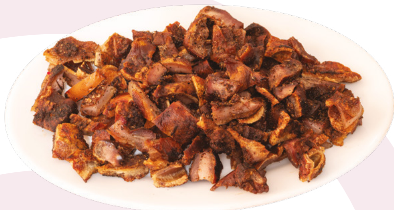
OREJA COCIDA ADOBADA VIGOGER - 10X500GR.