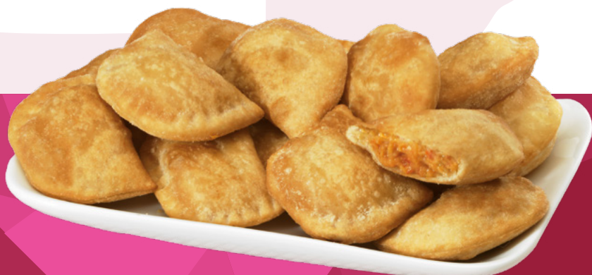
MINI EMPANADILLA ATÚN AINUK -4X1