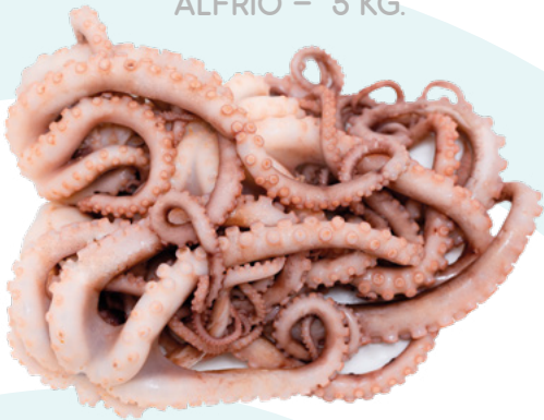
REJOS I.Q.F. ARGENTINO ALFRIO - 5 KG.