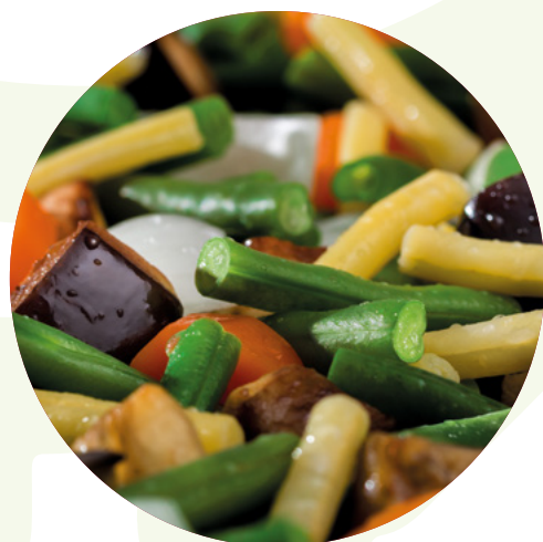
SALTEADO CAMPESTRE BONDUELLE - 4X2,5KG.