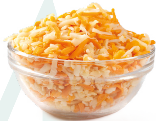
QUESO PARA GRATINAR QUESOS SANABRIA - 6X1KG.