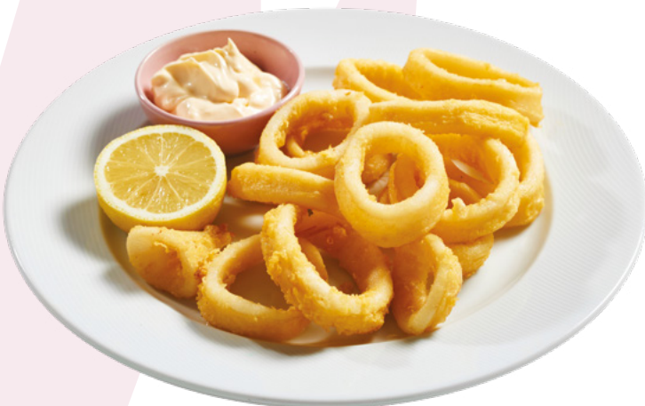
ANILLAS ENHARINADAS TRADICIONALES PCS – 1,5KG.