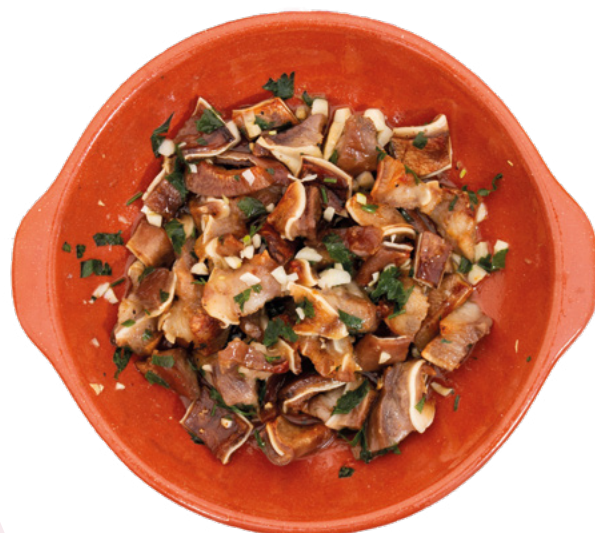
OREJA COCIDA AL AJILLO VIGOGER - 10X500GR.