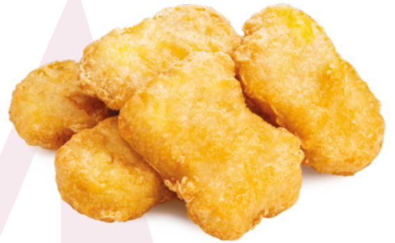
NUGGET POLLO AINUK – 8X500GR.