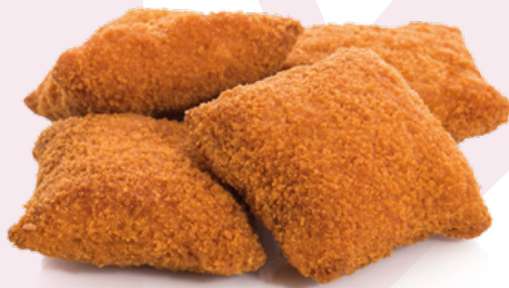
COSIÑAS DE CHORIZO CLAVO – 8X500GR.