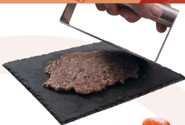
HAMBURGUESA ANGUS SMASH 50GR. SIMONS - 2X1KG