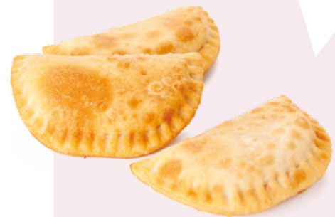
EMPANADILLA AINUK – 4X1KG