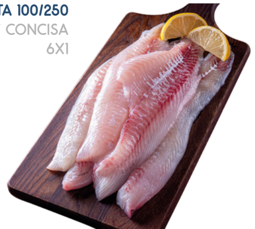
FILETE DE GALLINETA 100/250 NEW CONCISA 6X1