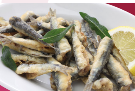
BOQUERON GRIEGO ENHARINADO PCS – 1X2KG.