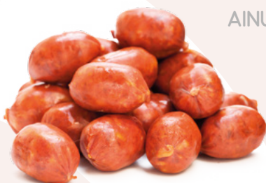
CHORIZO MINI CRIOLLO MINI AINUK - 2KG.