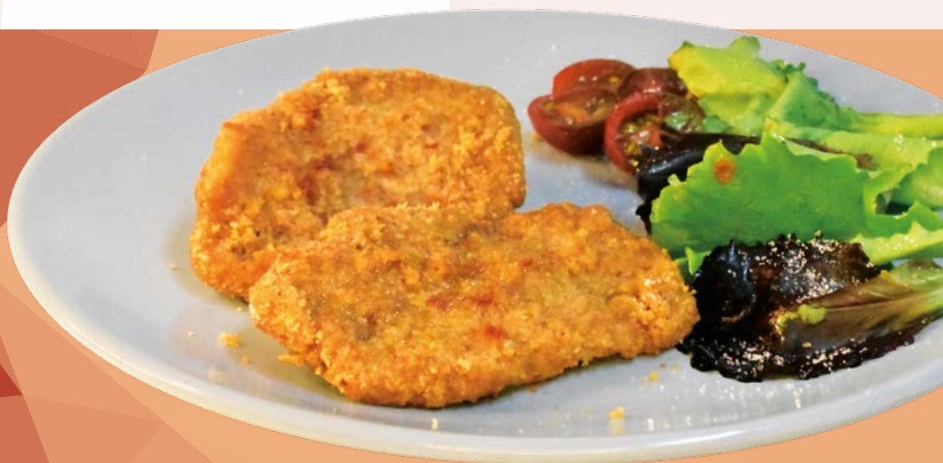
CINTA DE LOMO EMPANADO AVIMAHER - 3KG.