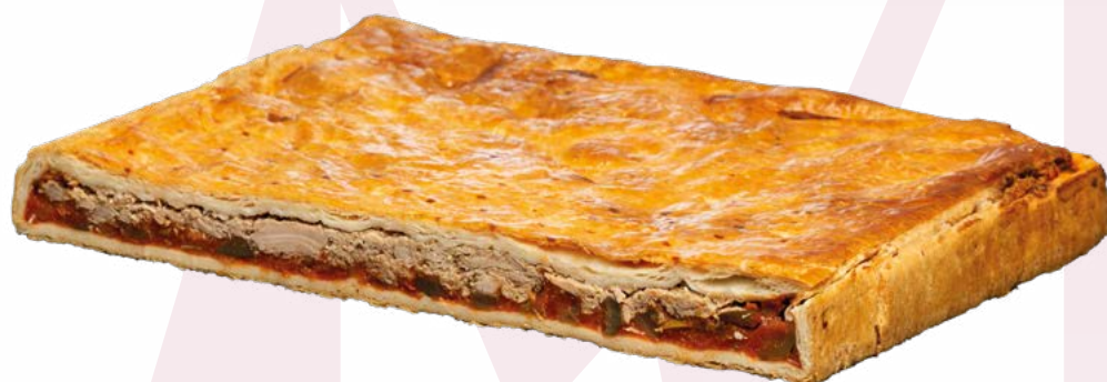
EMPANADA ATÚN AZCARAY - 2X2,250GR.