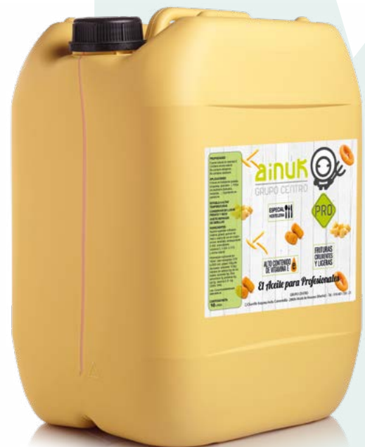
ACEITE "FRITUS PRO" 10L AINUK – 10 LITROS