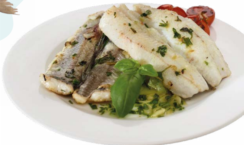
FILETE BACALADILLA IBERCOOK – 1X4,5KG.