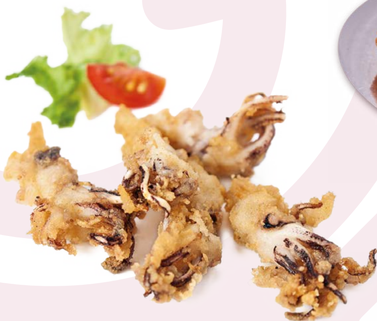
PUNTILLA ENHARINADA CLAVO - 2KG