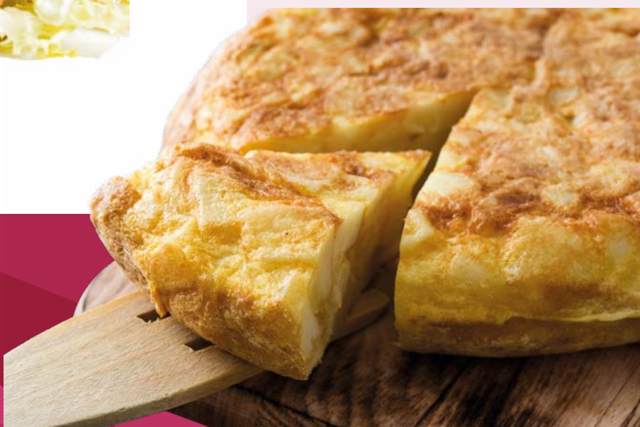
TORTILLA EXQUISE AINUK - 6X800