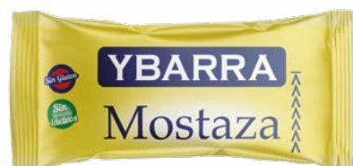
MOSTAZA YBARRA STICK YBARRA – 204X9ML.