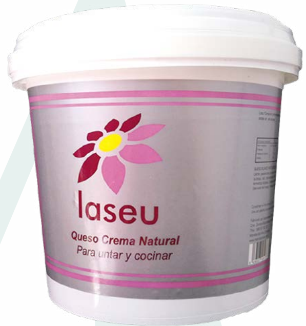
QUESO CREMA CUBO LASEU – 2KG.