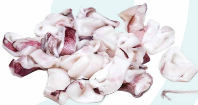
CALAMAR TROCEADO SEAWORK – 5X1KG.