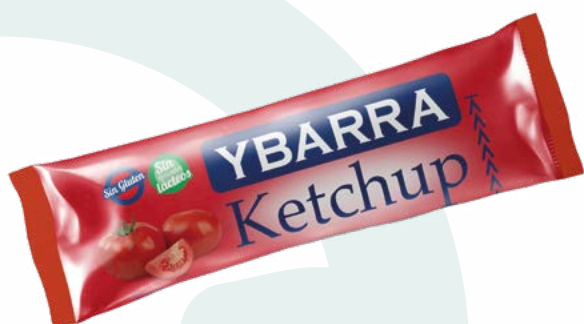
KETCHUP YBARRA STICK YBARRA – 252X12ML.