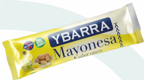
MAYONESA YBARRA STICK YBARRA – 252X12ML.