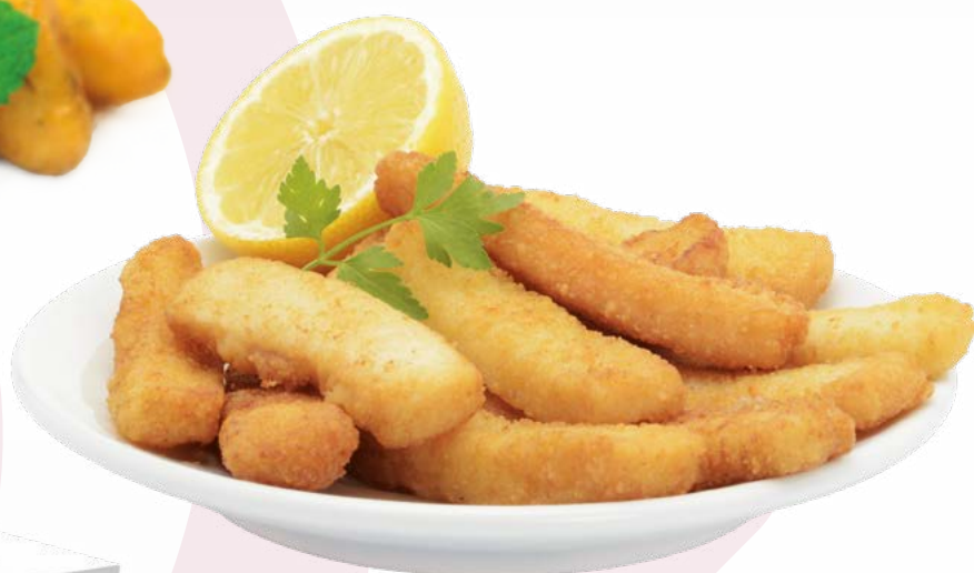
RABA EMPANADA AINUK - 4X1KG.