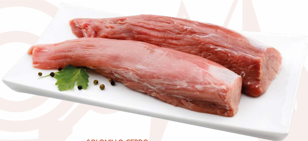
SOLOMILLO CERDO CARNES OLIVA - 10KG