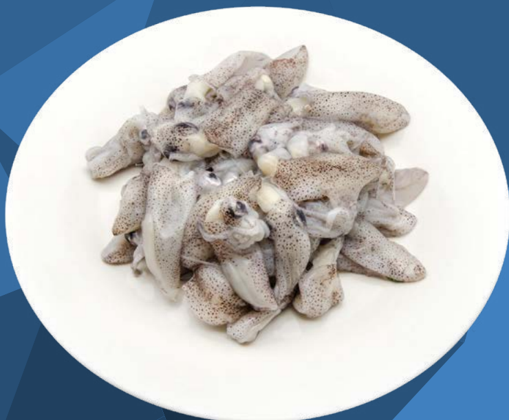
PUNTILLA CHINA SUELTA SIN PLUMA EXKIMO – 6X1KG.