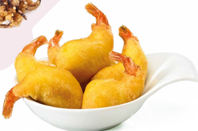
GAMBA COLA VISTA IBERCOOK - 2X1KG.