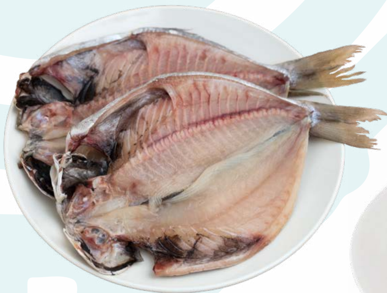
DORADA MARIPOSA 200/300 TERRANOVA – 4KG / 5KG