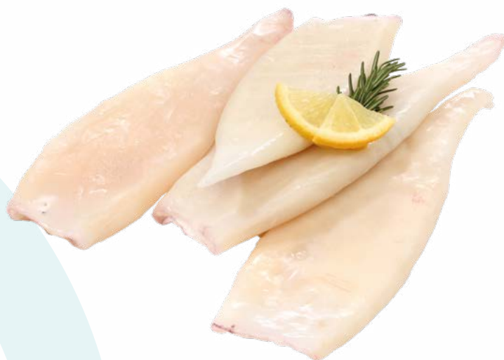
TUBO DE CALAMAR PREMIUM AINUK - 7KG.