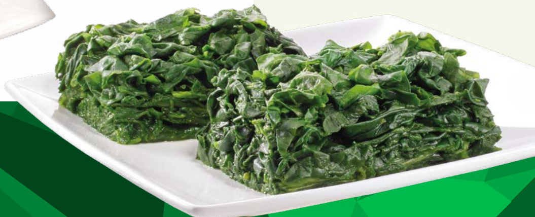
ESPINACA MILHOJAS BONDUELLE - 2,5KG.