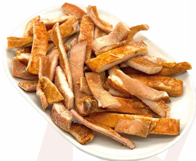
TORREZNOS AINUK - 4KG.