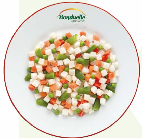
ENSALADILLA BONDUELLE - 2,5KG.