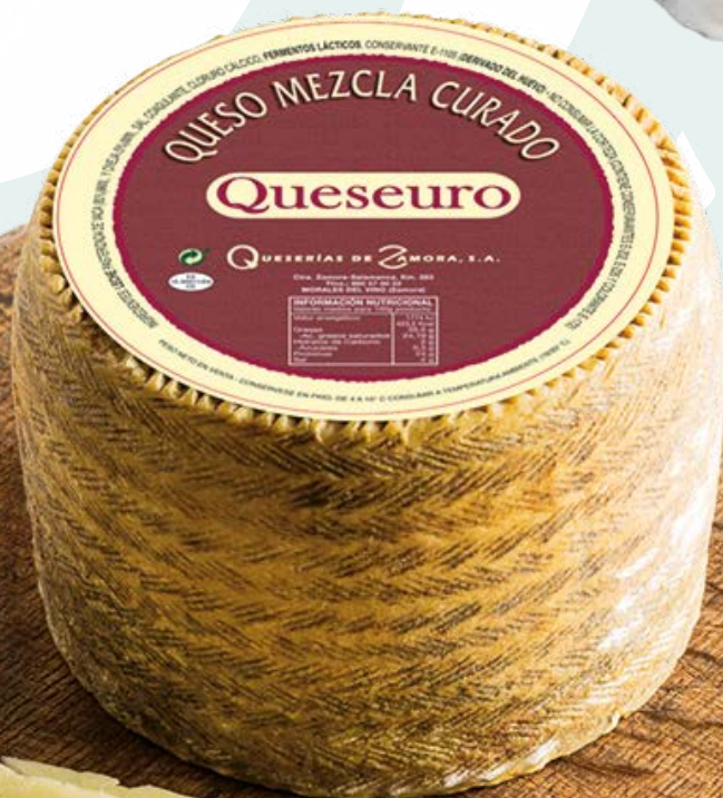
QUESO MEZCLA CURADO QUESEURO – 3KG. APROX.