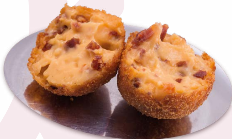
CROQUETA HUEVO CON CHORIZO AINUK - 8X500