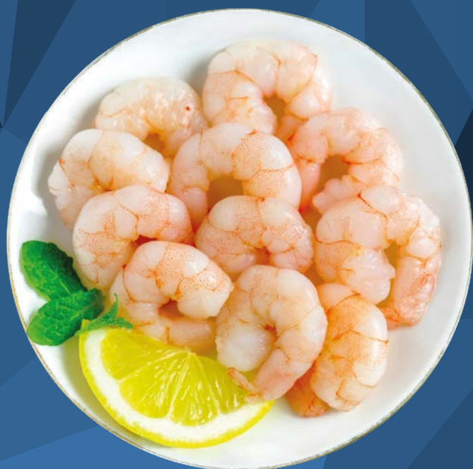
GAMBA PELADA 30/50 AINUK – 5X1KG.