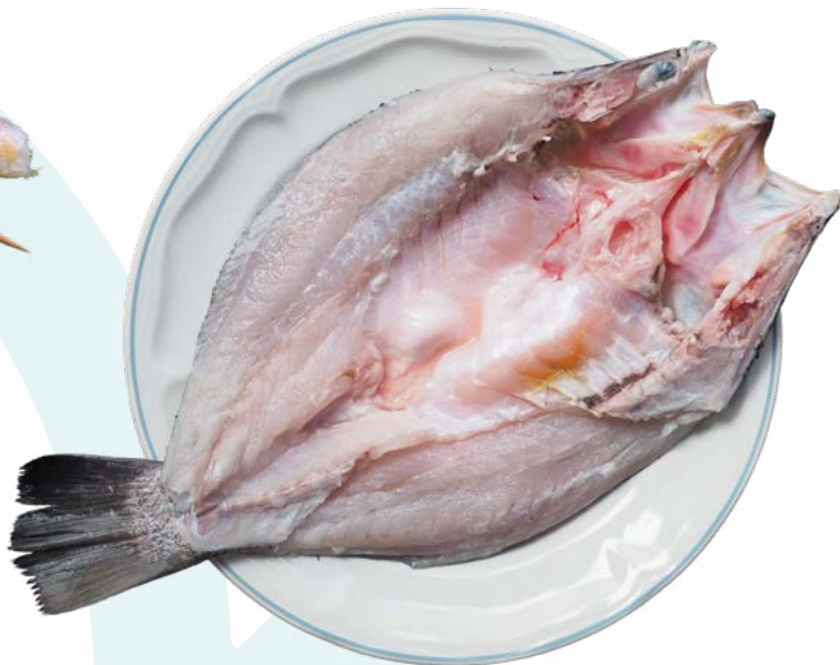
LUBINA MARIPOSA 200/300 TERRANOVA – 4KG / 5KG