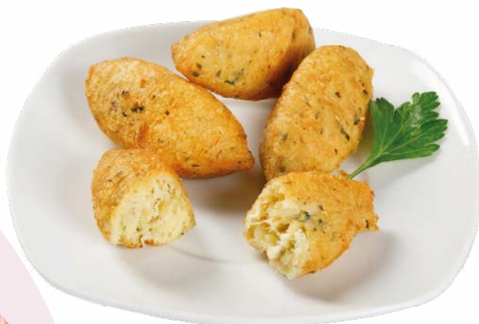
PASTEIS DE BACALAO IBERCOOK - 3X1,5KG.