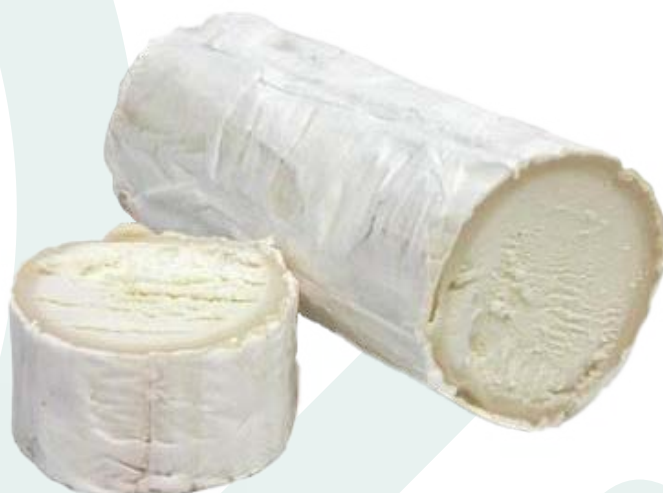
RULO DE CABRA AINUK – 2X1KG