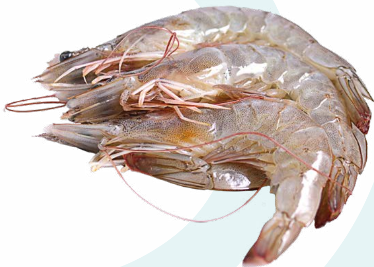
LANGOSTINO CRUDO 30/40 PESCATRADE - 12X1KG. LANGOSTINO COCIDO 45/55 PESCATRADE - 4X2KG. LANGOSTINO COCIDO 80/100 PESCATRADE - 4X2KG.