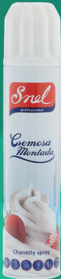
NATA SPRAY CREMOSA MONTADA SNEL – 12X500 ML