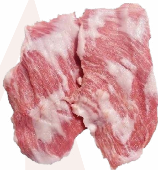
SECRETO DE CERDO CARNES OLIVA - 6KG