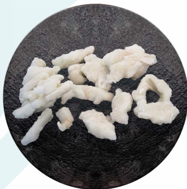
MIGAS DE BACALAO DESALADAS ICELANDIC - 1X5KG