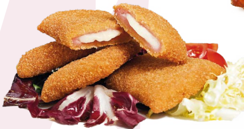
MINI SAN JACOBO AINUK - 8X500