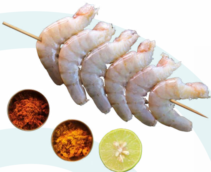
BROCHETA DE LANGOSTINOS TERRANOVA – 20X600GR