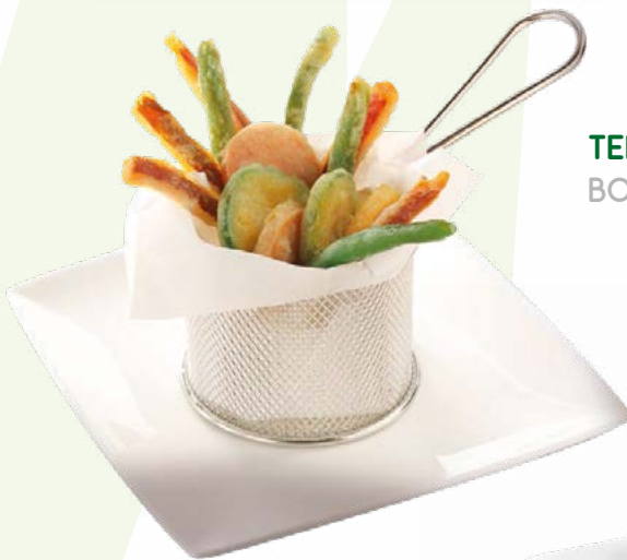
TEMPURA DE VERDURAS BONDUELLE - 1KG.