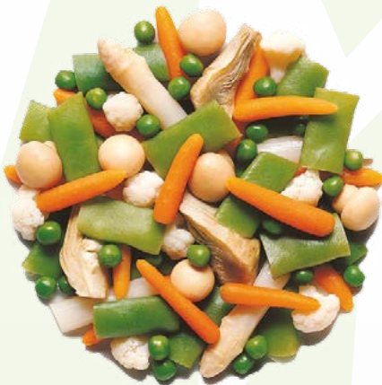
MENESTRA ESPECIAL BONDUELLE - 2,5KG.