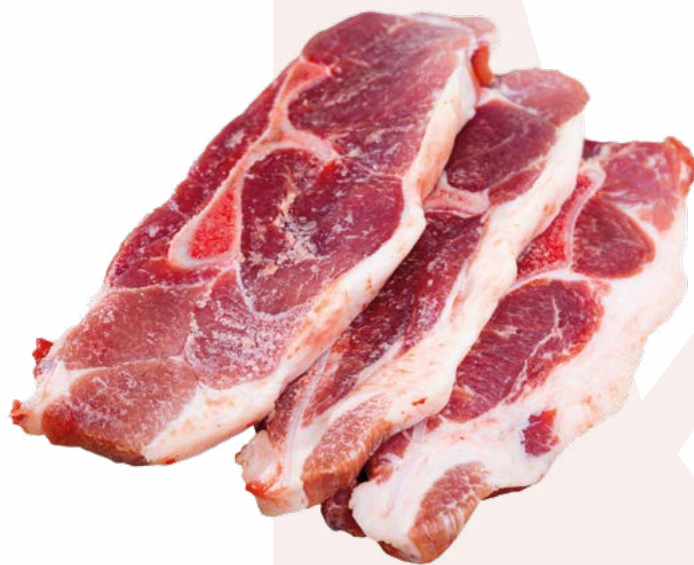
CHURRASCO DE VACA MIMAR - 5KG