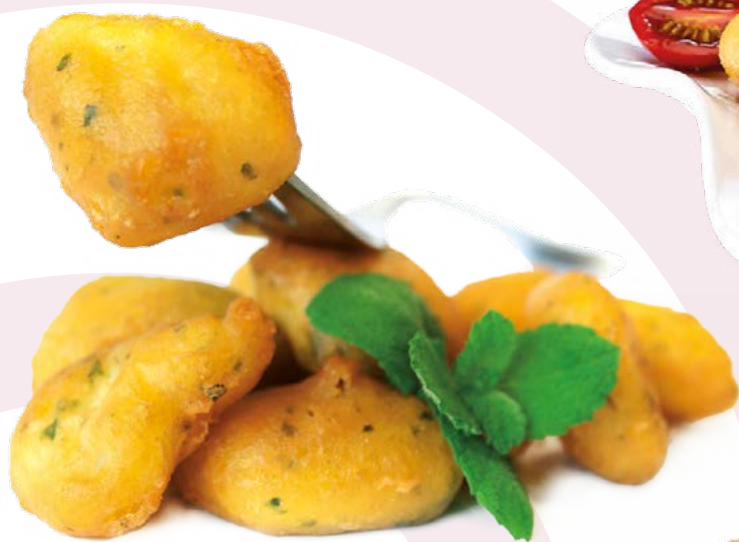
SEPIA REBOZADA AINUK - 8X500