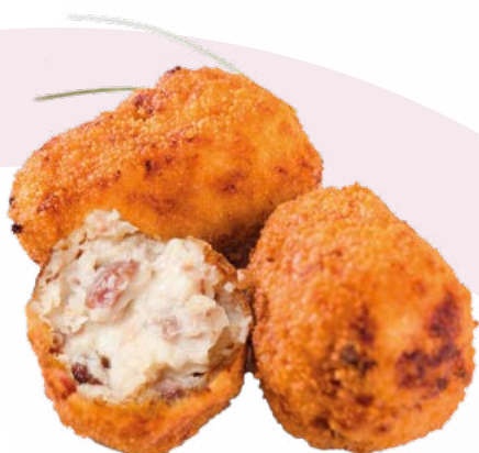
CROQUETA IBERICO AINUK - 8X500