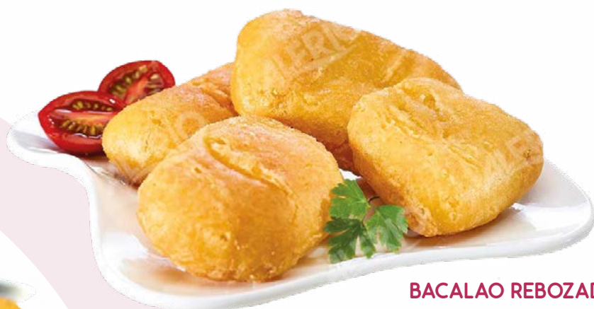
BACALAO REBOZADO GELVIGO - 4X1KG