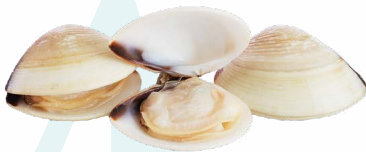
ALMEJA BLANCA VIETNAM 40/60 GELVIGO – 6X1KG.