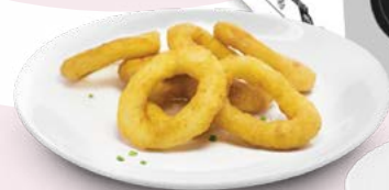
TAPAS MIX IBERCOOK - 4X1