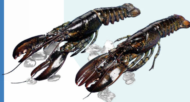
BOGAVANTE CRUDO 400/450GR. EXKIMO – 13 PIEZAS