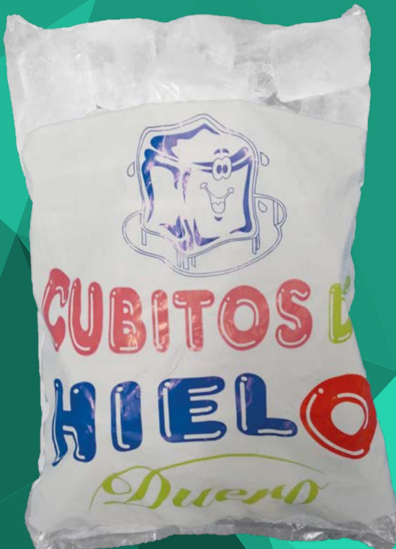
HIELO 2KG HIELOS DUERO – 5X2KG.