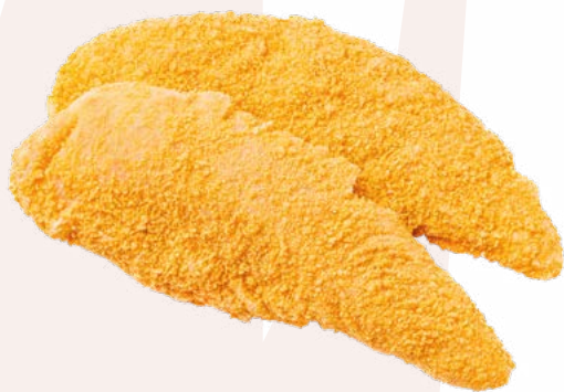
FILETE DE POLLO EMPANADO AINUK - 3KG.