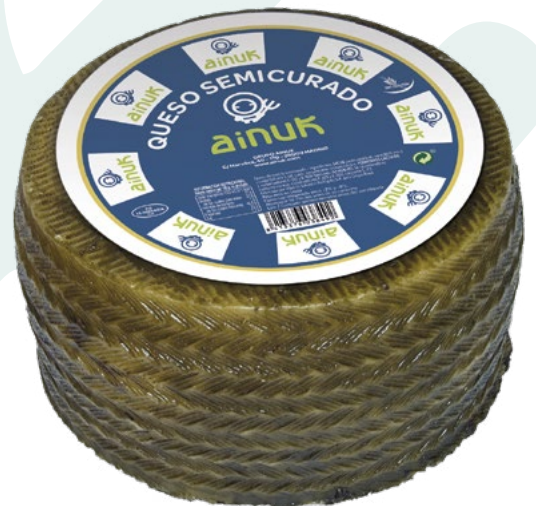
QUESEURO MEZCLA SEMICURADO AINUK – 3KG. APROX.