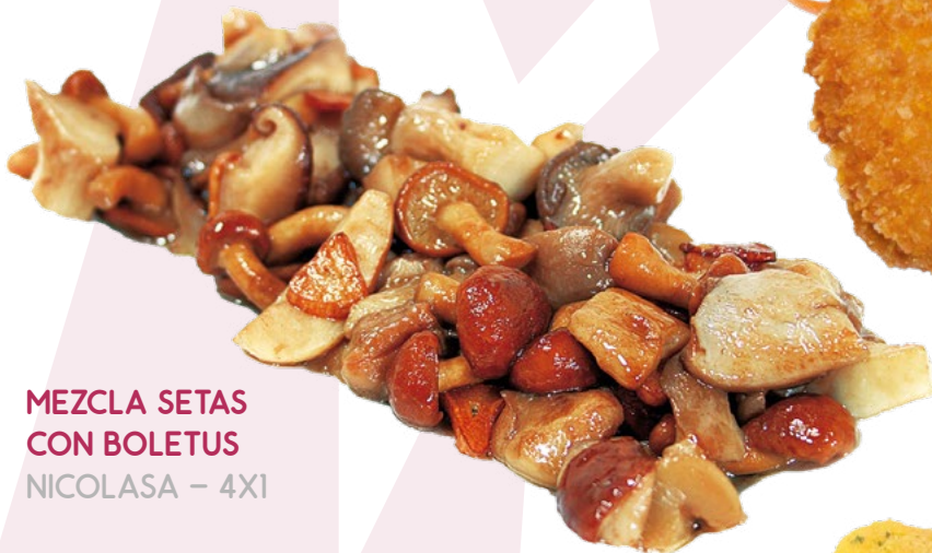
MEZCLA SETAS CON BOLETUS NICOLASA - 4X1