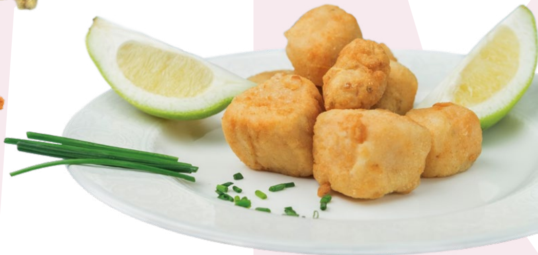
DADOS DE CAZÓN ENHARINADO MEGAMAR – 10X500GR.