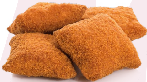
COSIÑAS DE CHORIZO CLAVO – 8X500.