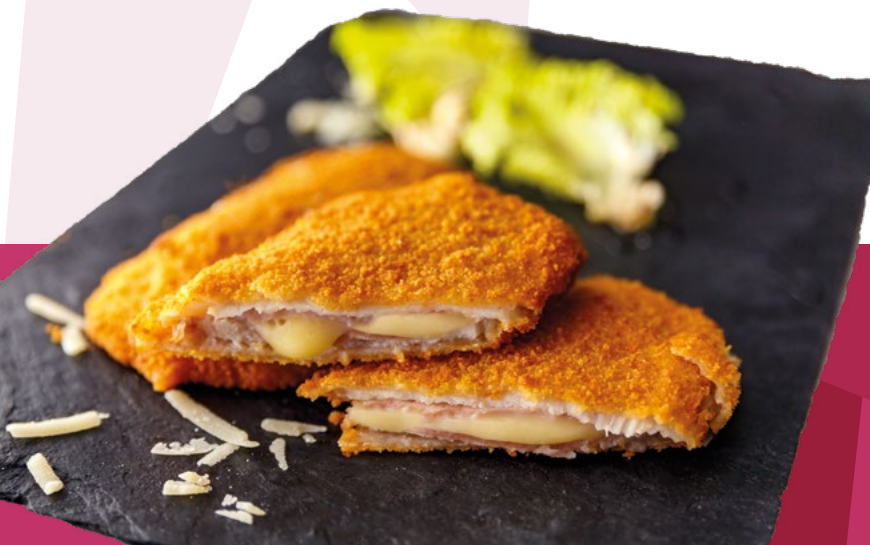
MINI CACHOPO CERDO AINUK – 4X1