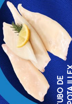
TUBO DE POTA ILLEX 0% GLASEO. ELABORADO EN ESPAÑA AINUK - 7KG

Nº213 PERIODO: DEL 22/07/2024 AL 24/08/2024