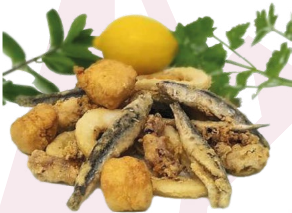
FRITURA MIXTA MEGAMAR – 5X800GR.