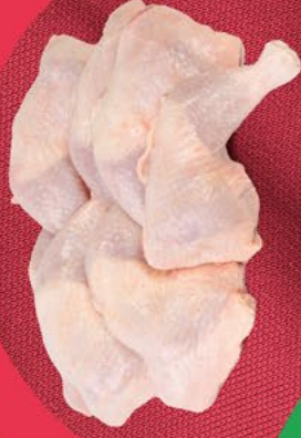
TRASEROS DE POLLO 300/400 BONPOLLO - 5KG