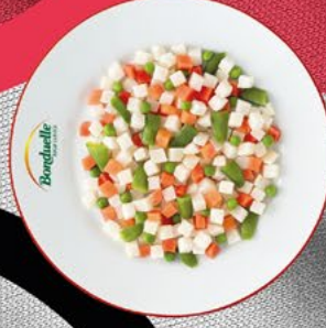
ENSALADILLA BONDUELLE - 4X2,5 KG