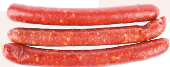
CHISTORRA AINUK – 2KG.