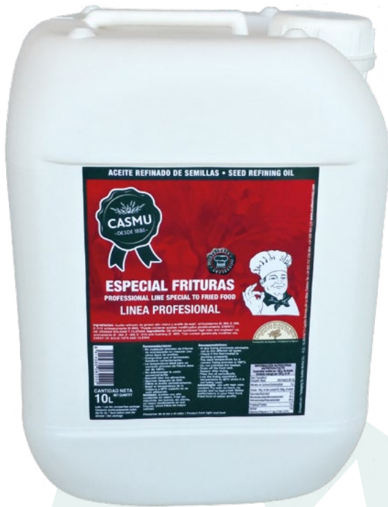
ACEITE DE FREIDORA CASMU – 10 LITROS