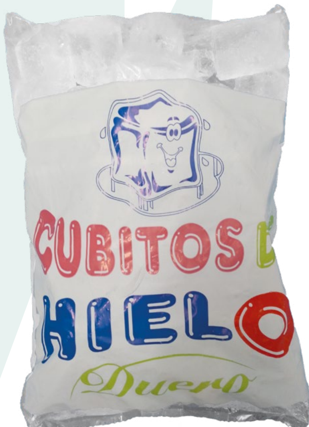
CUBITOS DE HIELO HIELOS DUERO – 5X2KG.