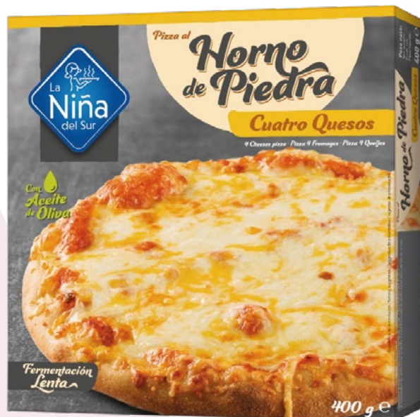
PIZZA 4 QUESOS LA NIÑA DEL SUR – 6X400GR