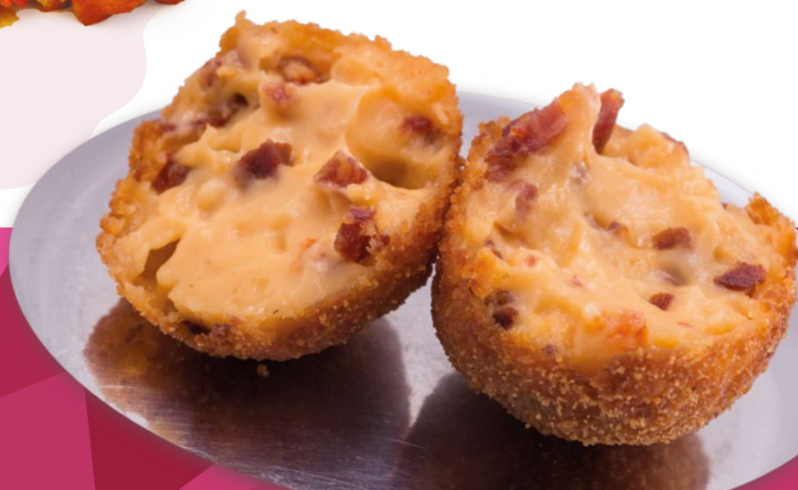
CROQUETA DE HUEVO CHORIZO AINUK - 8X500.