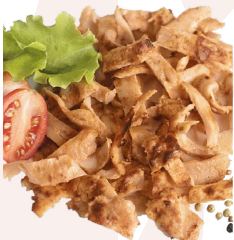
KEBAB DE POLLO LONCHEADO SIMON'S - 8X1KG.