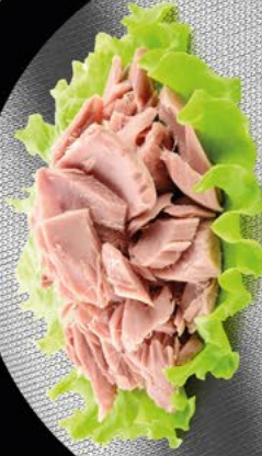
ATÚN EN ACEITE DE GIRASOL 80/20 SEAKINGS - 1KG.