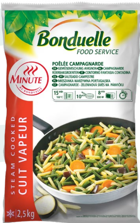
SALTEADO CAMPESTRE BONDUELLE – 4X2,5 KG.