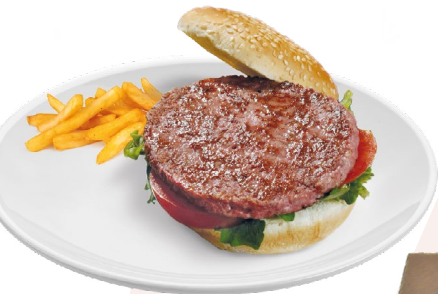
HAMBURGUESA TERNERA Y CERDO 110G SIMON'S - 3,5KG