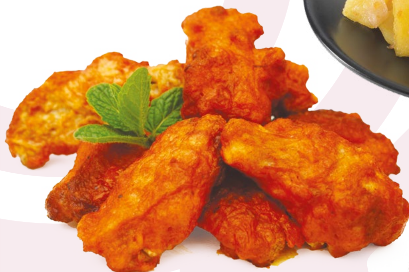
ALITA BBQ AINUK - 8X500