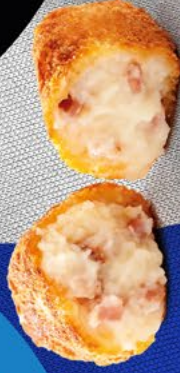
CROQUETA SUPREMA JAMON AINUK - 8X500