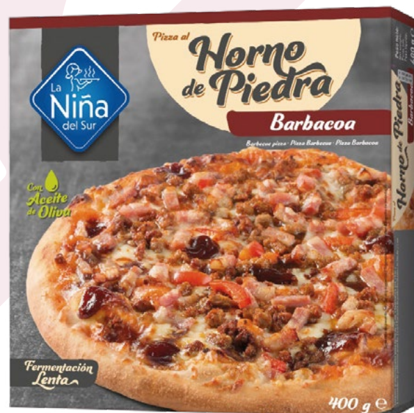
PIZZA BACON CON ATÚN LA NIÑA DEL SUR – 6X400GR