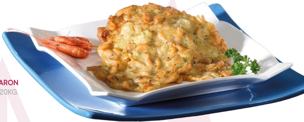
TORTILLITA DE CAMARON IBERCOOK – 4X720KG.