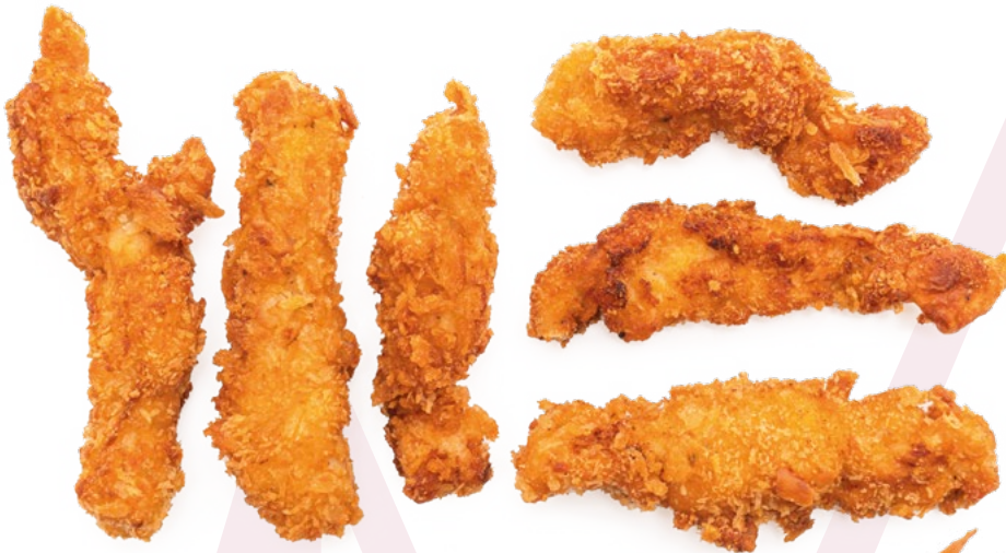
FINGER POLLO CLAVO - 4X1