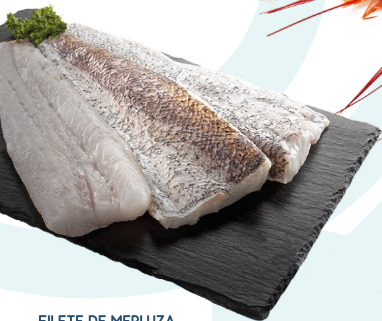
FILETE DE MERLUZA DEL CABO C/P 4/6 CONFREMAR - 5KG.