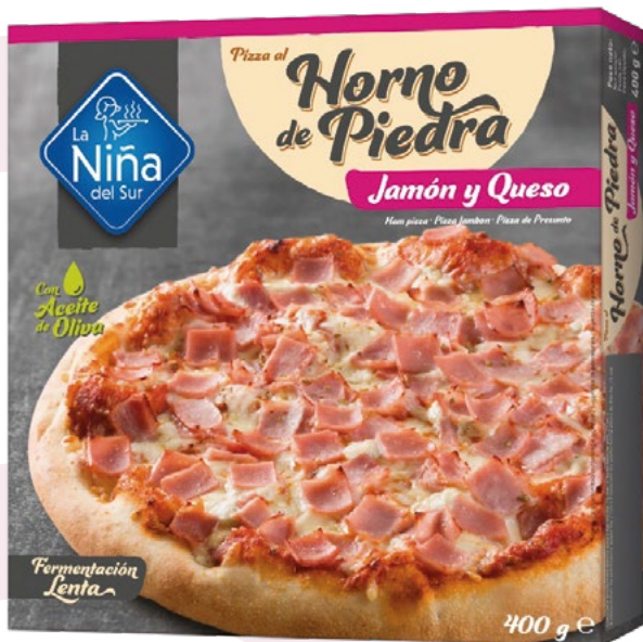
PIZZA HORNO DE PIEDRA JAMÓN Y QUESO LA NIÑA DEL SUR – 6X400GR