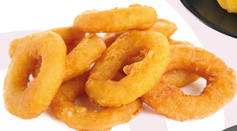
ANILLA REBOZADA IBERCOOK - 4X1