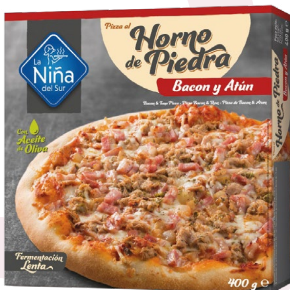
PIZZA BARBACOA LA NIÑA DEL SUR – 6X400GR