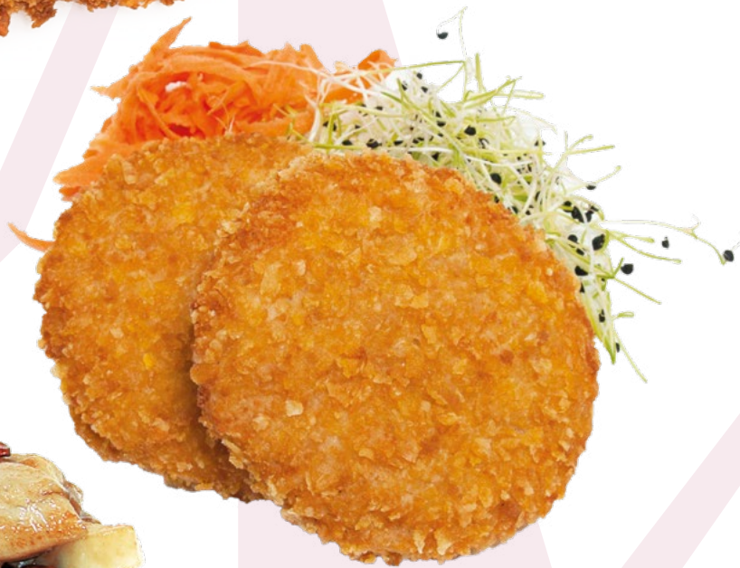
HAMBURGUESA CORN FLAKE CLAVO - 4X1