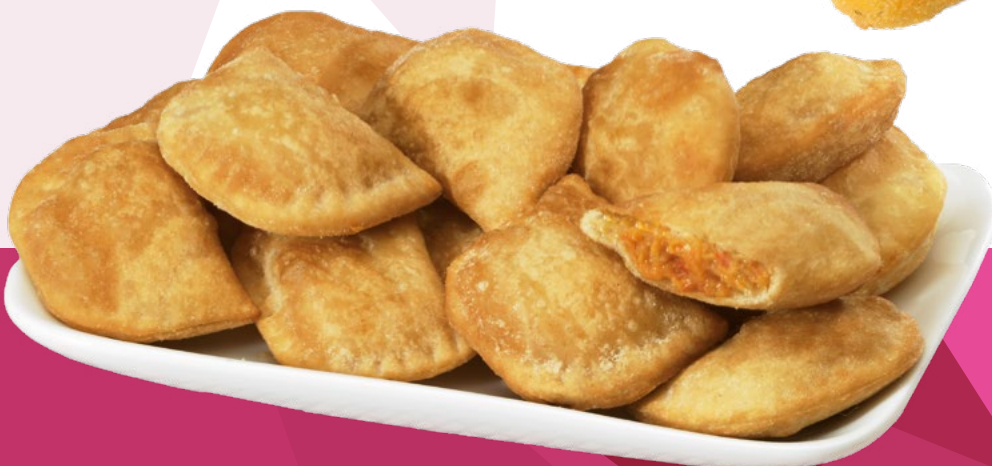
MINI EMPANADILLA ATÚN AINUK - 4X1