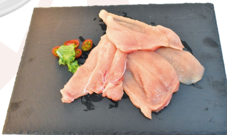
FILETE DE PECHUGA ABIERTO EN BANDEJA AVIMAHER - 4X1KG.