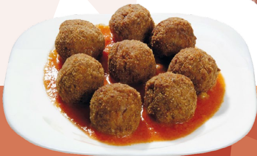
ALBONDIGA MIXTA TERNERA Y CERDO SIMONS - 4X1KG.