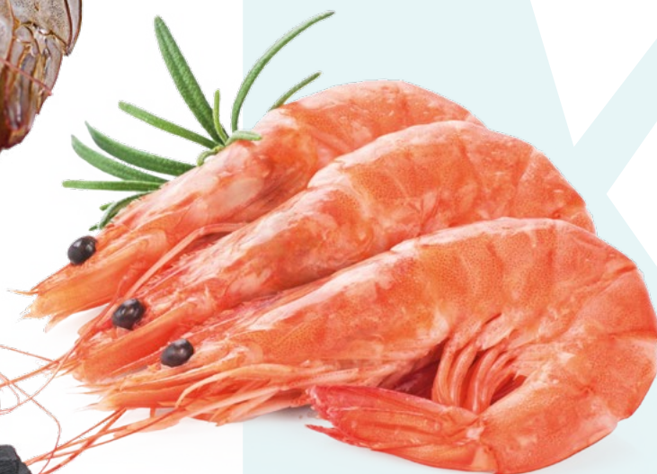
LANGOSTINO VANNAMEI COCIDO PREMIUM 25/35 PZ AINUK – 4X2KG.