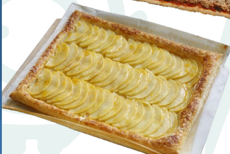
PLANCHA DE MANZANA AINUK -1,8KG.