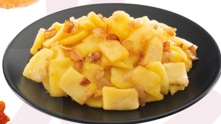
FONDO DE PATATA CON CEBOLLA AINUK - 8X1KG.