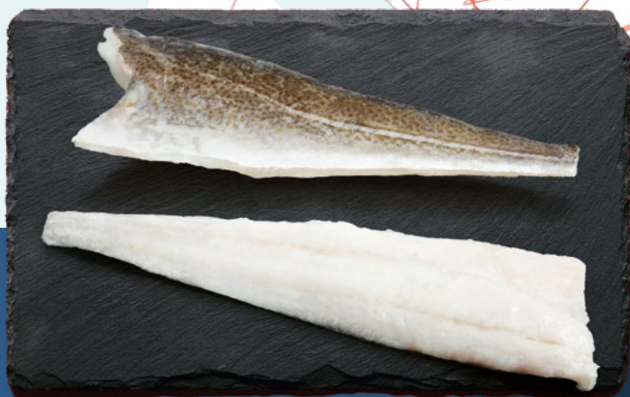
BACALAO FILETE +1000 SEAWORK – 11KG.