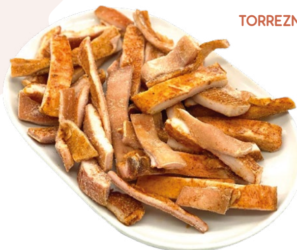
TORREZNOS PARA FREIR AINUK – 2X2KG.