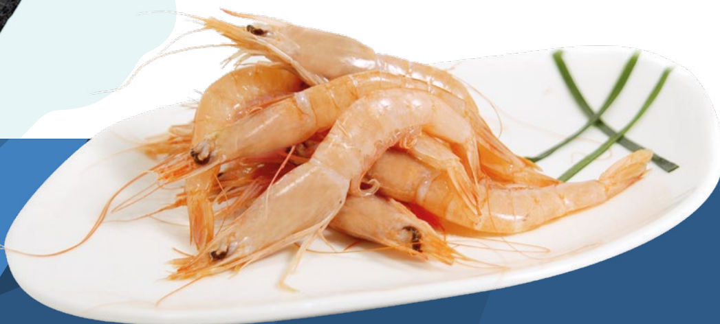
GAMBA BLANCA N.00 60/70 DELFIN - 9X1KG.