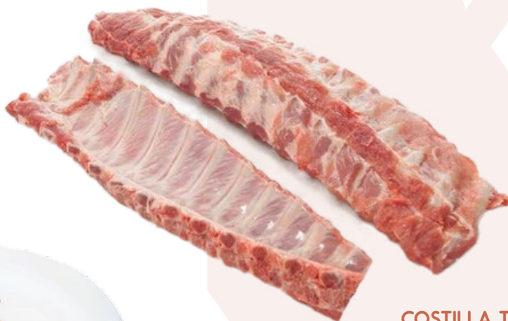
COSTILLA TIRA BONPOLLO - 10KG. APROX.