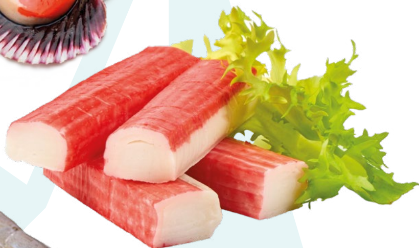
PALITOS DE CANGREJO PESCATRADE – 6X1KG.