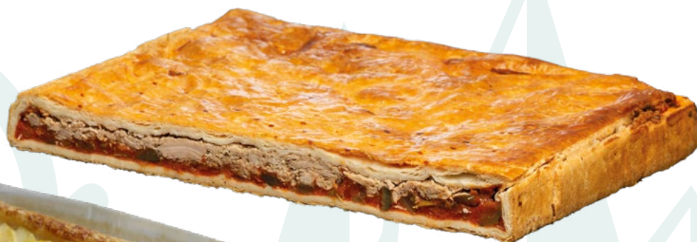
EMPANADA DE ATUN AINUK - 2X2,250GR.