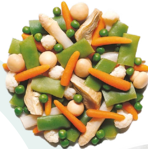
MENESTRA ESPECIAL CON ESPARRAGOS BONDUELLE – 4X2,5 KG.