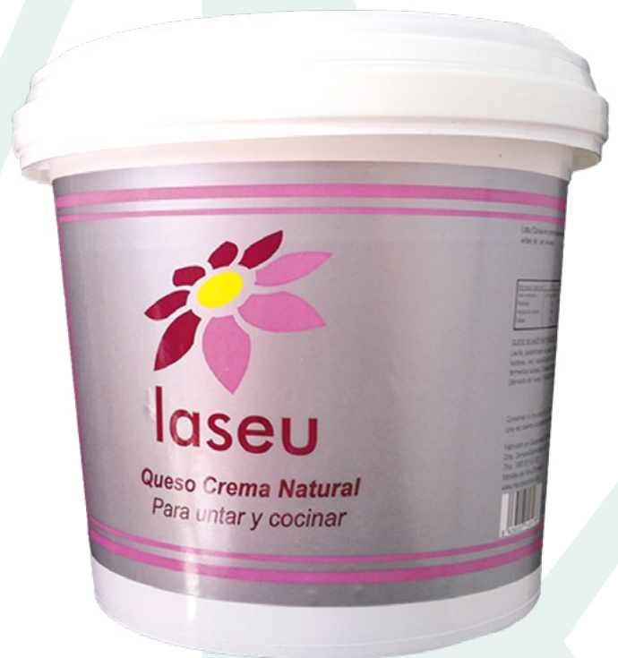
QUESO CREMA CUBO LASEU – 2KG.