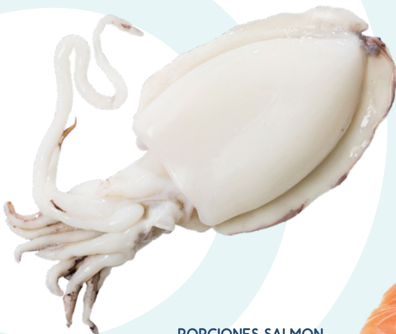
SEPIA 600/800 G AINUK – 6KG.