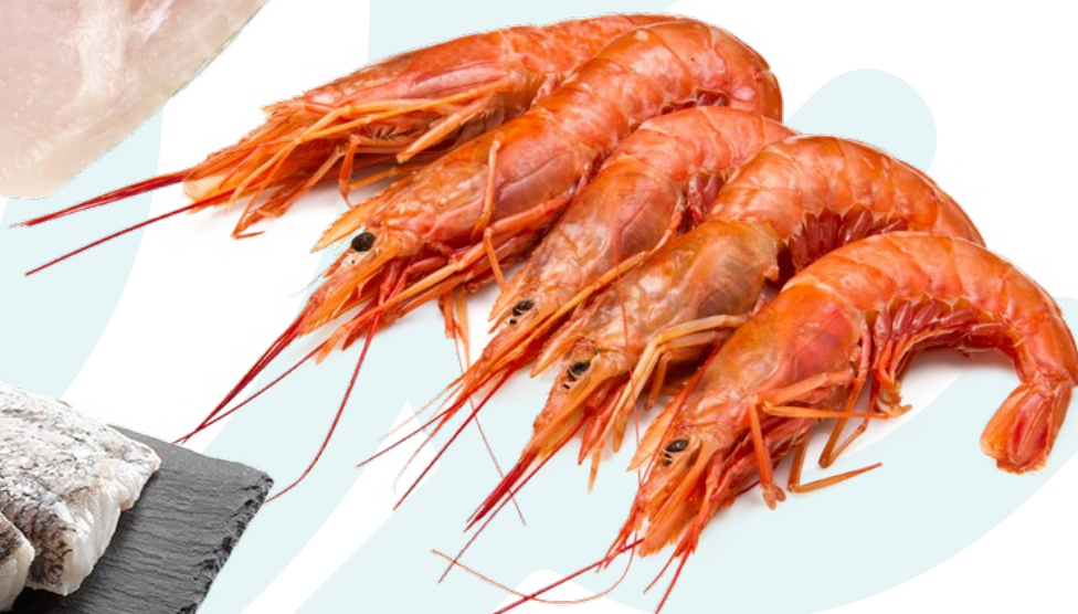
GAMBON TIERRA N.2 DELFIN - 6X2KG GAMBON TIERRA N.3 DELFIN - 6X2KG