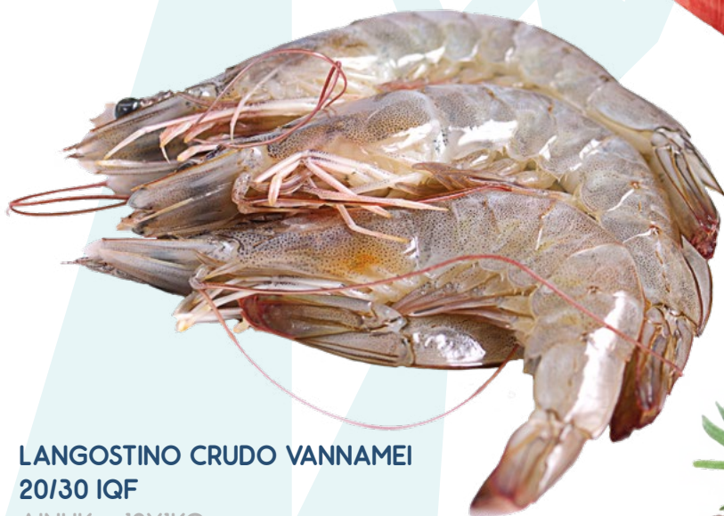
LANGOSTINO CRUDO VANNAMEI 20/30 IQF AINUK – 12X1KG.