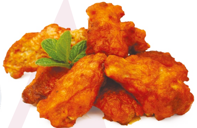
ALITA BARBACOA AINUK – 8X500GR.