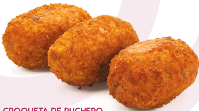
CROQUETA DE PUCHERO AINUK - 8X500GR.