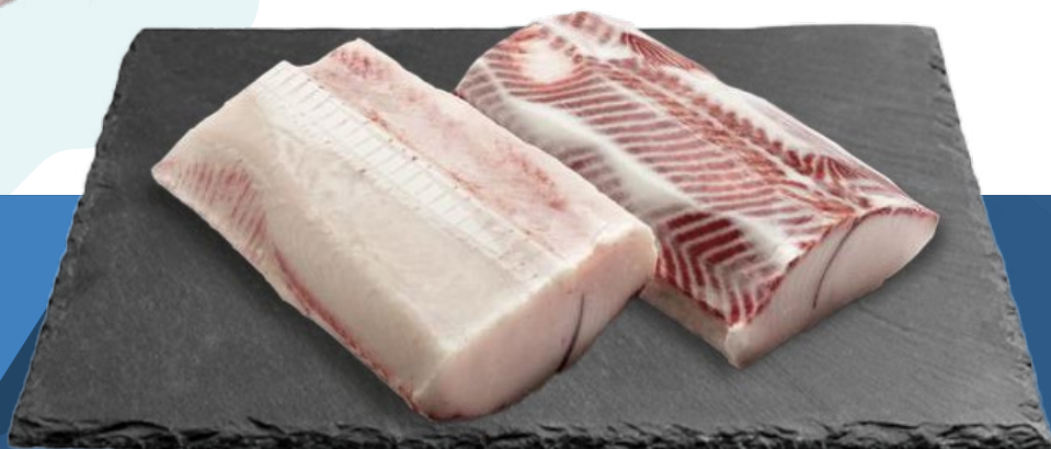
LOMOS CAELLA AYR – 3-5KG