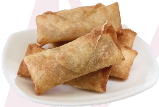
ROLLITO DE PRIMAVERA IBERCOOK – 4X1