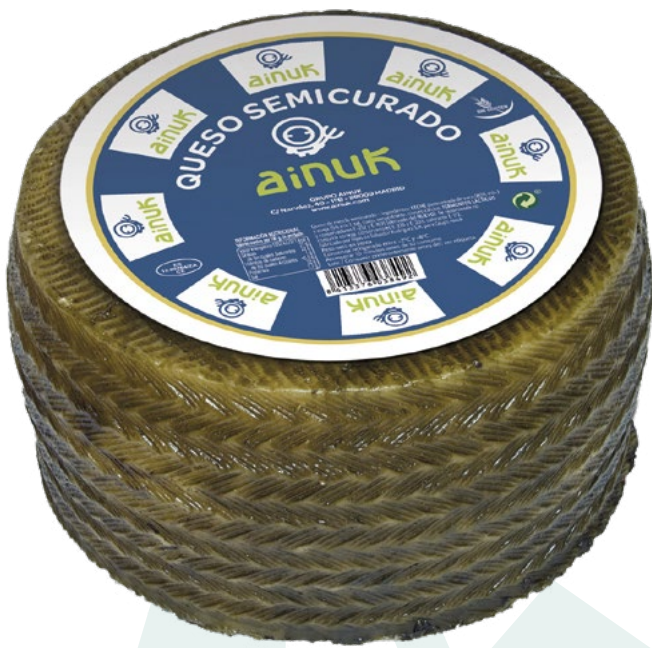
QUESEURO MEZCLA SEMICURADO AINUK – 3KG. APROX.