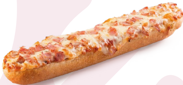
PAN PIZZA YORK LA NIÑA DEL SUR - CAJA 24 UNIDADES