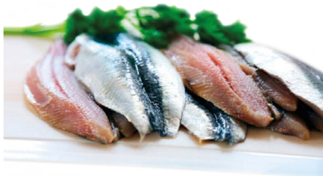
FILETE DE SARDINA AYR – 4KG.