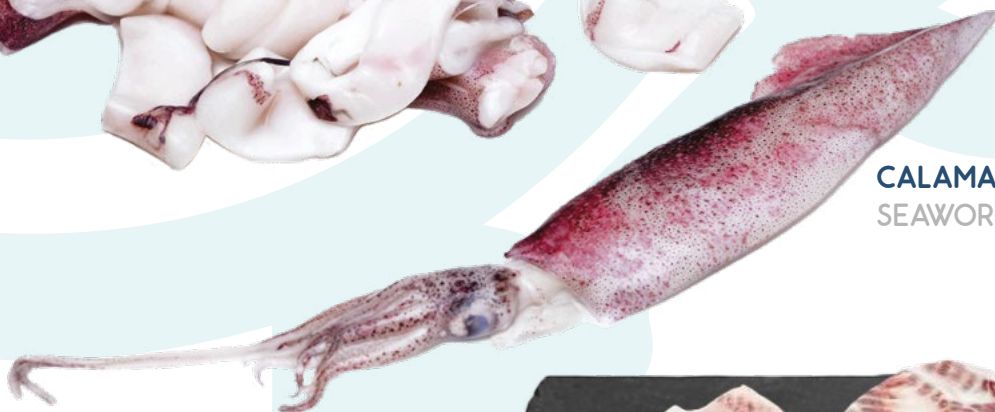
CALAMAR TROCEADO SEAWORK – 5X1KG.