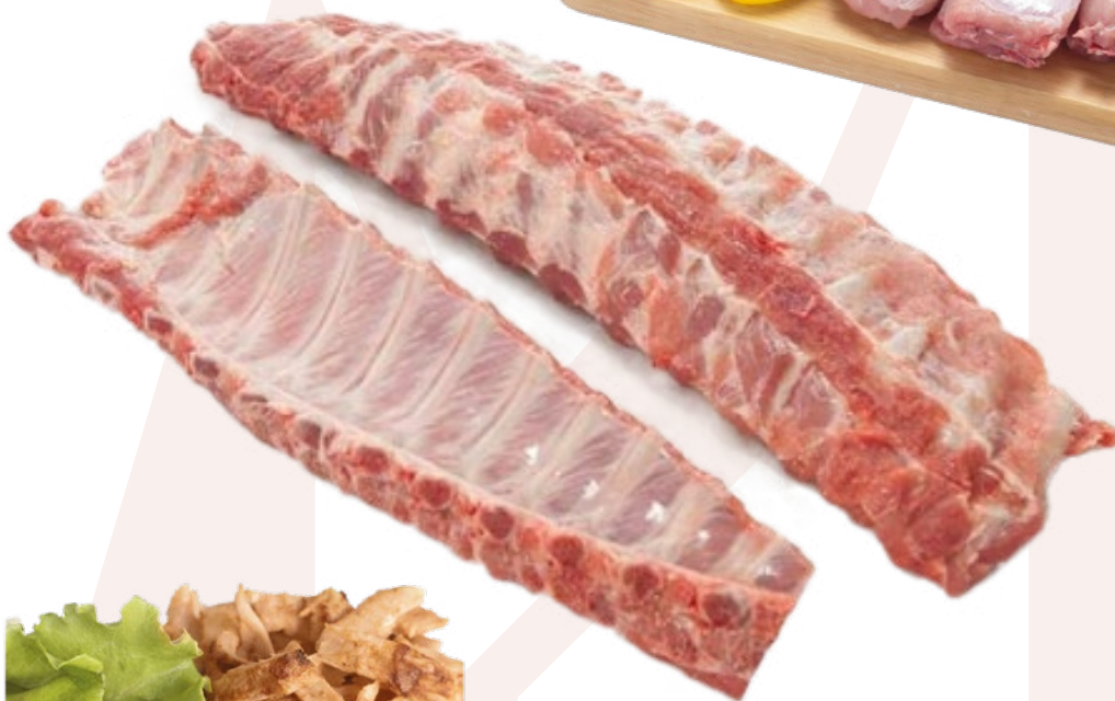
COSTILLA TIRA – 10 UDS CAJA/PAQUETE DE 2 UDS PATEL – 10KG APROX.