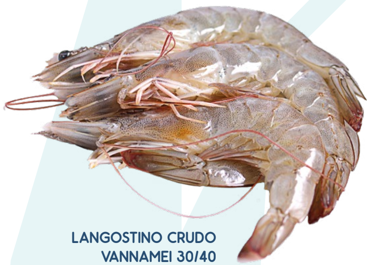
LANGOSTINO CRUDO VANNAMEI 30/40 PESCATRADE - 12X1KG.