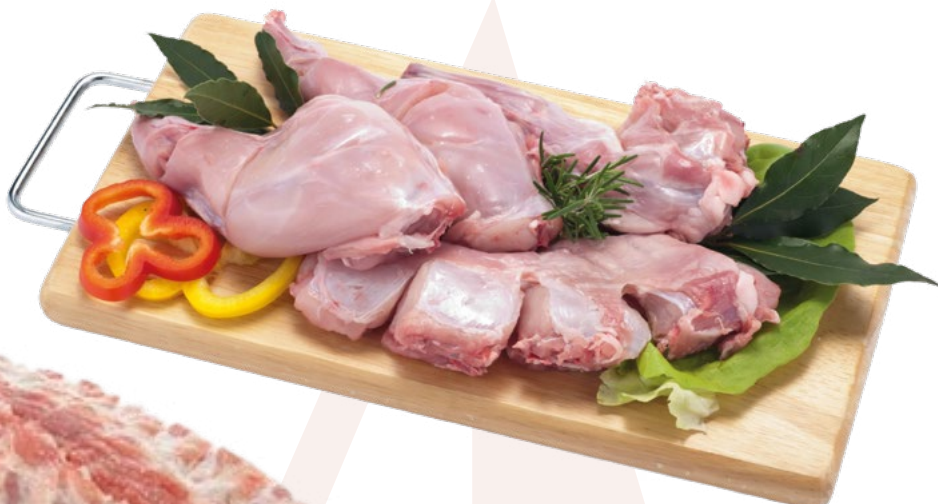
CONEJO TROCEADO HERMI – 5X1KG.