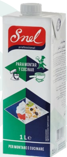
NATA LIQUIDA MONTAR Y COCINAR SNEL - 12X1L.