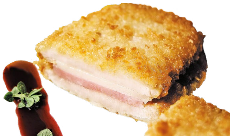
MINI CACHOPO DE LOMO AINUK - 6X500GR.