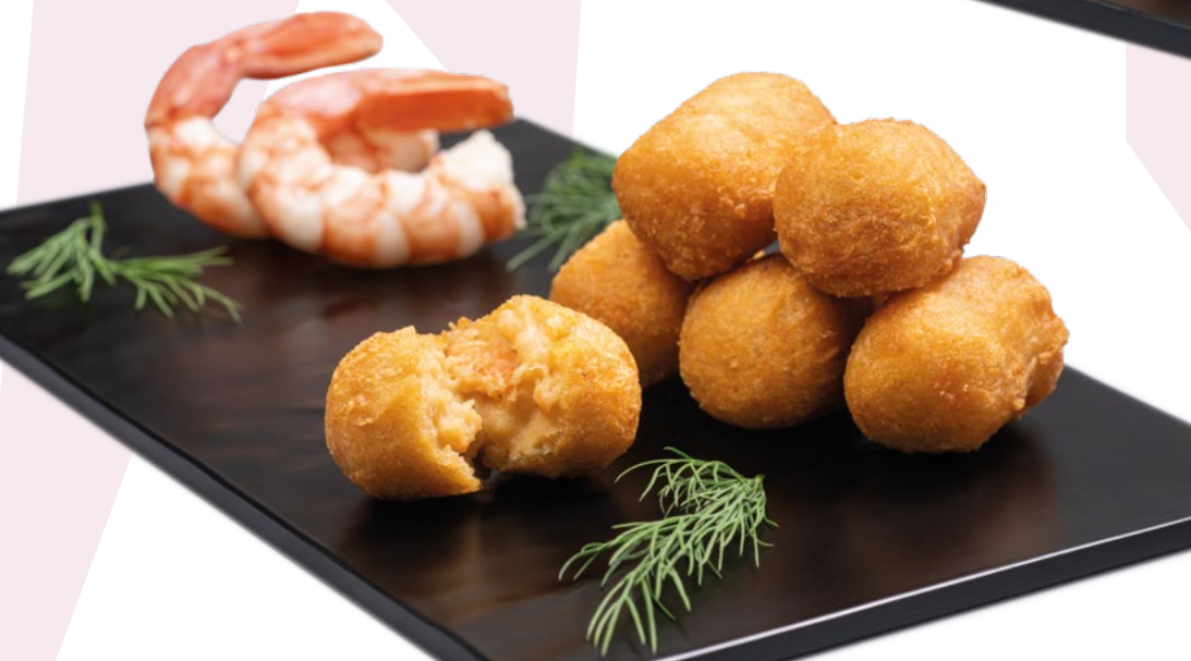
CROQUETA DE LANGOSTINOS EN TEMPURA HORNEABLE PCS – 3X1KG