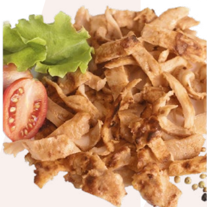
KEBAB DE POLLO LONCHEADO SIMON'S – 8X1KG.