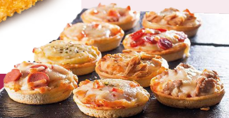
SUSPICOLINOS – MINI PIZZAS VARIADAS (JAMÓN, ATÚN Y 3 QUESOS) LA NIÑA DEL SUR 3KG. 100 UNIDADES VARIADAS