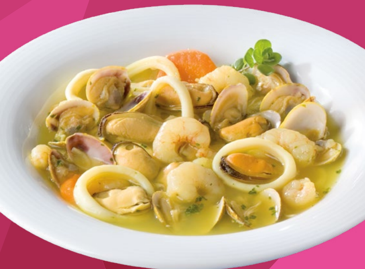
PREPARADO DE SOPA AINUK - 4X1KG.