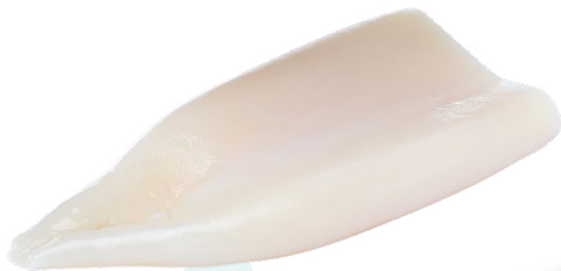
POTA TUBO GIGAS 200/400. MB - 5KG.