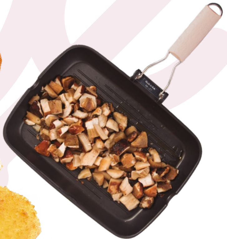
BOLETUS TROCEADO CLAVO - 4X1KG.