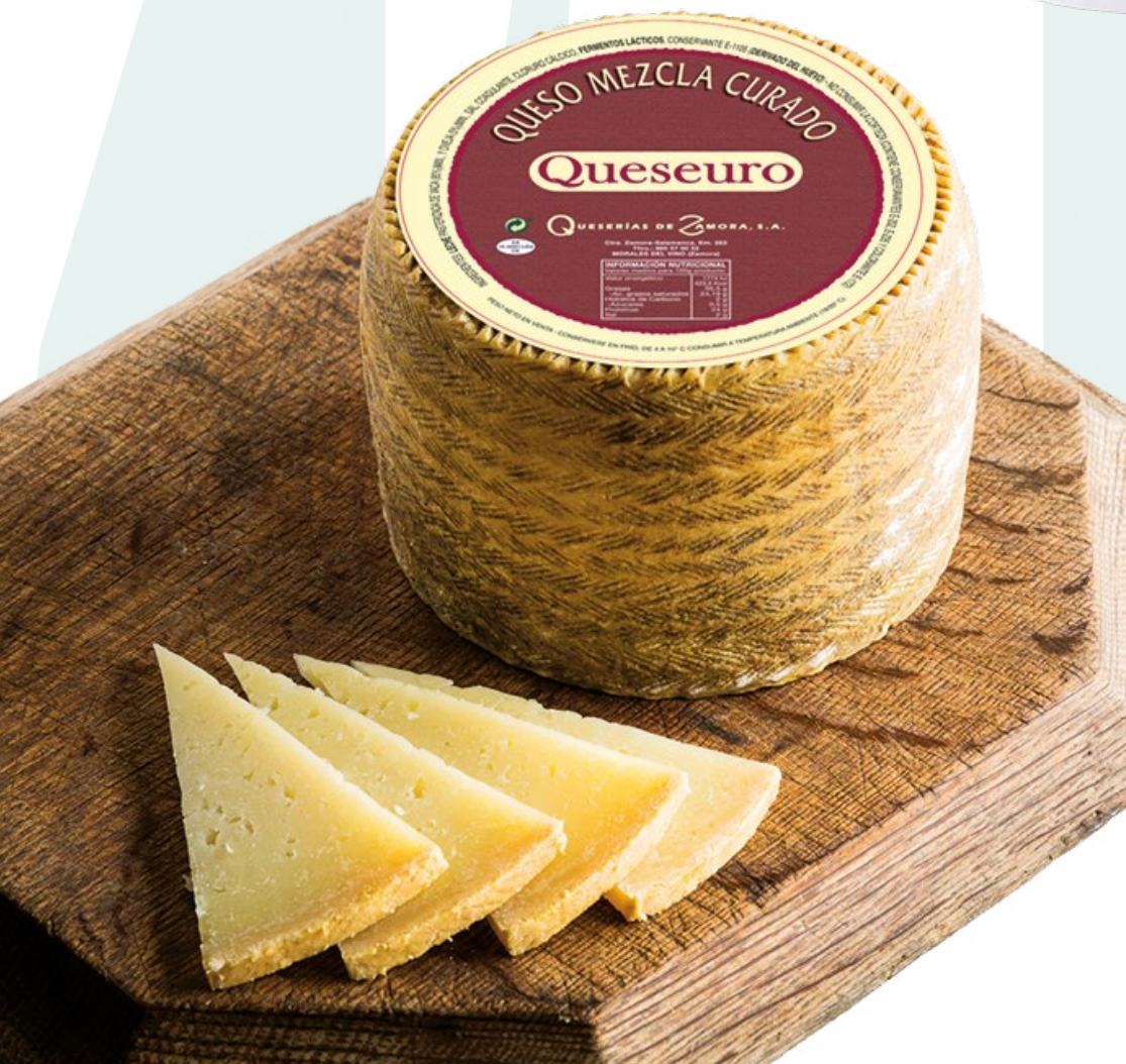
QUESEURO MEZCLA CURADO AINUK – 3KG. APROX.