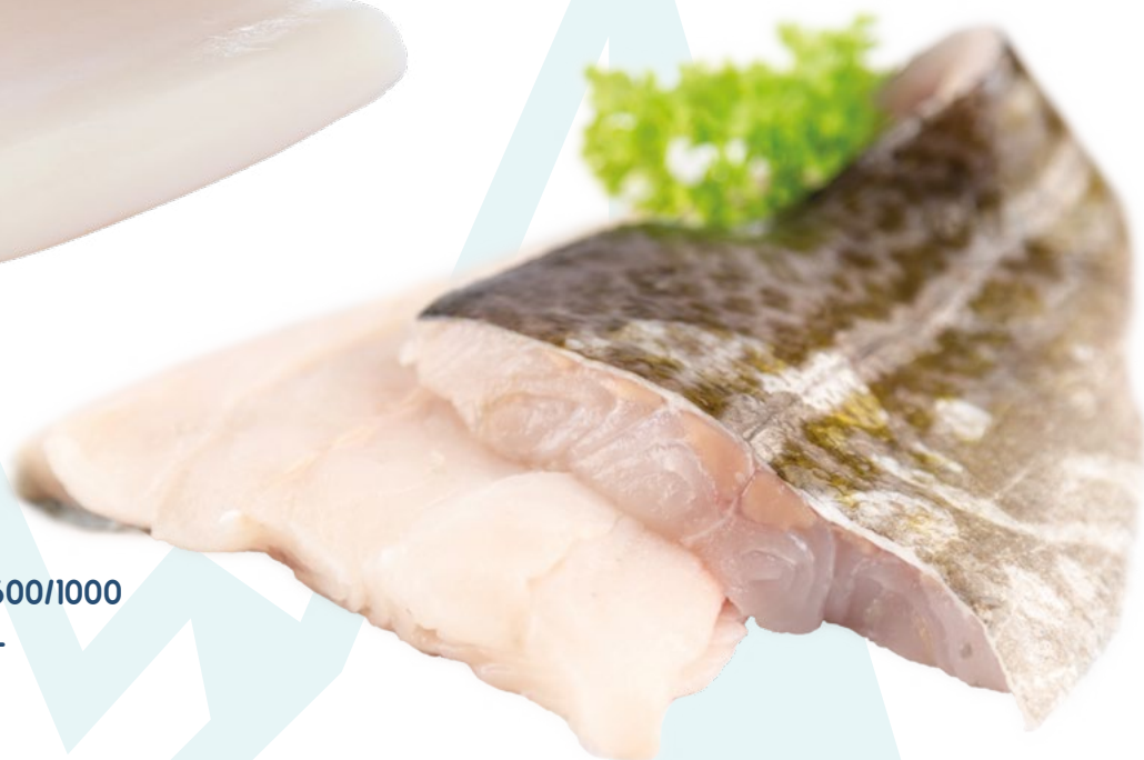
FILETE DE FOGONERO 500/1000 CON PIEL PUNTO DE SAL ICELANDIC - 1X11KG