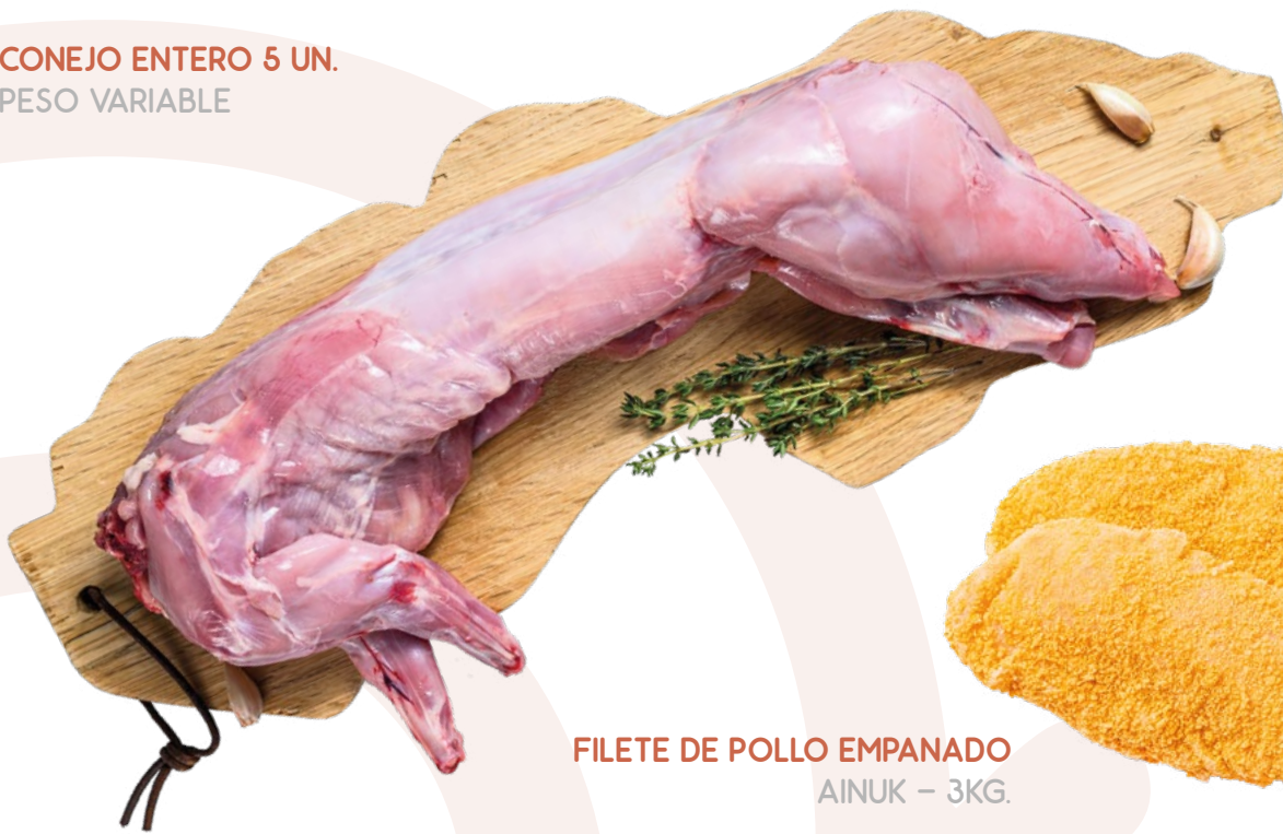
FILETE DE POLLO EMPANADO AINUK - 3KG.