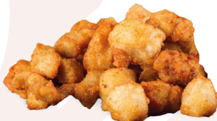
TAQUITO DE CERDO EMPANADO AINUK - 4KG.