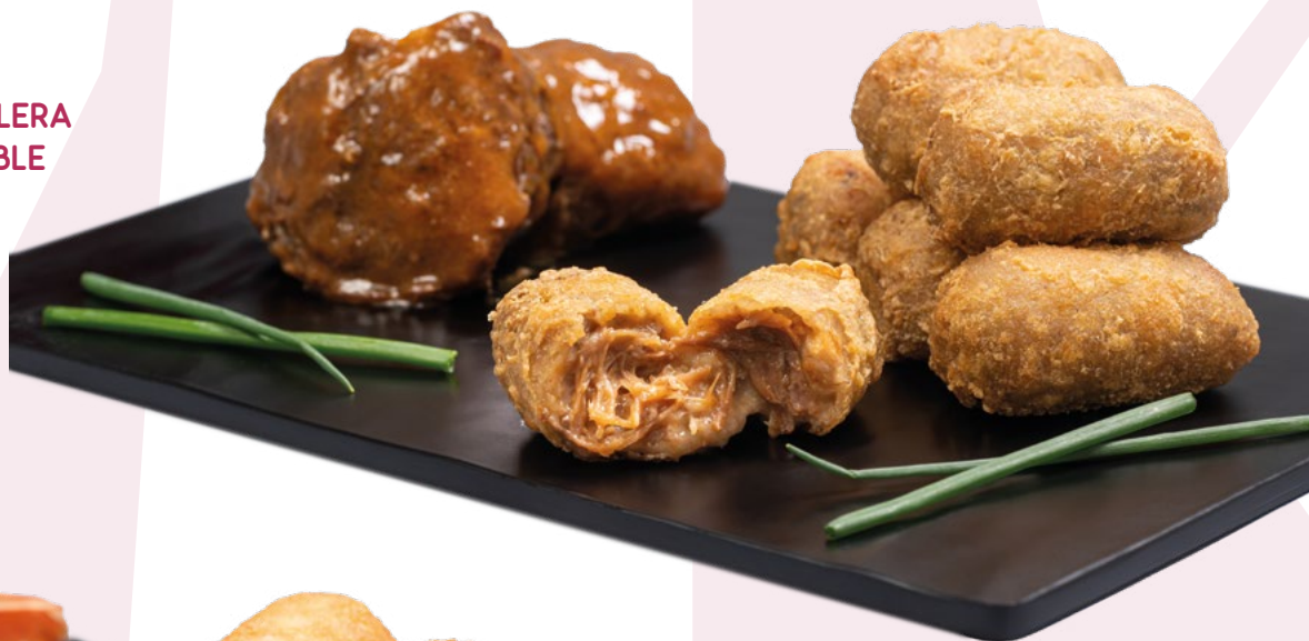
CROQUETA DE CARRILLERA EN TEMPURA HORNEABLE PCS – 3X1KG