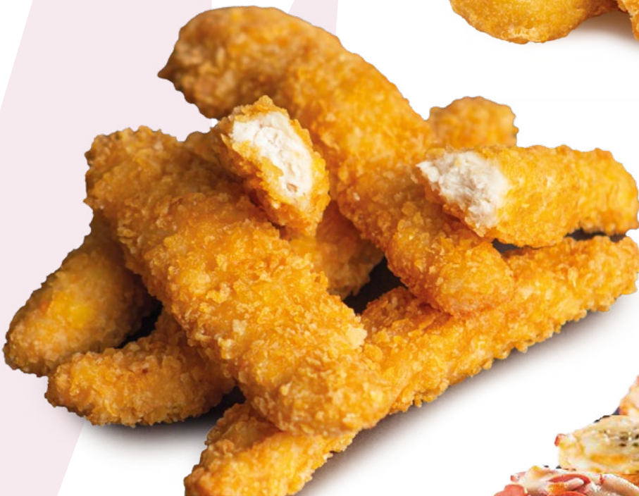
FINGUER DE POLLO CORN FLAKES CLAVO – 4X1KG.