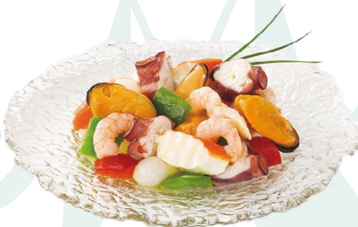
SALPICON AINUK - 2X1KG.