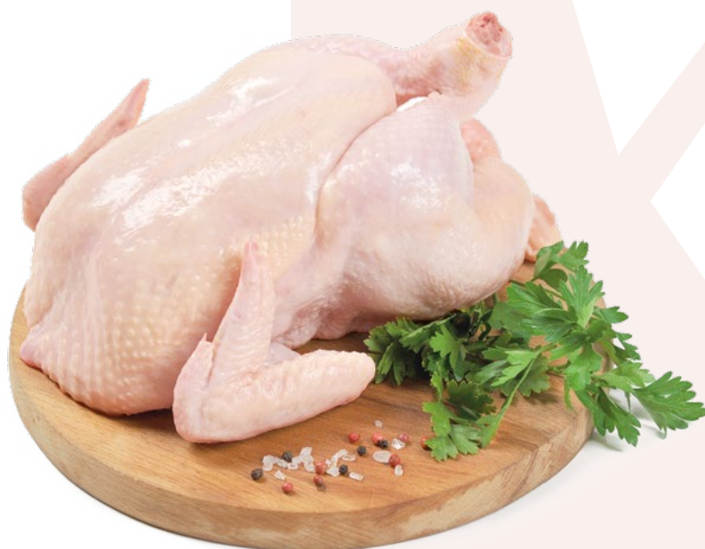
PICANTON 300-400GR. URGASA – 10X2 UNIDADES