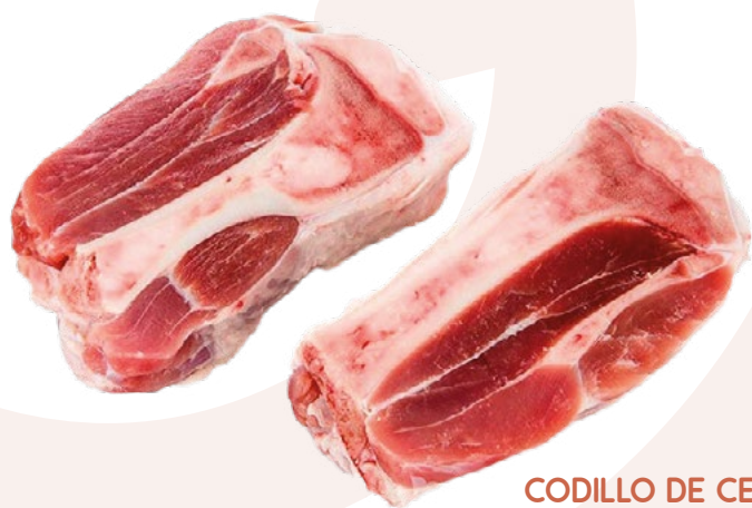
CODILLO DE CERDO AL MEDIO AINUK - 6KG.