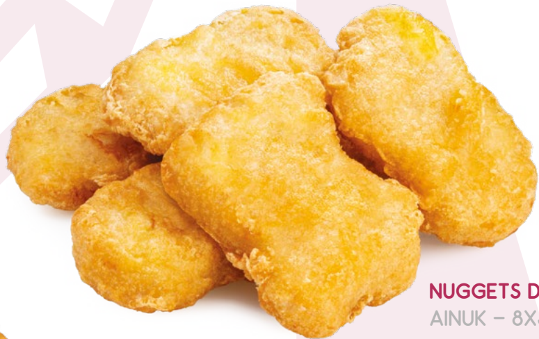
NUGGETS DE POLLO AINUK – 8X500GR.