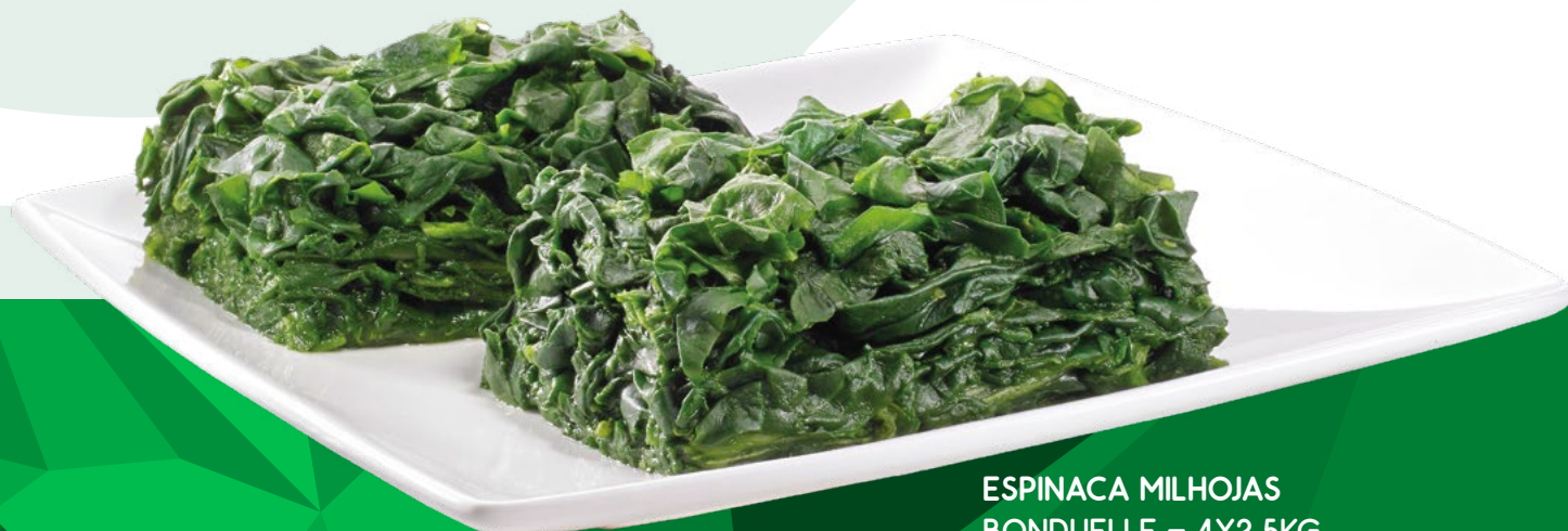
ESPINACA MILHOJAS BONDUELLE - 4X2,5KG.