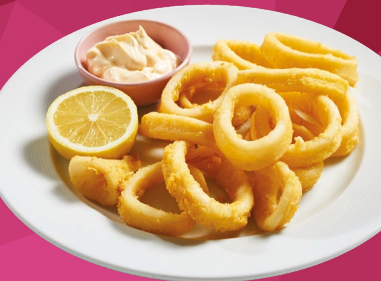
ANILLAS ENHARINADAS TRADICIONALES PCS - 1,5KG.