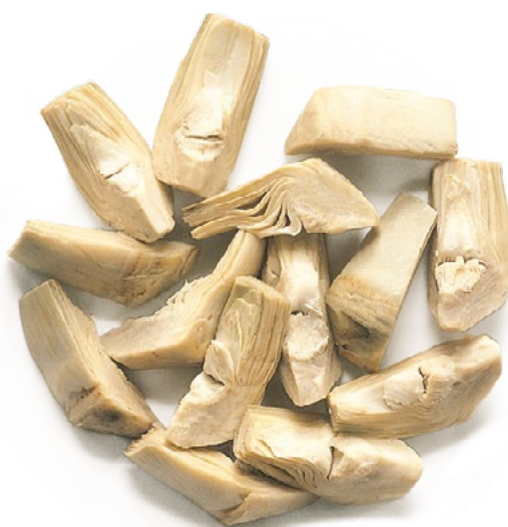
ALCACHOFA CORTADA BONDUELLE - 4X2,5KG.