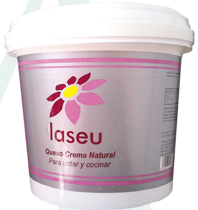
QUESO CREMA CUBO LASEU – 2KG.