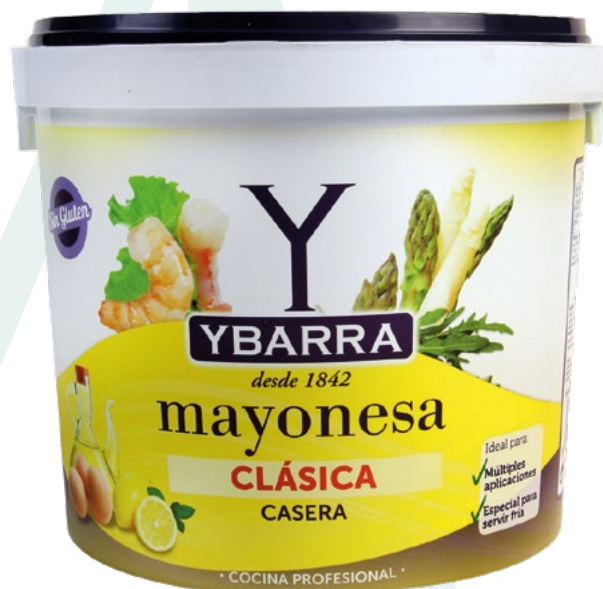
MAYONESA CLASICA YBARRA – 2X5KG.