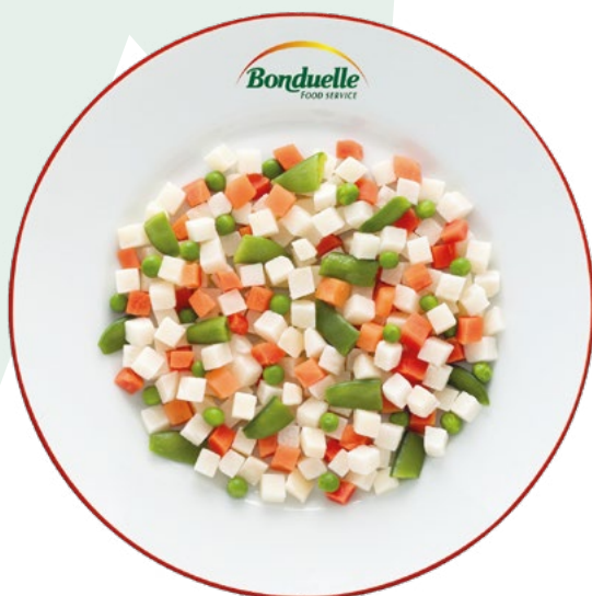
ENSALADILLA BONDUELLE – 4X2,5KG