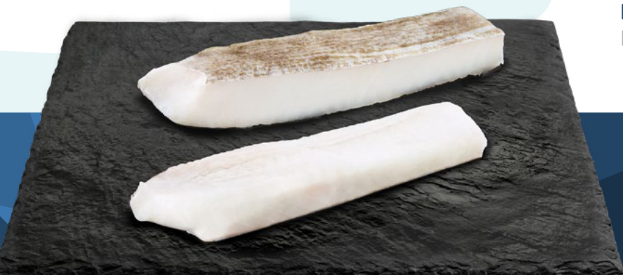
SOLOMILLO DE BACALAO PUNTO SAL 900-1100 ICELANDIC – 1X5KG.