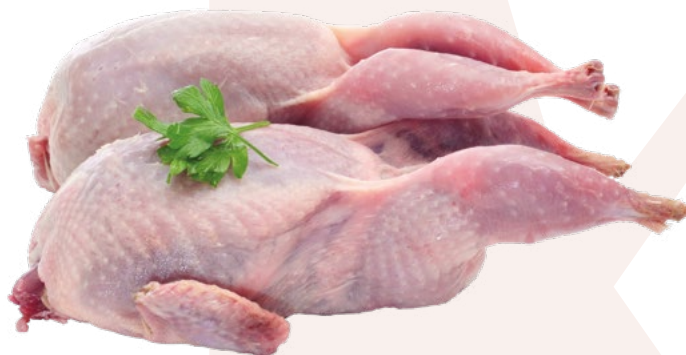
CODORNIZ ESPECIAL 4 UNIDADES URGASA – 6X4UNIDADES