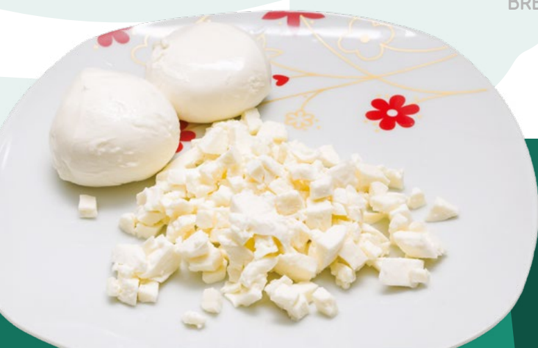
MOZZARELLA FUNDIDA DADO 6X1KG.