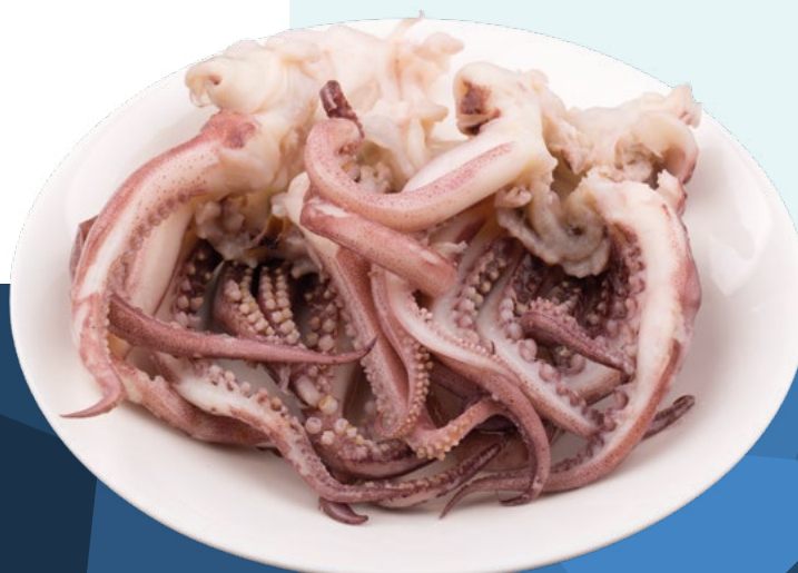
REJO DE POTA IQF ALFRIO – 5KG.