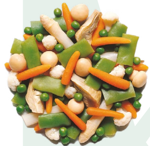
MENESTRA ESPECIAL BONDUELLE – 4X2,5KG