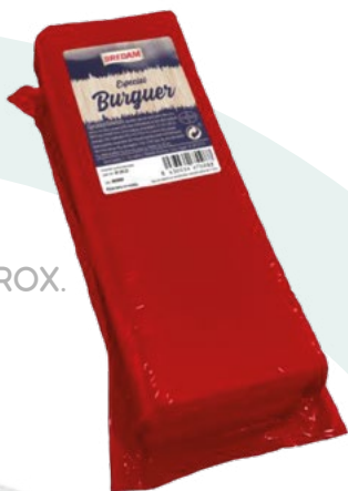
BARRA SANDWICH PREMIUM BREDAM – 3 KG. APROX.