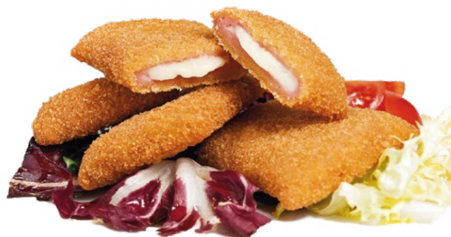
MINI SAN JACOBO AINUK - 8X500 GR