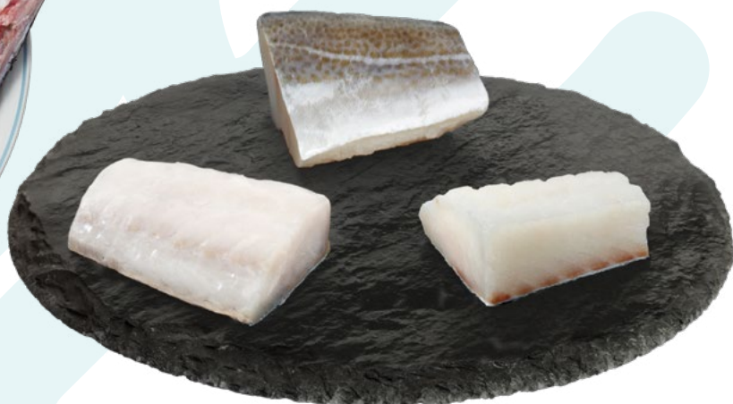
LOMOS Y CENTROS BACALAO PUNTO SAL 150-250GR ICELANDIC – 1X5KG.