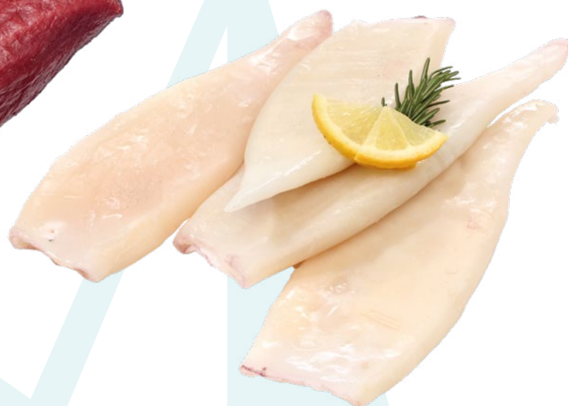
TUBO DE POTA PREMIUM AINUK – 7KG..