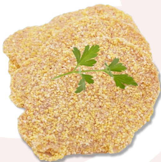
CINTA DE LOMO EMPANADA AINUK - 3KG