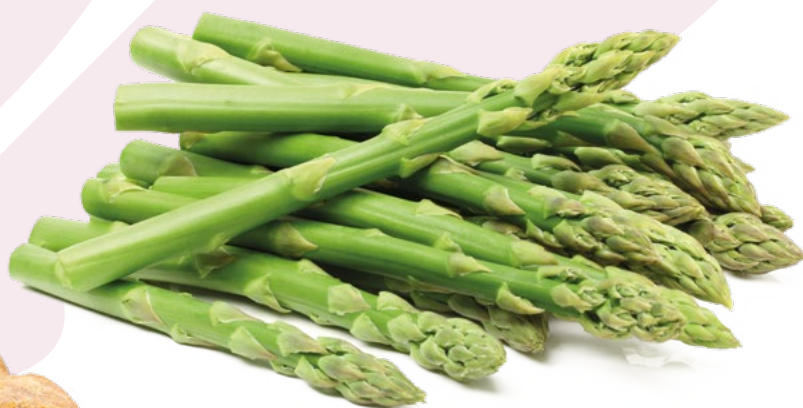
ESPARRAGOS VERDES PCS - 5X1KG