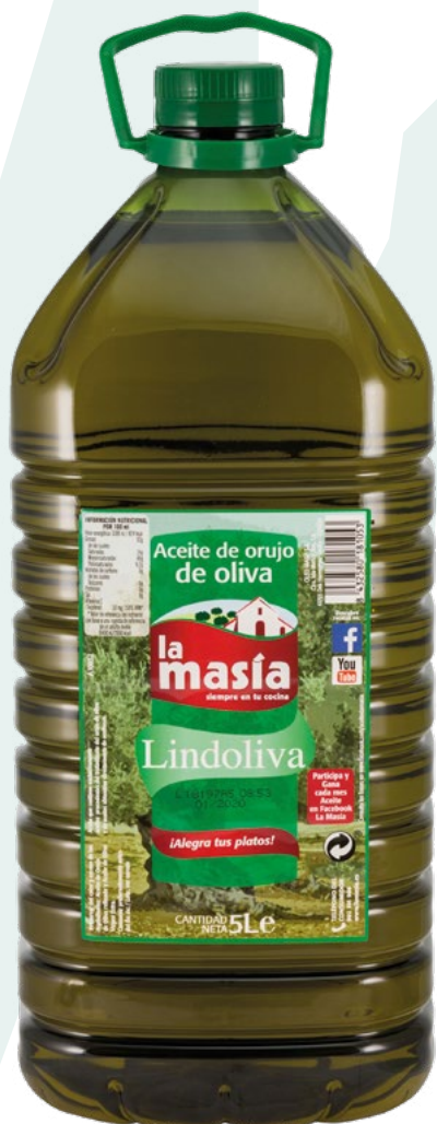
ACEITE DE ORUJO LINDOLIVA LA MASIA – 3X5/L 4,75 €/L.