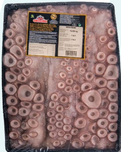
PULPO CRUDO 5–6KG. EN BANDEJA. NEW CONCISA – PESO VARIABLE.