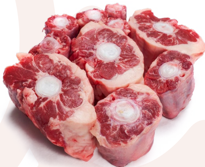
RABO DE AÑOJO CORTADO MIMAR - 6KG.