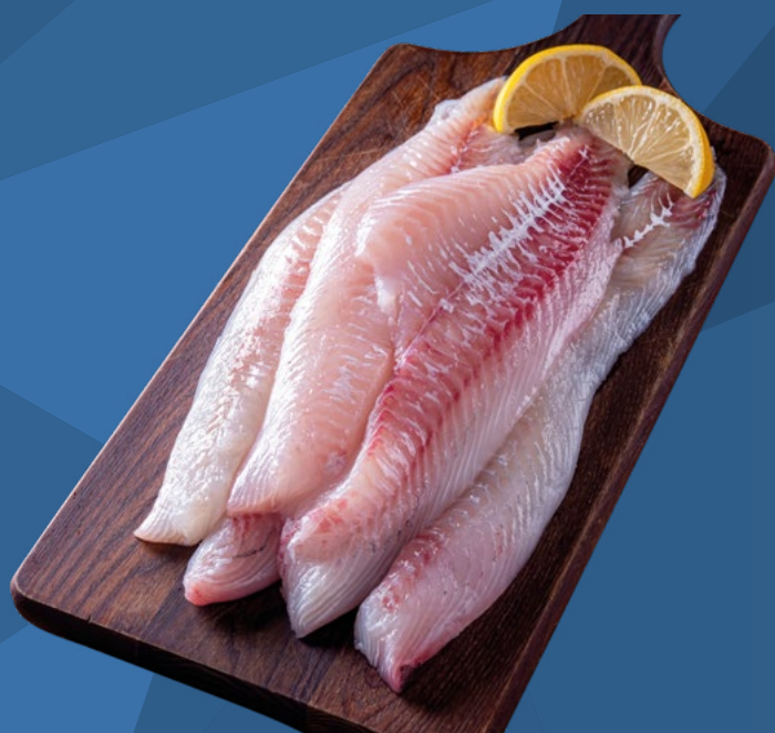
FILETE DE GALLINETA 100/250 NEW CONCISA – 6X1KG.