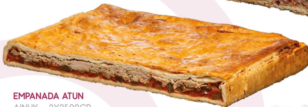
EMPANADA ATUN AINUK - 2X2500GR.