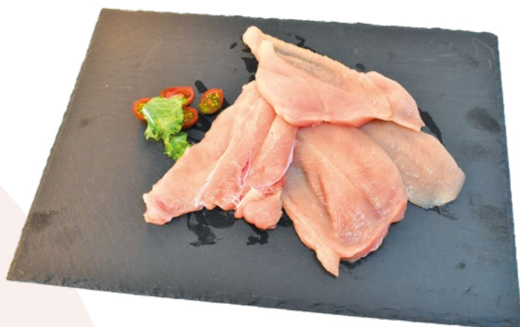
FILETE DE PECHUGA ABIERTO EN BANDEJA AINUK - 4X1KG