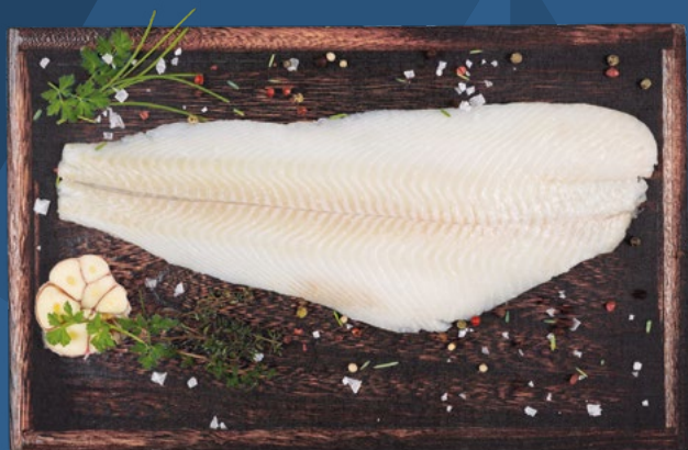
FILETE DE HALIBUT 100/200 NEW CONCISA – 6X1KG.