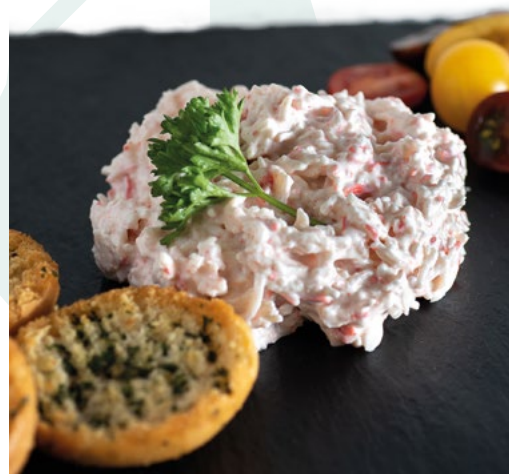
PINCHO DEL NORTE ENSALANDIA – 4X1 KG