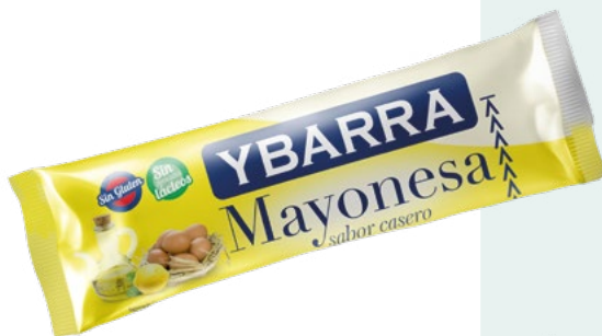
MAYONESA STICK YBARRA – 252X12ML.