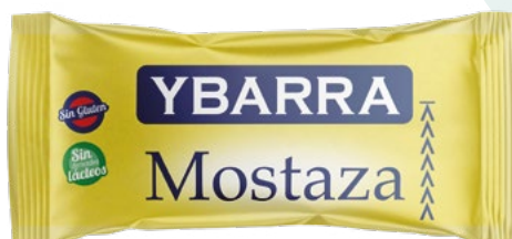
MOSTAZA STICK YBARRA – 204X9ML. 9,10 €/Caja