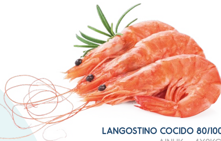
LANGOSTINO COCIDO 80/100 AINUK – 4X2KG.