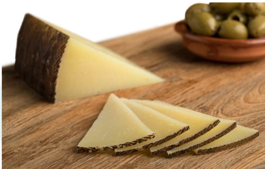
QUESO CURADO DE OVEJA 100% LECHE CRUDA EL PASTOR – 2X3,2KG