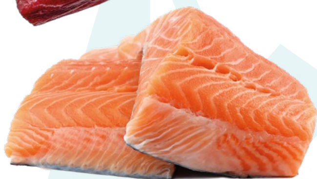
SALMON EN PORCIONES NEW CONCISA – 6X1KG.