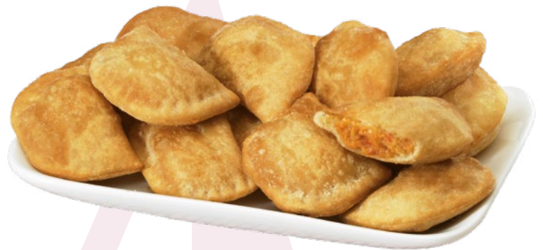
MINI EMPANADILLA ATÚN. AINUK – 4X1