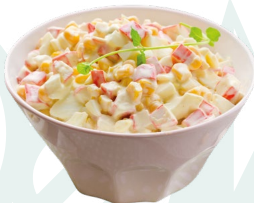
ENSALADILLA CANGREJO ENSALANDIA – 4X1 KG