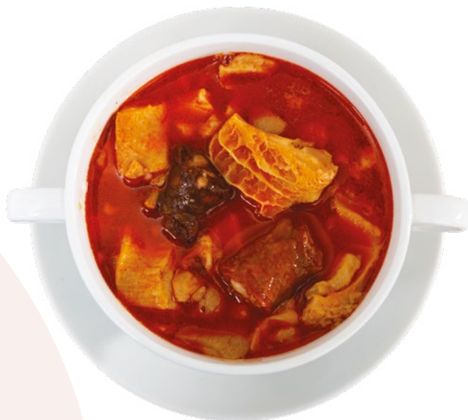
CALLOS A LA MADRILEÑA CANORTE – 5X1 KG APROX