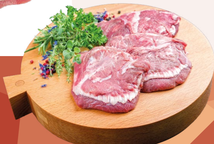
CARRILLADA CERDO MARBEIRA – 6KG.