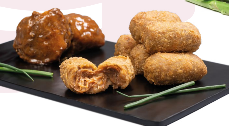
CROQUETA DE CARRILLERA EN TEMPURA (HORNEABLE) PCS - 3X1KG