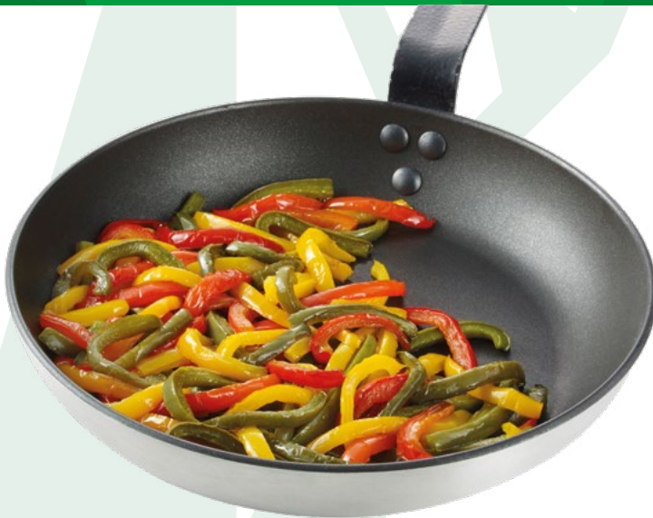
JULIANA DE PIMIENTOS PREFRITOS BONDUELLE – 6X1KG.