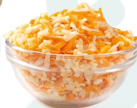
RALLADO GRATINAR MIX HEBRA BREDAM – 6X1KG.