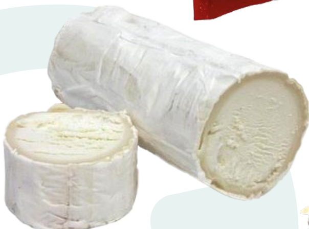
RULO DE CABRA AINUK – 2X1KG