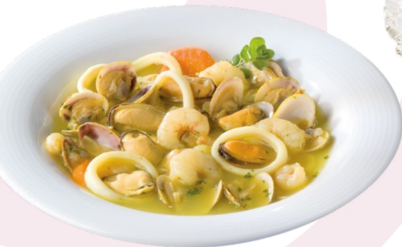
PREPARADO SOPA MARISCO AINUK - 4X1KG