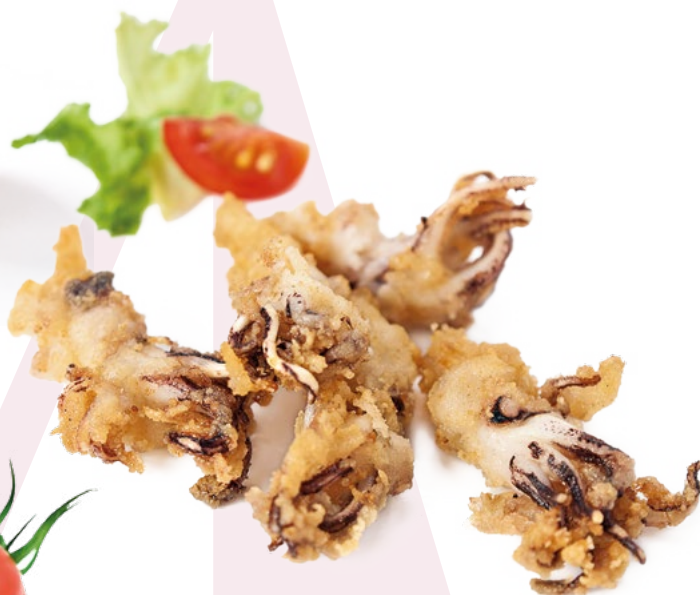
PUNTILLA ENHARINADA CLAVO - 1X2KG