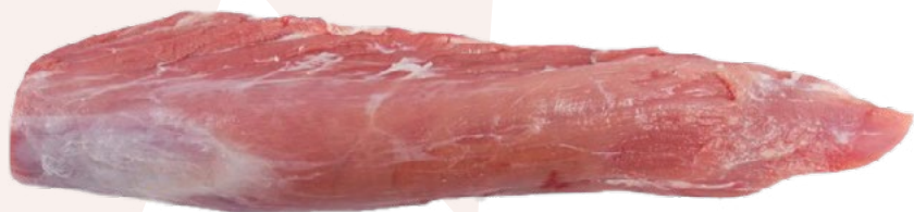
SOLOMILLO DE CERDO S/C OLIVA – 6KG.