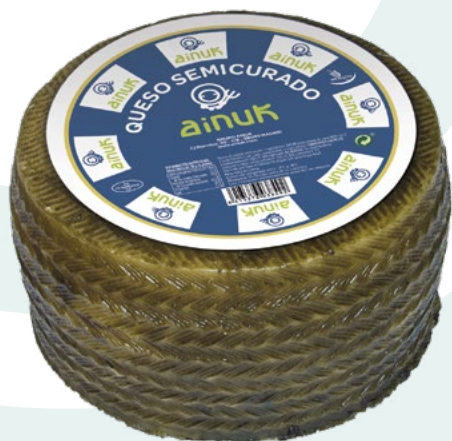
QUESO MEZCLA SEMICURADO AINUK – 2X3,3KG.