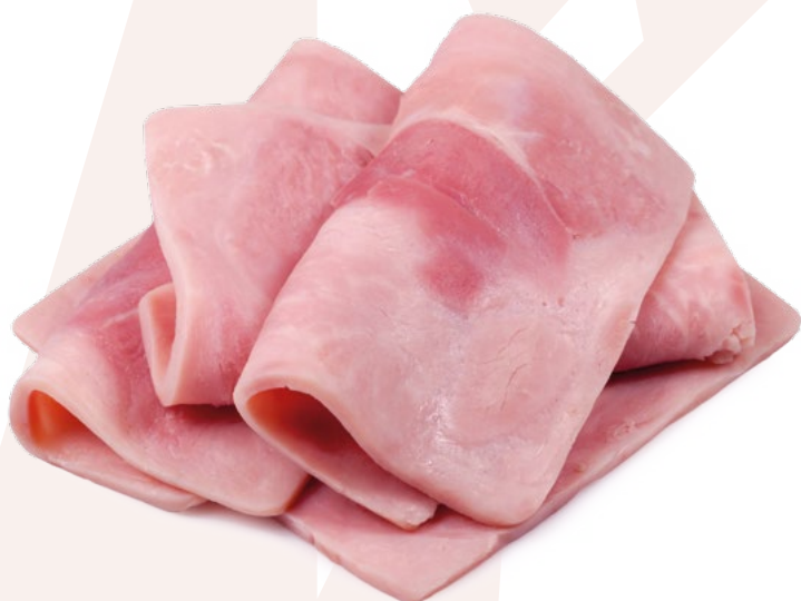
PALETA DE YORK IIXII AINUK – 2X3,5KG.