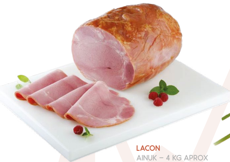
LACON AINUK – 4 KG APROX