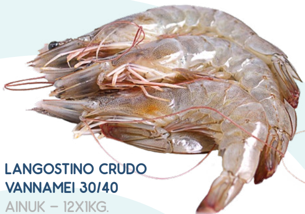
LANGOSTINO CRUDO VANNAMEI 30/40 AINUK – 12X1KG.