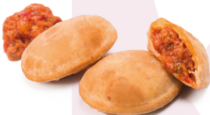
EMPANADILLA CRIOLLA CLAVO - 4X1KG.