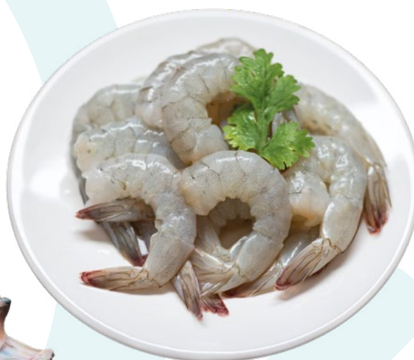
LANGOSTINO PELADO CRUDO 36/40 PESCATRADE – 10X1KG..