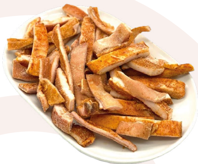
TORREZNOS PARA FREIR AINUK - 2X2KG