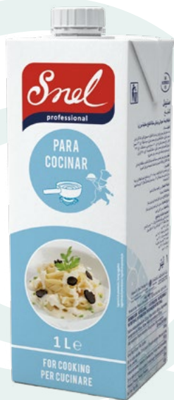
NATA LIQUIDA COCINAR SNEL – 12X1L.