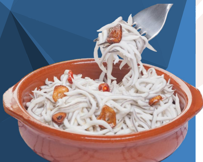
SUCEDANEO DE ANGULAS AINUK – 8X250GR.