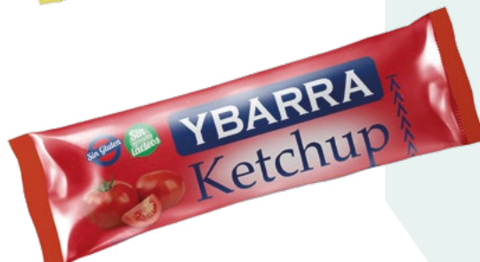
KETCHUP STICK YBARRA – 252X12ML. 10,20 €/Caja