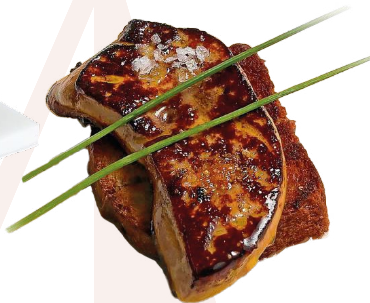
FOIE URGASA – 5KG.