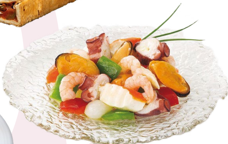
SALPICÓN DE MARISCO AINUK - 2X1KG