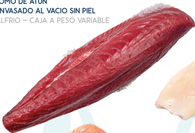
LOMO DE ATÚN ENVASADO AL VACIO SIN PIEL ALFRIO – CAJA A PESO VARIABLE