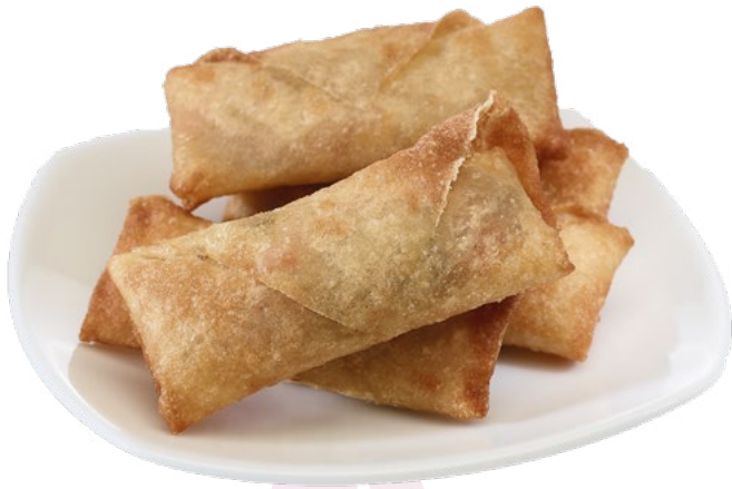
MINI ROLLITO PRIMAVERA IBERCOOK – 4X1KG.