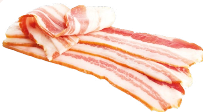
BACON HORECA AINUK – 4 KG APROX