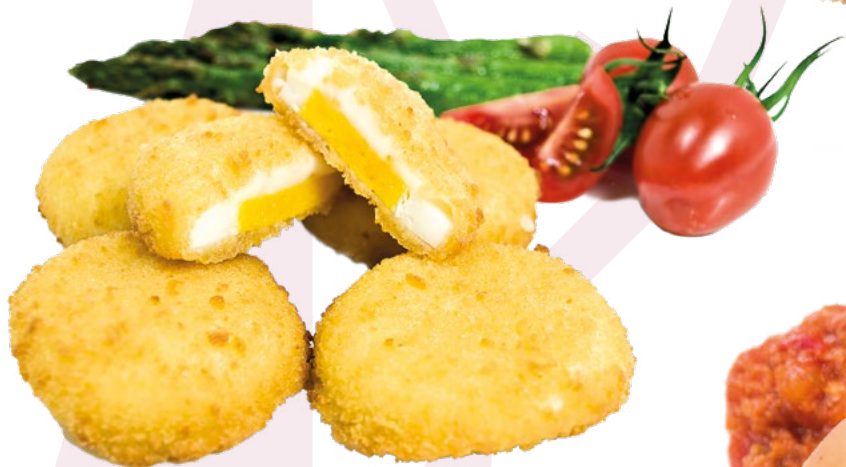
HUEVO CON BECHAMEL AINUK - 8X500GR