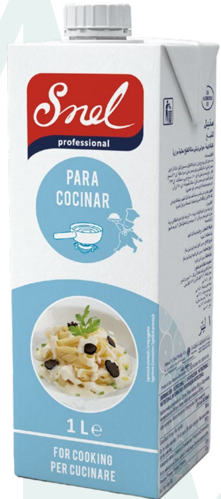
NATA LIQUIDA COCINAR SNEL - 12X1L.