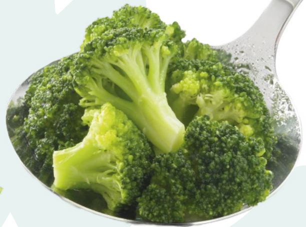
BRÉCOL MINUTE BONDUELLE – 4X2,5KG.