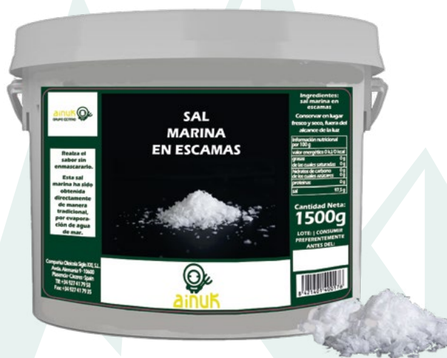
SAL MARINA ESCAMAS AINUK - 1,5KG