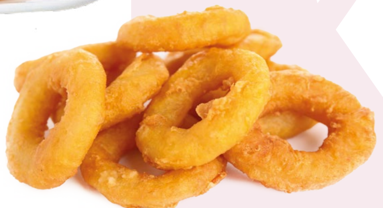
ANILLA REBOZADA IBERCOOK – 4X1.