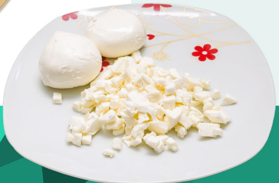
DADO DE MOZZARELLA QUESOS SANABRIA - 6X1KG.