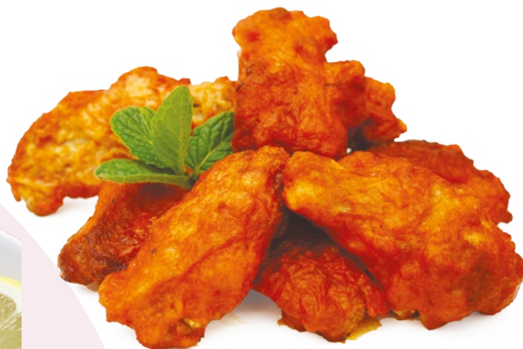
ALITA BBQ AINUK - 8X500GR.