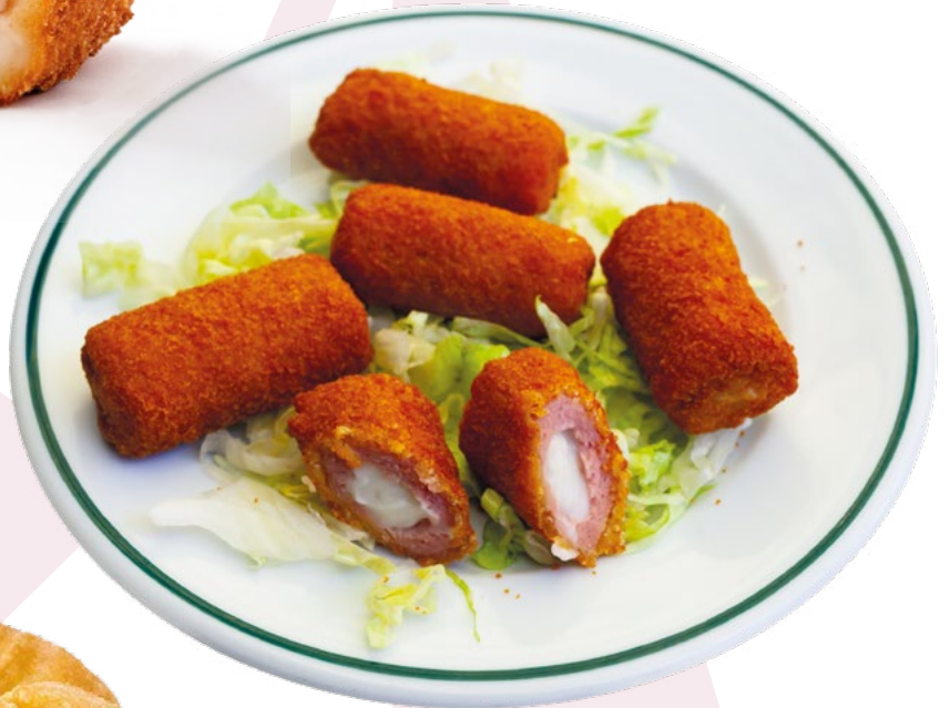
MINI FLAMENQUIN AINUK – 8X500GR.