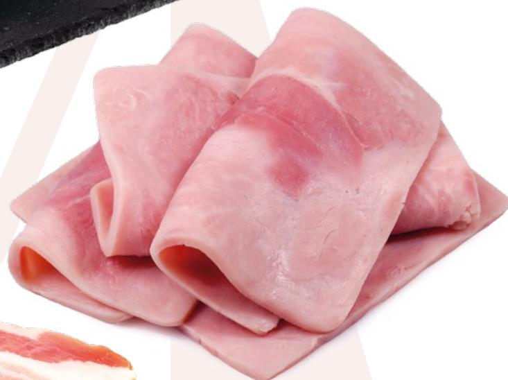
PALETA YORK EMBUTIDOS VELILLA 3KG. APROX.