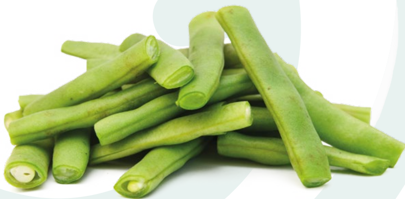
JUDIA VERDE PLANA BONDUELLE – 4X2,5KG.