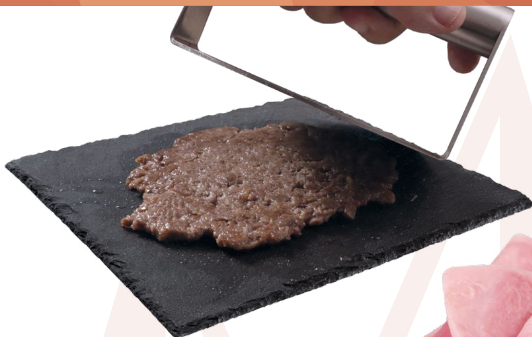
HAMBURGUESA ANGUS SMASH 50GR. SIMONS – 2X1KG