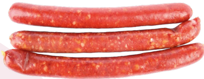
CHISTORRA AINUK - 2KG.