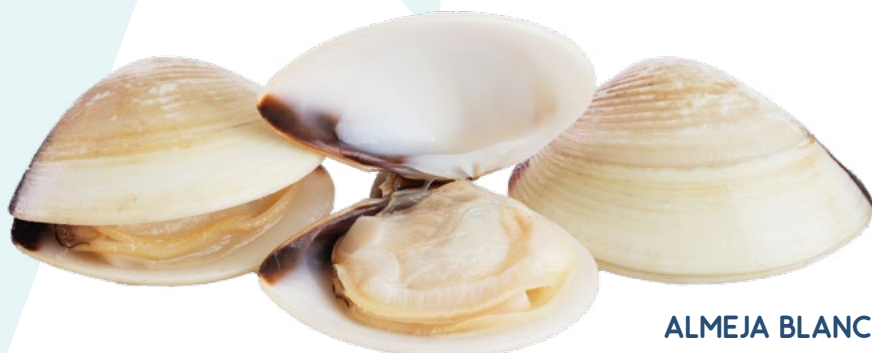
ALMEJA BLANCA 40/60 EXKIMO - 6X1KG.