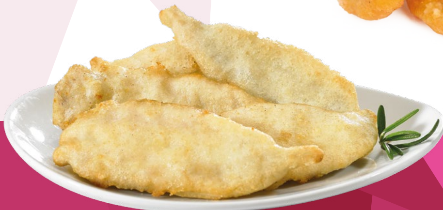
BOQUERON EN TEMPURA IBERCOOK – 10X500GR.