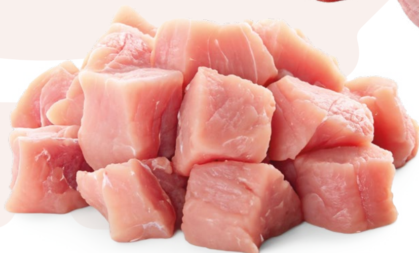
TACO MAGRO DE CERDO CARNES OLIVA - 5KG