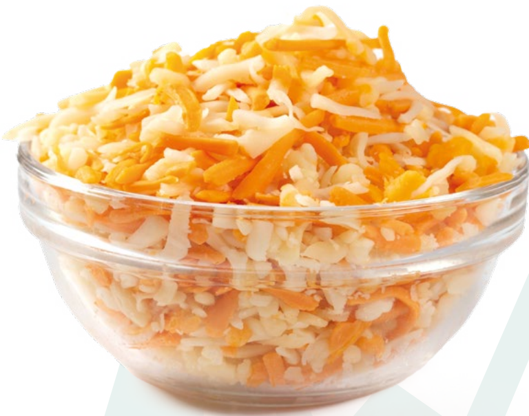
QUESO PARA GRATINAR QUESOS SANABRIA - 6X1KG.