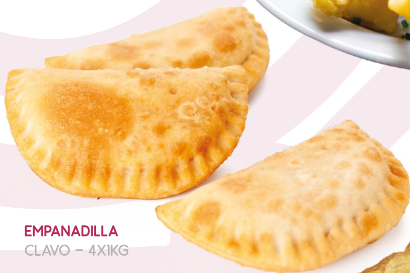
EMPANADILLA CLAVO - 4X1KG