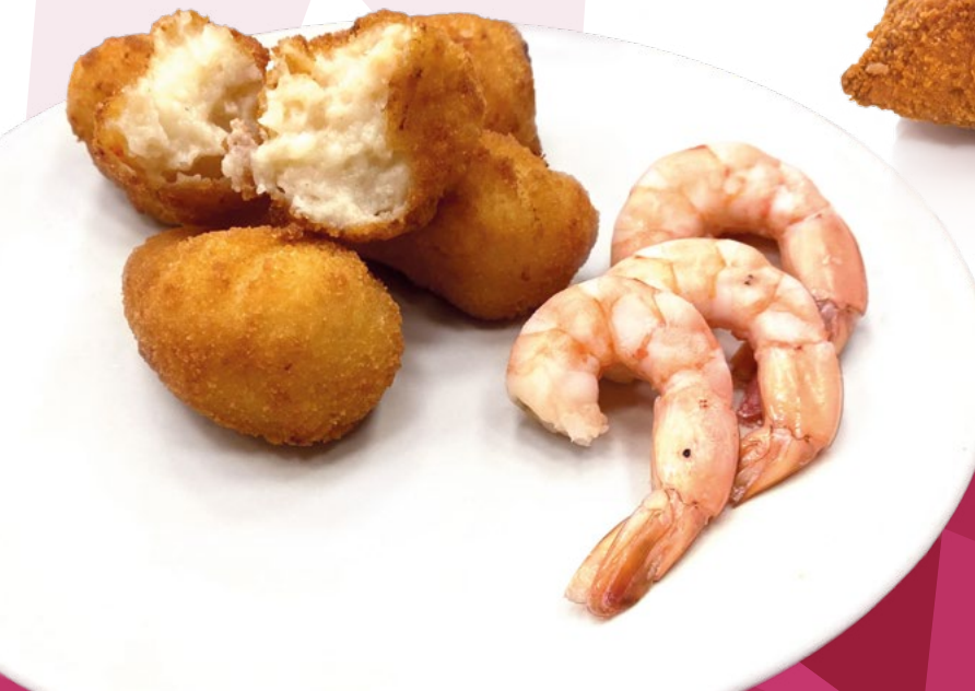
CROQUETA LANGOSTINO AL AJILLO CLAVO - 6X500