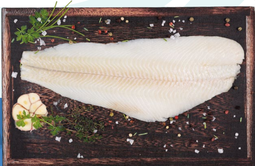
FILETE DE HALIBUT 200/400 NEW CONCISA – 6KG/CAJA