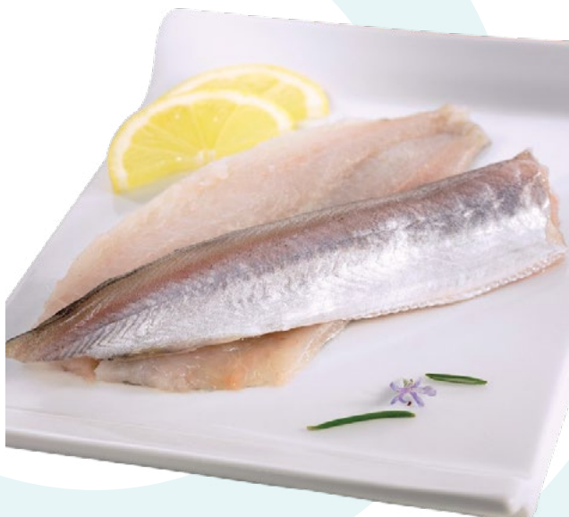
FILETE BACALADILLA IBERCOOK – 1X4,5KG.