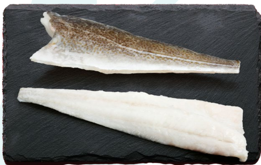
FILETE DE BACALAO +1000 MB - 11KG.