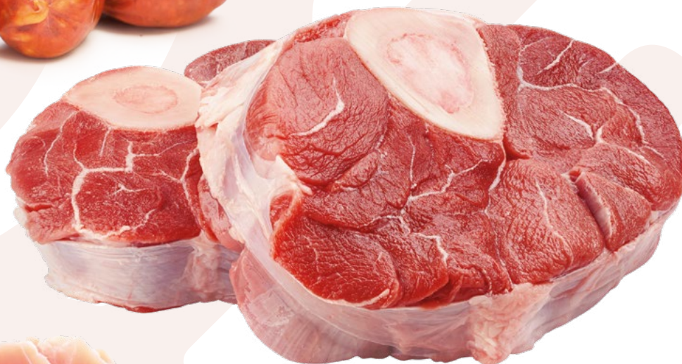
OSOBUCO MIMAR - 6KG