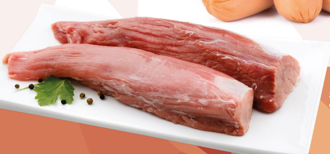
SOLOMILLO DE CERDO CARNES OLIVA – 6KG