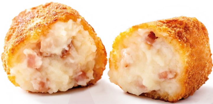
CROQUETA SUPREMA JAMON AINUK – 8X500GR.