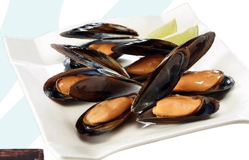
MEJILLON JUGOSON G GELVIGO ALFRIO – 5 KG.