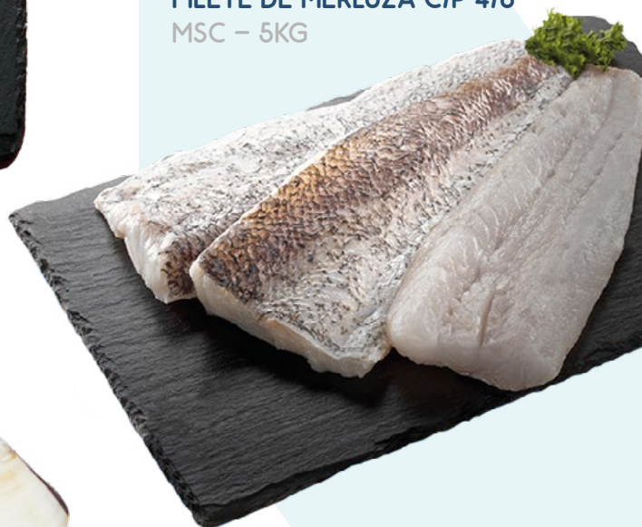
FILETE DE MERLUZA C/P 4/6 MSC - 5KG