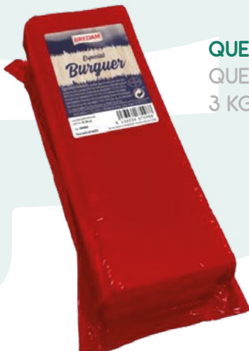
QUESO BARRA SANDWICH QUESOS SANABRIA 3 KG. APROX.