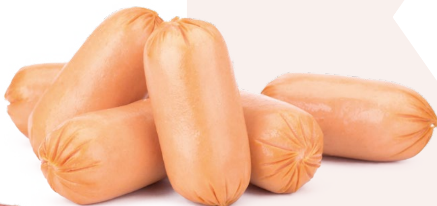
SALCHICHAS COCKTEL ANTONIO Y RICARDO – 2X2KG.