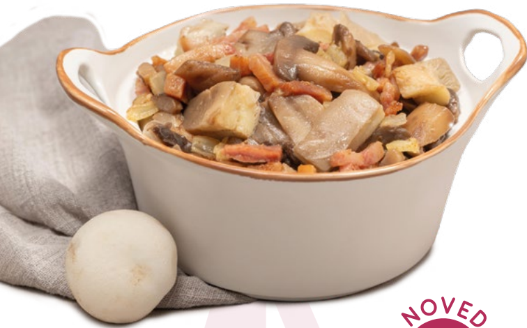
SALSEADO DE SETAS CON BACON PCS - 3X1KG