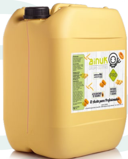
ACEITE "FRITOS PRO" AINUK - 10 LITROS