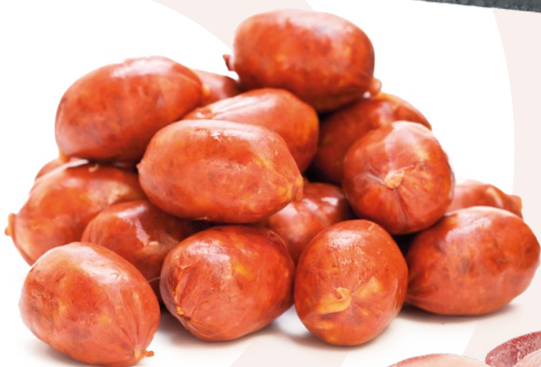
CHORIZO MINI O CRIOLLO MINI AINUK - 2KG.