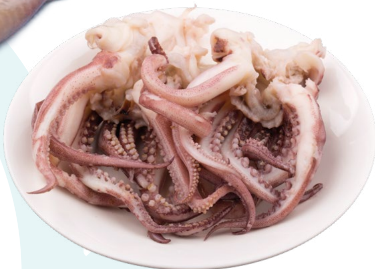
REJOS I.Q.F. ARGENTINO ALFRIO – 5 KG.