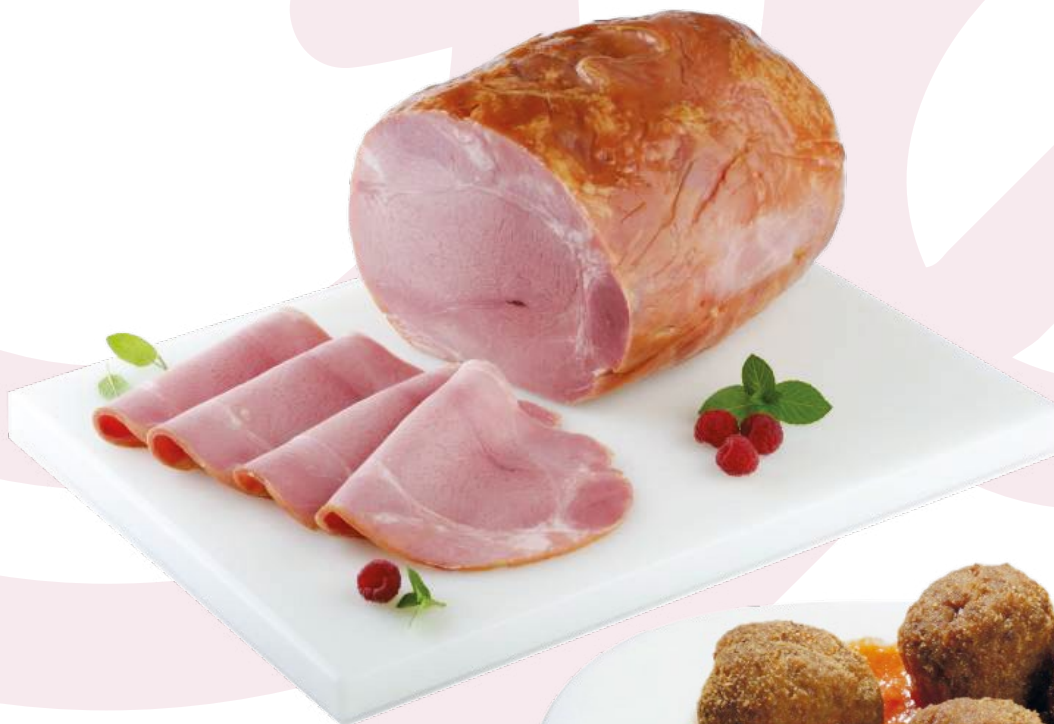
LACON ASADO EMBUTIDOS VELILLA 3KG. APROX.