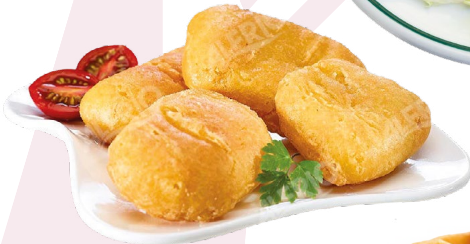
BACALAO REBOZADO ALFRIO – 4X1 KG.