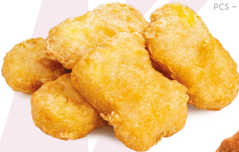
NUGGET POLLO AINUK - 8X500GR.