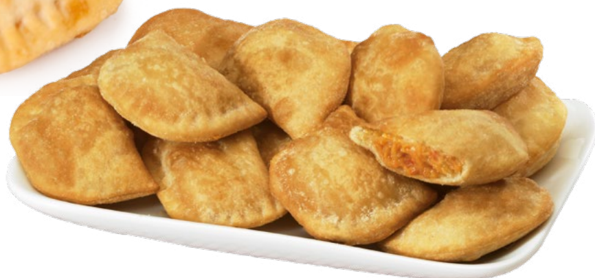
MINI EMPANADILLA ATÚN. AINUK - 4X1