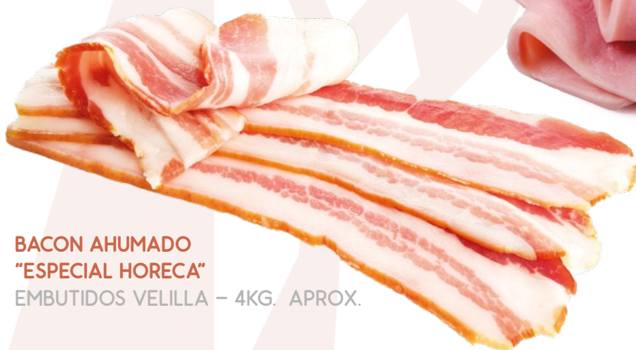
BACON AHUMADO "ESPECIAL HORECA" EMBUTIDOS VELILLA – 4KG. APROX.