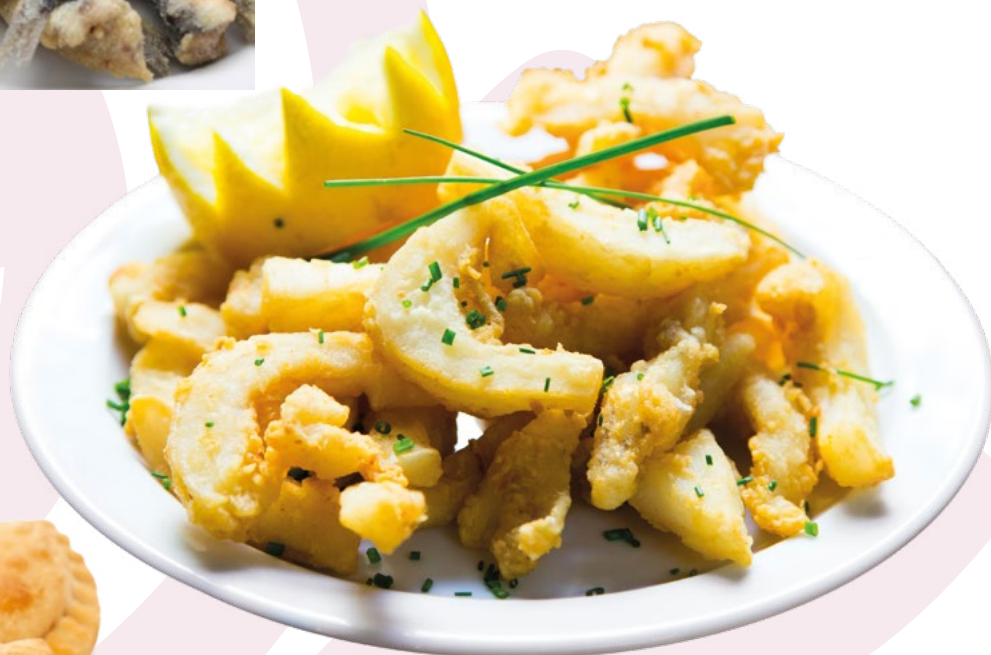
RABA REBOZADA CLAVO - 5X1KG