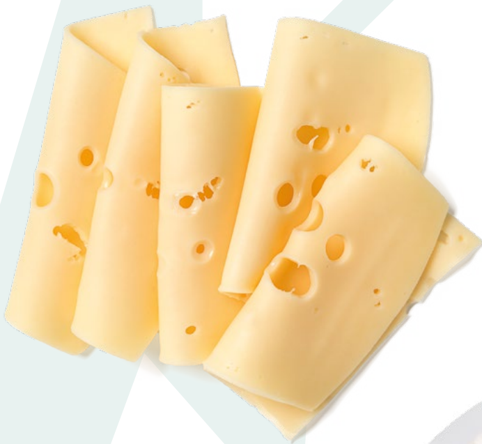
QUESO TIPO EDAM LONCHEADO. QUESOS SANABRIA - 6X1KG.