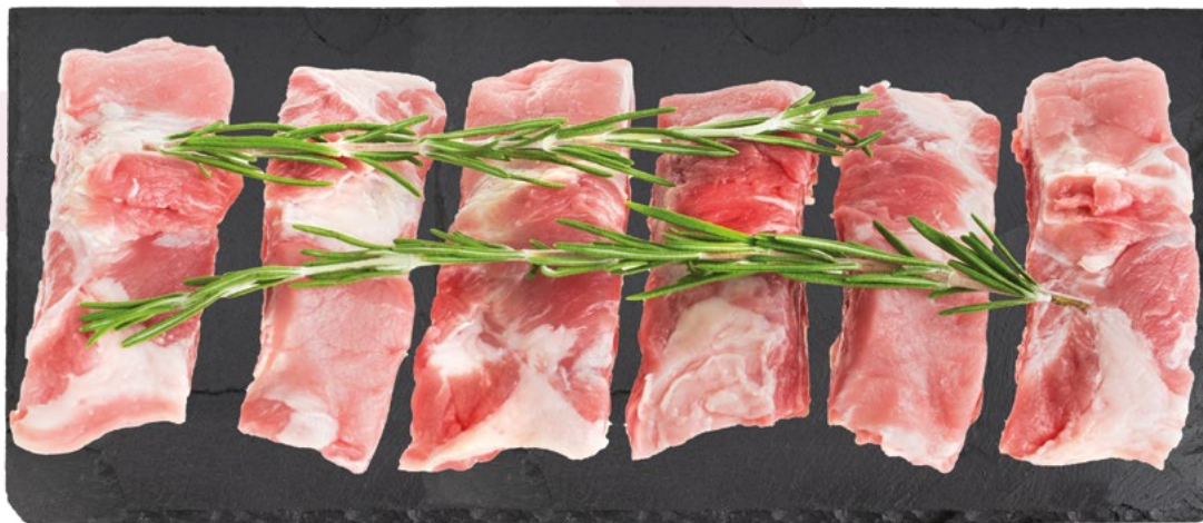
COSTILLA TROCEADA IQF AINUK - 4KG.