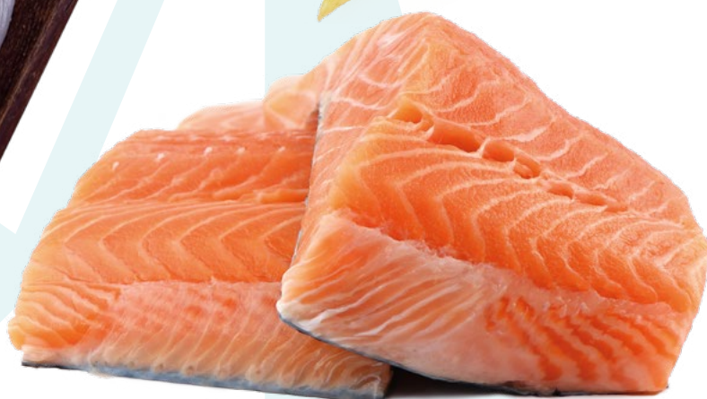
SALMÓN EN PORCIONES 100/150 NEW CONCISA - 6X1