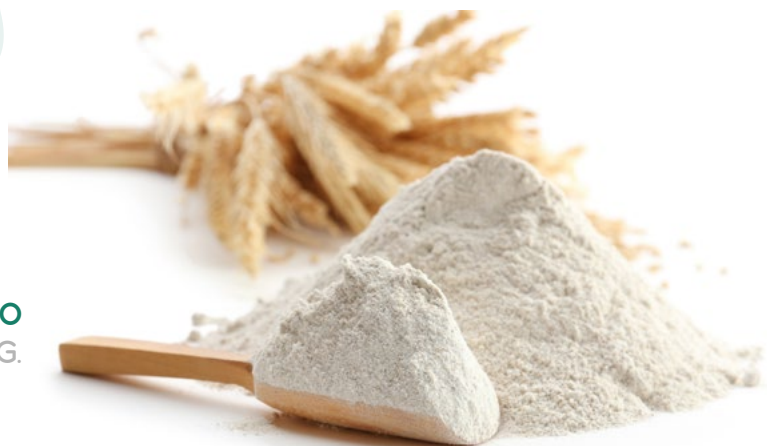
SEMOLINA DE TRIGO AINUK – 5KG.