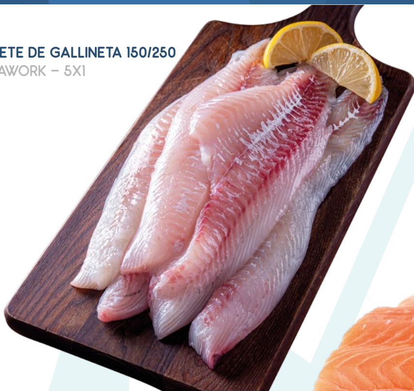
FILETE DE GALLINETA 150/250 SEAWORK - 5X1