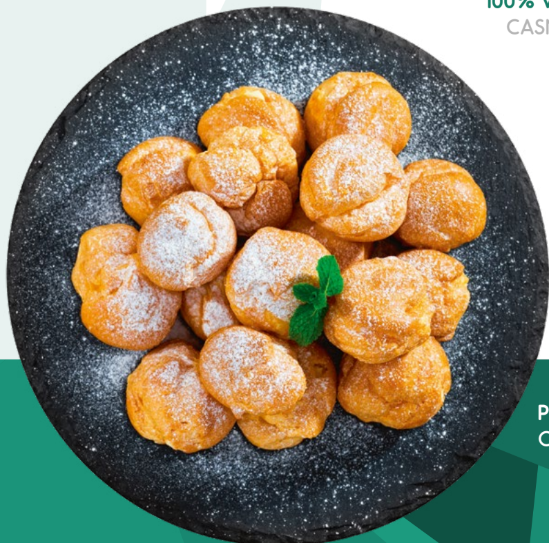
PROFITEROLES CLAVO - 8X500GR