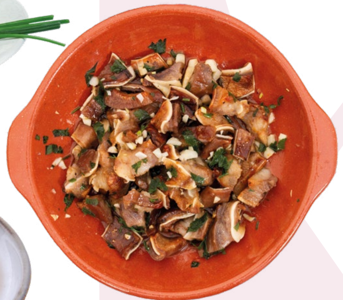
OREJA COCIDA AL AJILLO VIGOGER - 10X500GR.