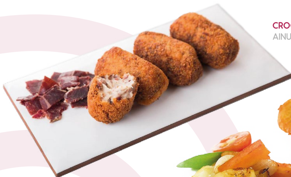
CROQUETA CECINA AINUK - 8X500GR