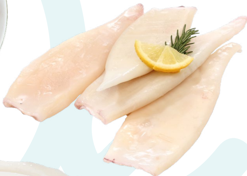
TUBO POTA ILLEX 24/+ SEAWORK – 1X5KG.