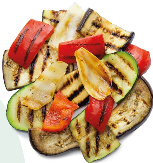
MEZCLA DE VERDURAS ASADAS BONDUELLE - 4X2,5KG.