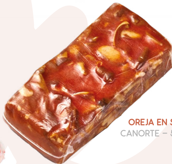
OREJA EN SALSA CANORTE - 5XIKG.