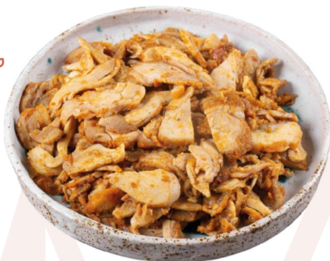
LONCHEADO KEBAB POLLO BOLSAS 1 KG BONCHEF – 8KG