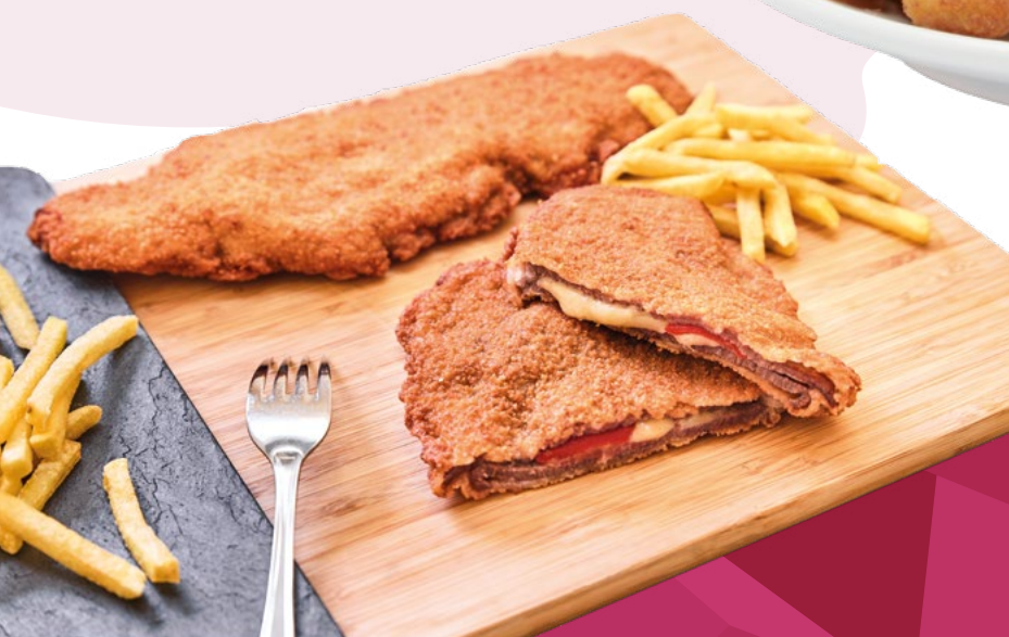
CACHOPO DE TERNERA AINUK - 3KG