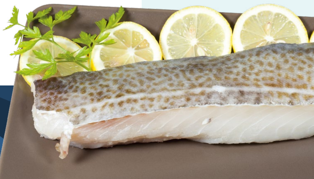
LOMO BACALAO RESUPER 700/+G ICELANDIC - 1X7KG