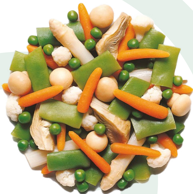
MENESTRA ESPECIAL BONDUELLE - 4X2,5KG.