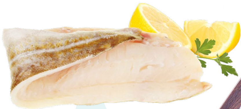
BACALAO FILETE MB +1000 MB - 11KG.