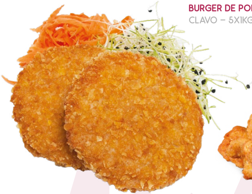
BURGER DE POLLO CORN FLAKE CLAVO - 5X1KG