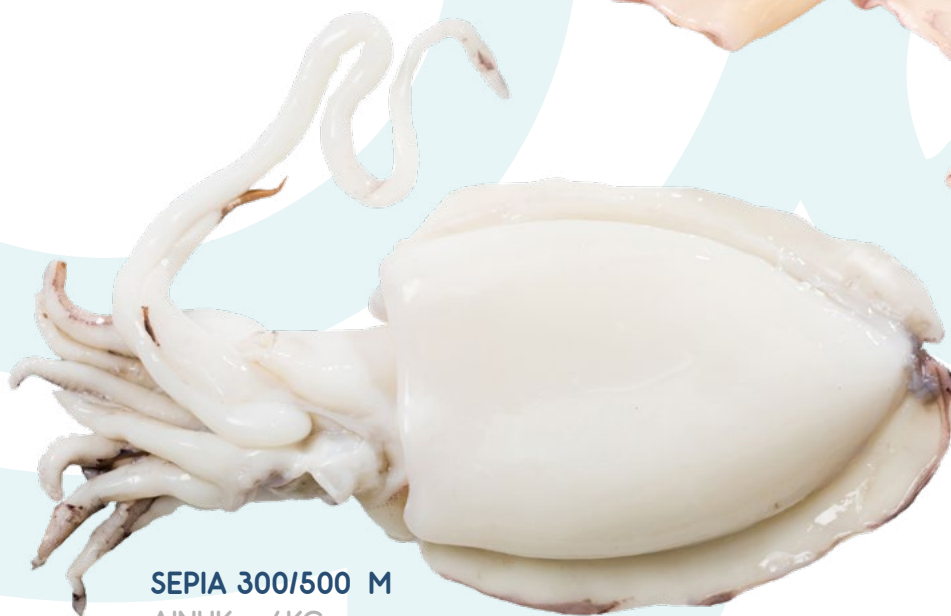
SEPIA 300/500 M AINUK – 6KG