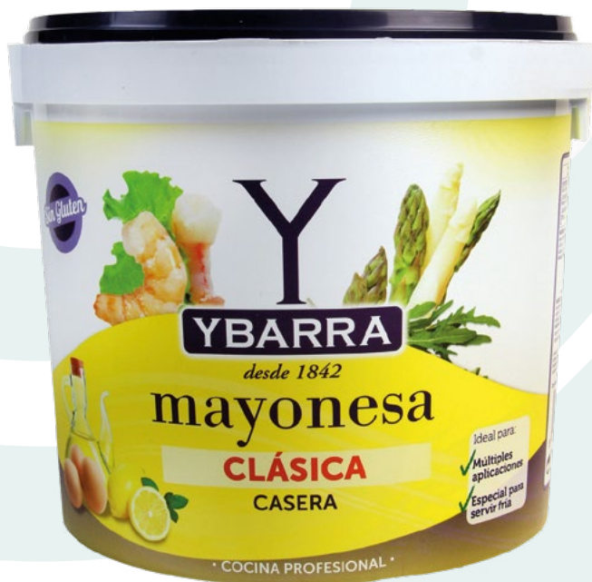
MAYONESA YBARRA – 5KG