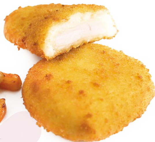
PECHUGA VILLARROY AINUK - 4X1KG