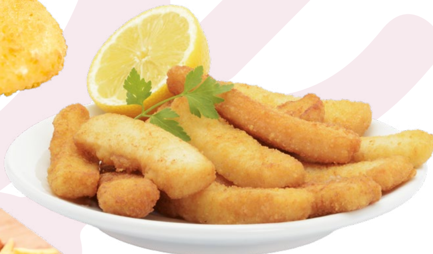
RABA REBOZADA CLAVO - 5X1KG