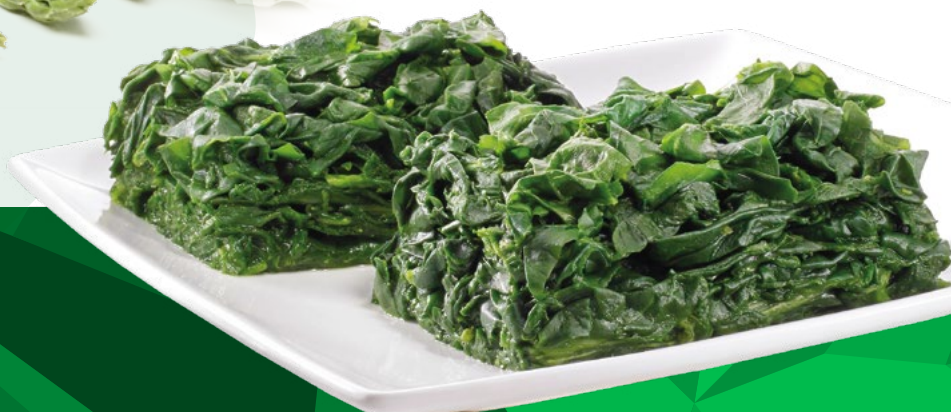
ESPINACAS MIL HOJAS BONDUELLE - 4X2,5KG.