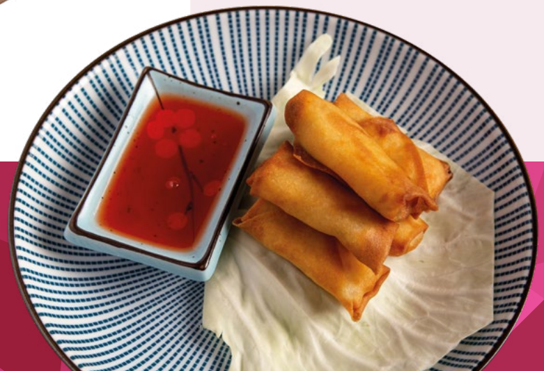
MINI ROLLITO PRIMAVERA IBERCOOK - 4X1KG.