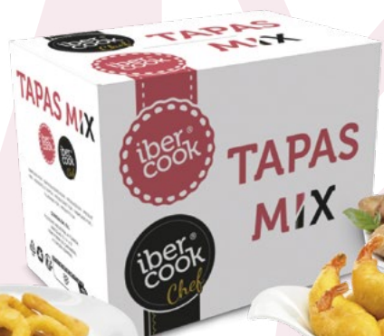
TAPAS MIX IBERCOOK – 4X1KG.