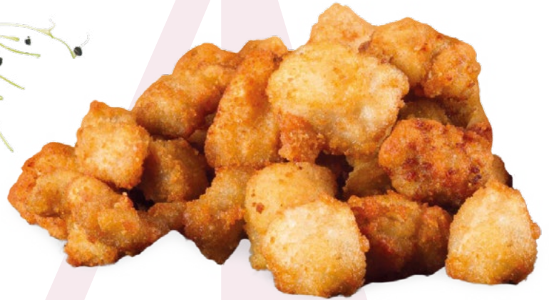
TAQUITOS DE CERDO EMPANADOS AVIMAHER - 3KG