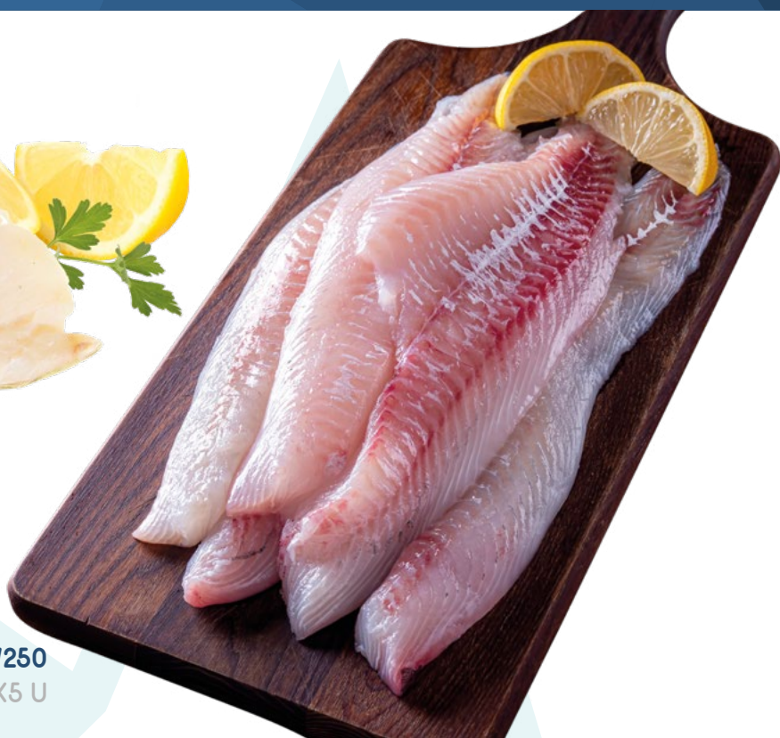
GALLINETA FILETE IQF 150/250 SEAWORK - 1X5 U