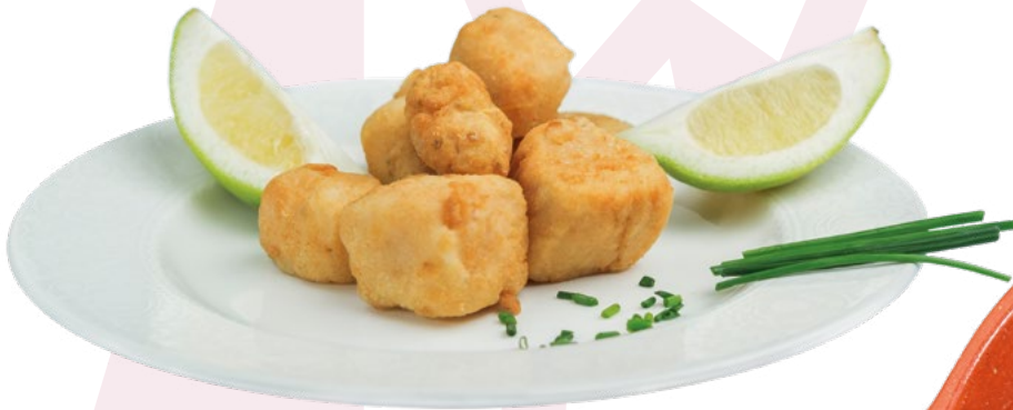
DADOS DE CAZÓN ENHARINADO MEGAMAR - 10X500GR.