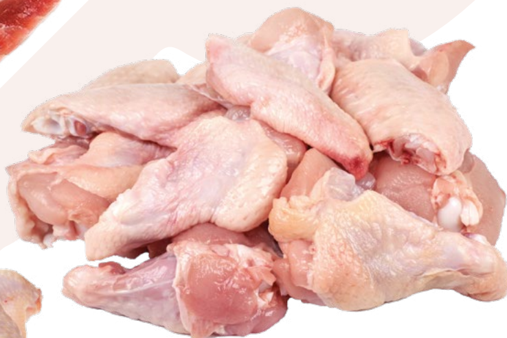
ALAS TROZOS AVIMAHER - 4KG ALAS PARTIDAS BOLSA BONCHEF - 5XIKG.