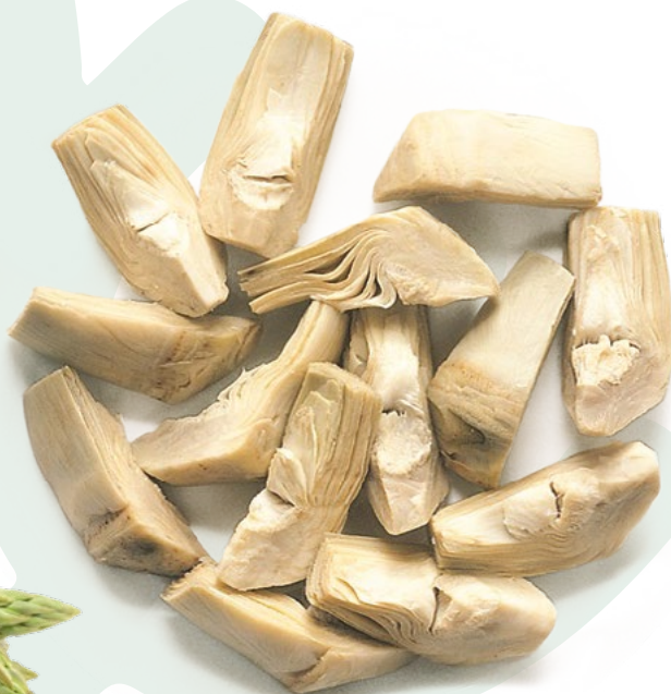
ALCACHOFA CORTADA BONDUELLE - 4X2,5KG.