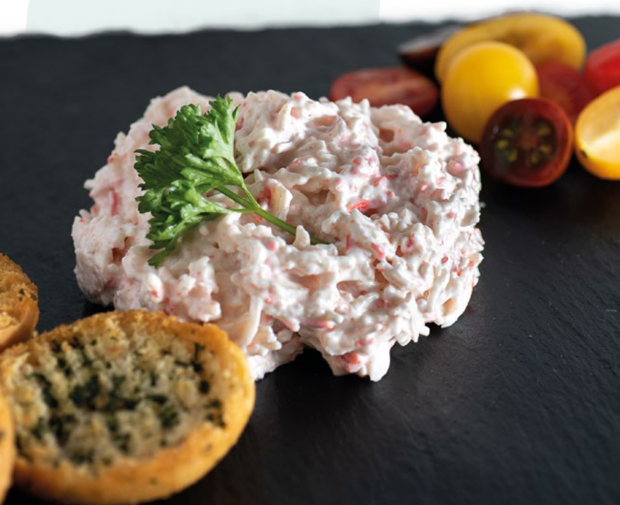
PINCHO DEL NORTE ENSALANDIA – 4X1 KG