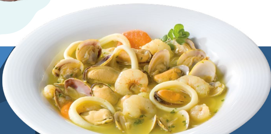
PREPARADO DE SOPA DE MARISCO AINUK – 4X1KG.