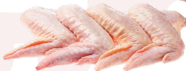
ALAS ENTERAS BONCHEF - 4KG 3,69 €/Kg.