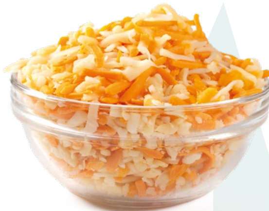
RALLADO GRATINAR MIX HEBRA BREDAM – 6X1KG.