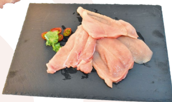
FILETE DE PECHUGA DE POLLO EN BANDEJA AINUK – 4KG.