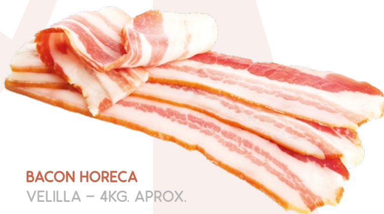
BACON HORECA VELILLA - 4KG. APROX.