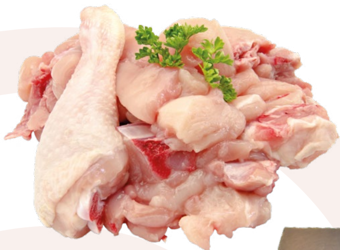
POLLO ENTERO TROCEADO – PREPARADO DE PAELLA BONCHEF – 1X5KG.