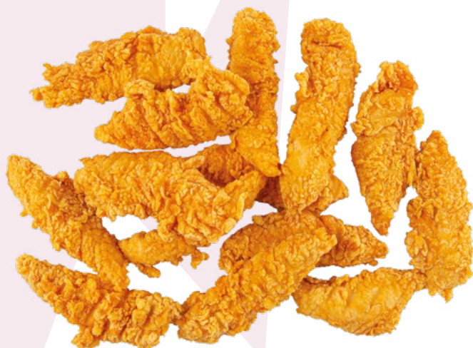
FINGER POLLO CLAVO - 4X1KG