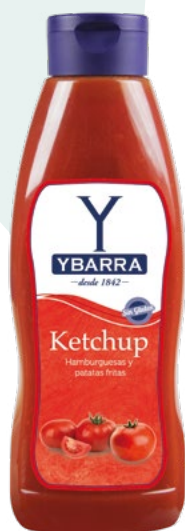
SALSA KETCHUP YBARRA – 1/L