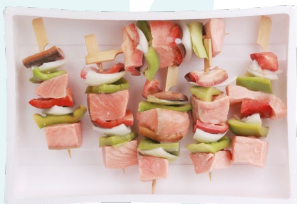
MINI BROCHETA SALMON+VERDURA (540G) POREX - 6X12UD