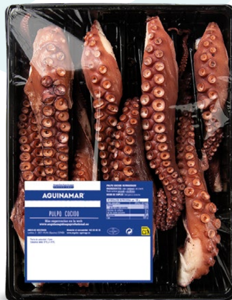
PULPO BANDEJA 1,5 KG 8 UNDADES 180GR. ANGULAS AGUINAGA - 2 BANDEJAS /CAJA