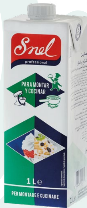
NATA LIQUIDA MONTAR Y COCINAR. SNEL – 12X1L.