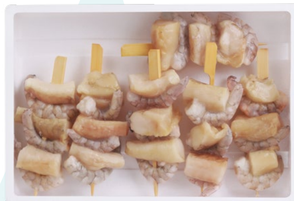
BROCHETA RAPE+LANGOSTINO (540G) POREX - 6X6UD