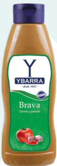
SALSA BRAVA YBARRA – 1/L