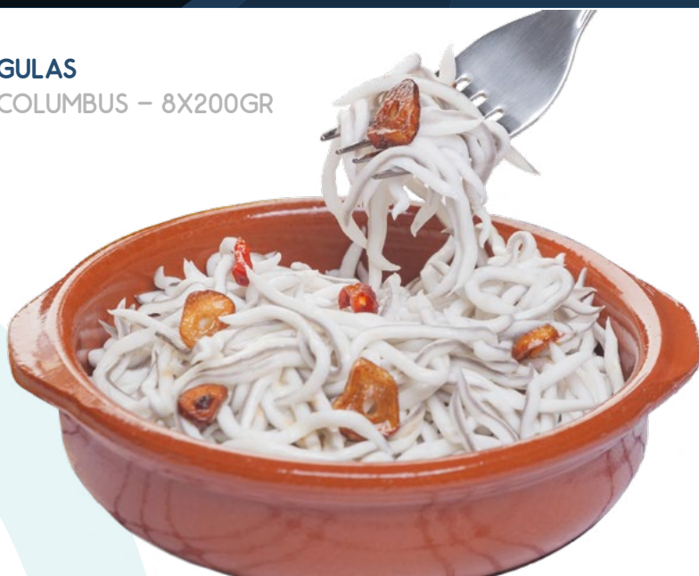
PULPO COCIDO PATAS 300/UP 5 BANDEJAS 6 PATAS PESCAPISA - "EL PULPICO" 10KG. APROX.