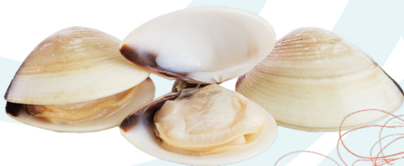
ALMEJA BLANCA XKIMO – 6X1