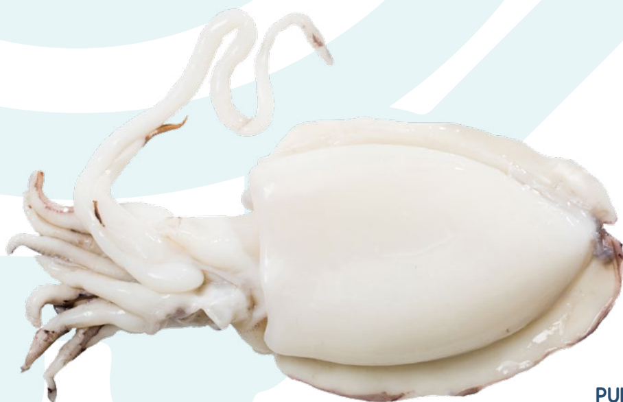
SEPIA 300/500 AINUK - 6KG