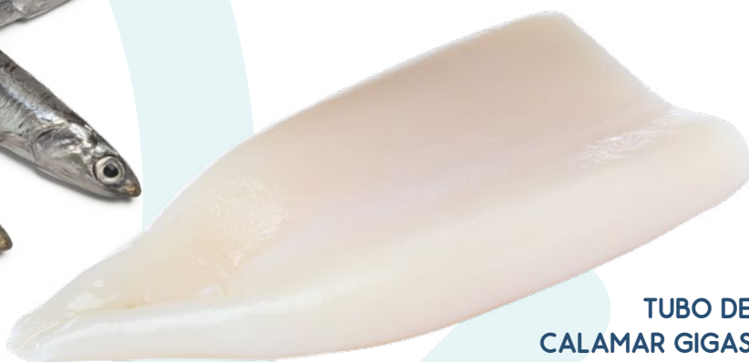
TUBO DE CALAMAR GIGAS MB – 1X5