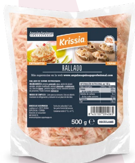
RALLADO KRISSIA ANGULAS AGUINAGA - 10X500GR.