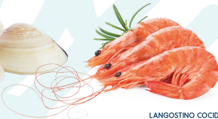
LANGOSTINO COCIDO 25/35 PESCATRADE – 2KG.