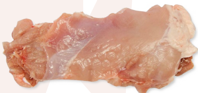
FILETE DE CONTRAMUSLO BONCHEF - 1X5KG.