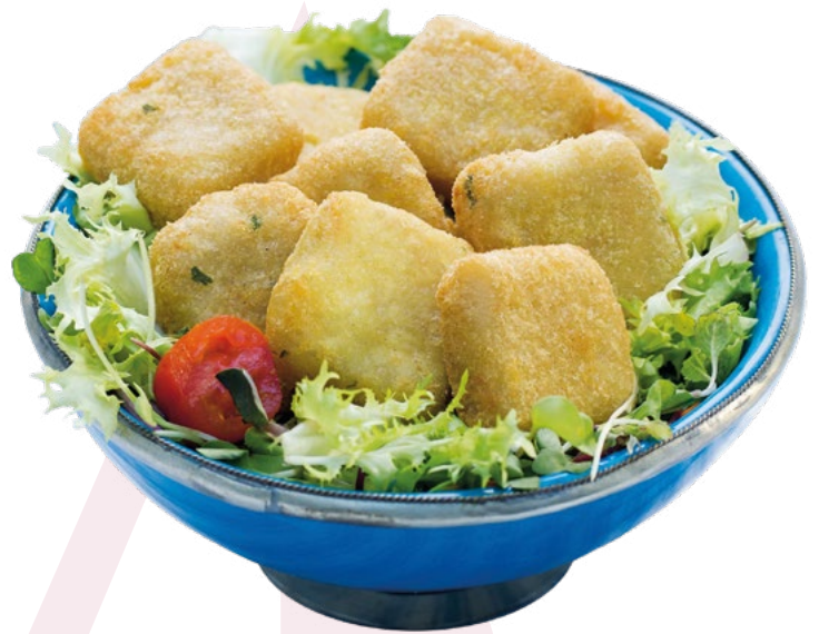
BACALAO REBOZADO CABEZUELO - 6X1KG.