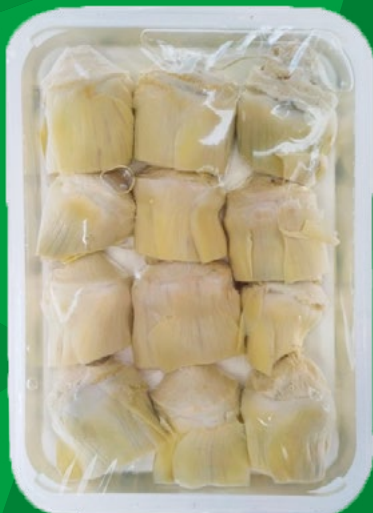
ALCACHOFA CONFITADA VEGASANA – 4X12 UNIDADES