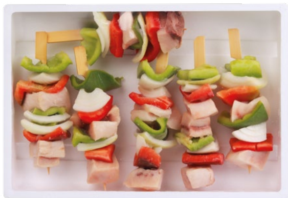
BROCHETA PEZ ESPADA+VERDURA (540G) POREX - 6X6UD