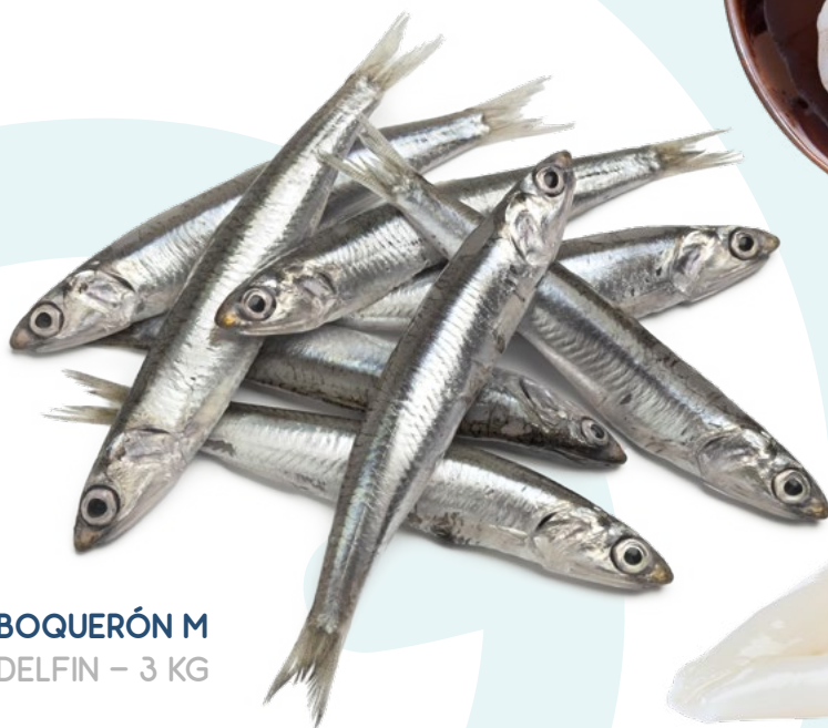
BOQUERÓN M DELFIN – 3 KG