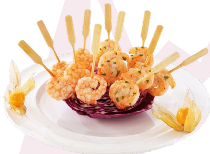
PIRULETA DE LANGOSTINO MARINADA PCS - 2KG.