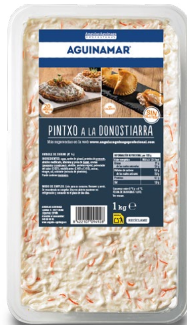
PINTXO DONOSTIARRA ANGULAS AGUINAGA – 6X1KG.