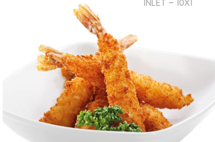
TORPEDO DE LANGOSTINO REBOZADO INLET – 10X1