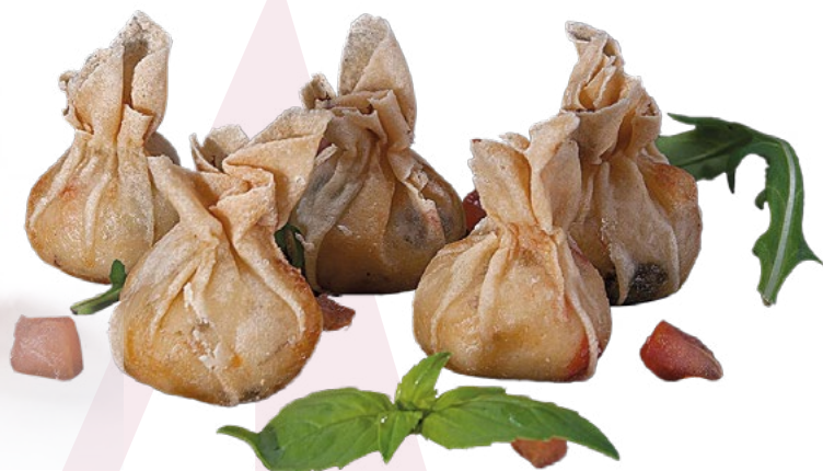
SAQUITO DE MARISCO DELEITA - 1,5 KG