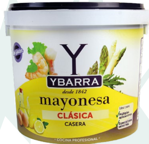
MAYONESA YBARRA YBARRA – 5KG