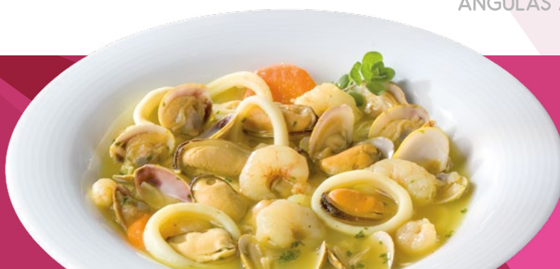
PREPARADO SOPA DE MARISCO AINUK - 4X1KG