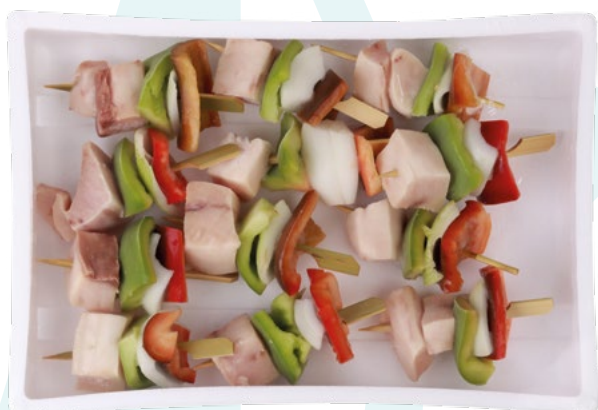
MINI BROCHETA PEZ ESPADA+VERDURA (540G) POREX - 6X12UD