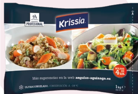
BARRITAS KRISSIA ANGULAS AGUINAGA - 5X1KG. 7,49 €/Kg.