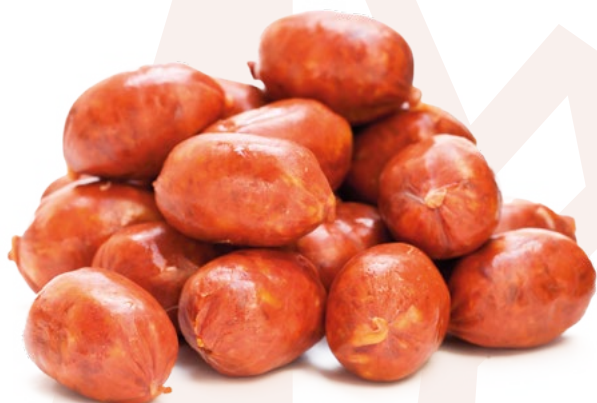
CHORIZO MINI CRIOLLO AINUK - 2KG. CHORIZO MINI AINUK - 2KG.