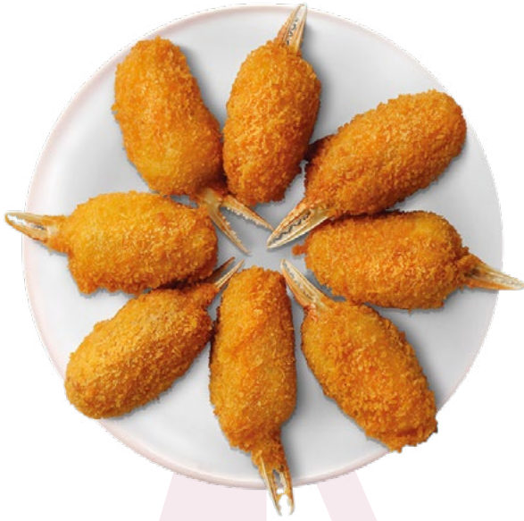
MUSLITOS DE CANGREJO VICI - 10X1KG