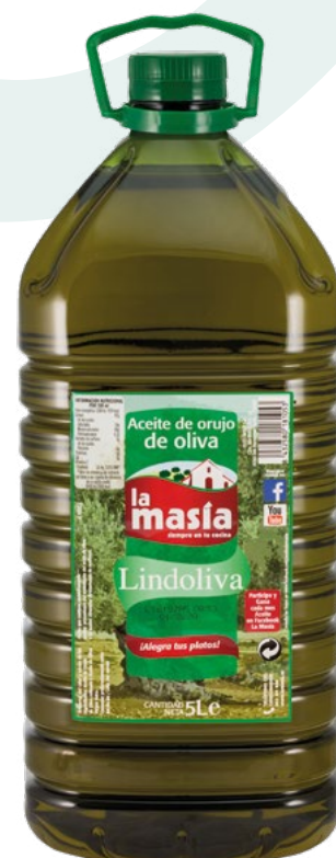
ACEITE ORUJO LA MSIA – 5L