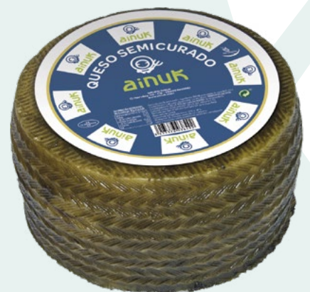
QUESO MEZCLA SEMICURADO AINUK – 2X3,3KG.