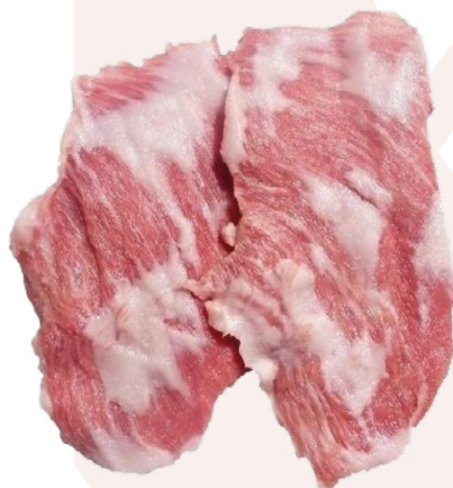
SECRETO DE CERDO BONCHEF - 1X5KG. 6,49 €/Kg.