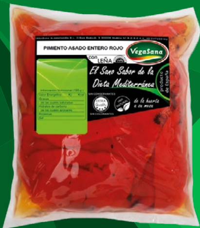
PIMIENTOS ASADOS VEGASANA – 8X1KG