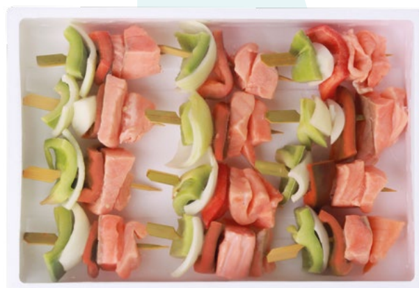
BROCHETA SALMON+VERDURA (540G) POREX - 6X6UD