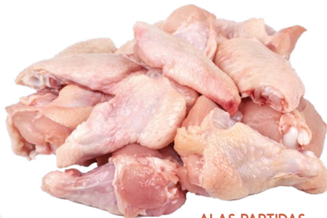
ALAS PARTIDAS BONCHEF – 5X1KG.