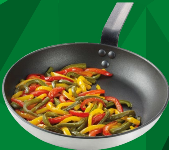
JULIANA DE PIMIENTOS PREFRITOS BONDUELLE – 6X1KG.