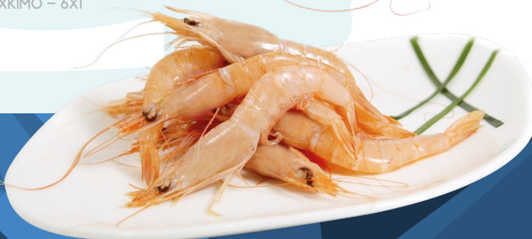
GAMBA TÚNEZ A BORDO G-2 100/110 UD/KG MEDIPESCA – 12X1KG.