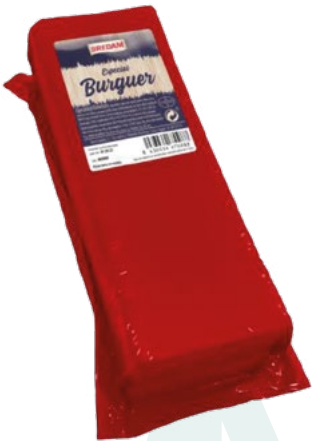
BARRA SANDWICH PREMIUM BREDAM – 3 KG. APROX.