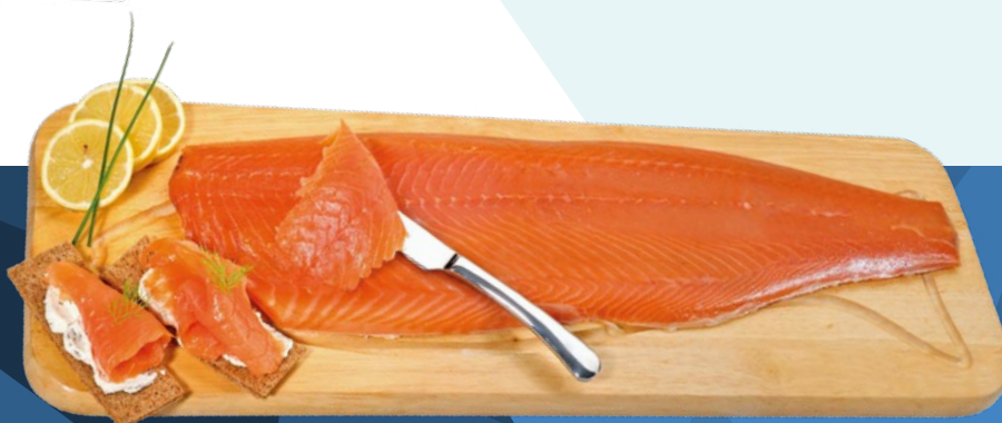
SALMON AHUMADO VICI - 10X1KG