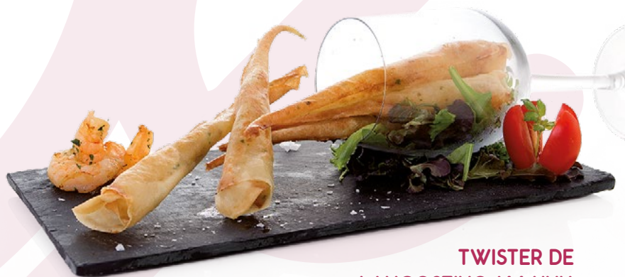
TWISTER DE LANGOSTINO (44 UNI.) PESCATRADE – 5KG.