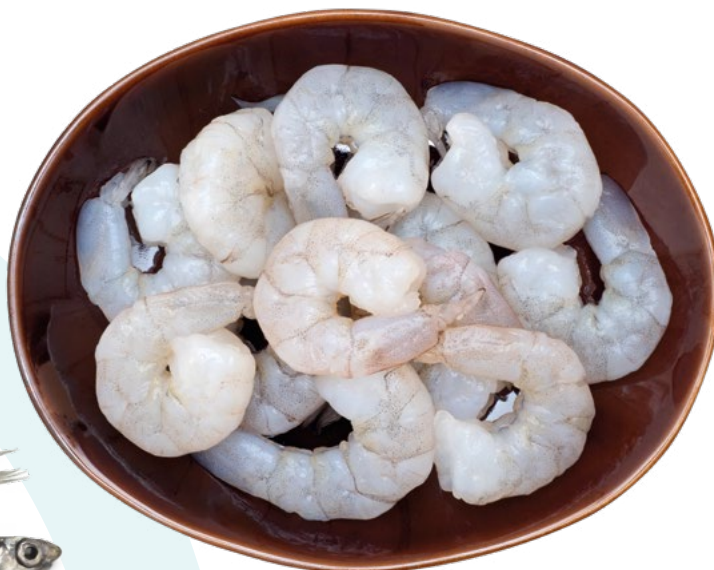
LANGOSTINO CRUDO PELADO VANAMEI ECUADOR 36/40 PESCATRADE – 10X1KG.