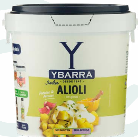
ALI-OLI YBARRA – 1,8KG.