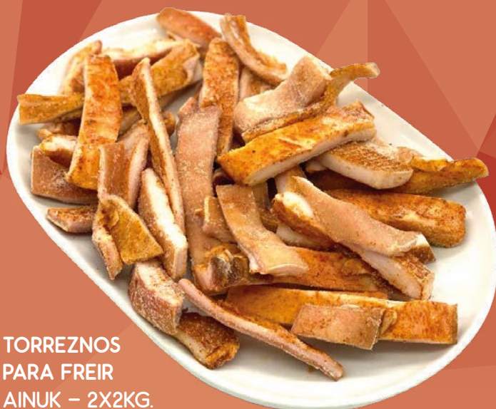
TORREZNOS PARA FREIR AINUK – 2X2KG.