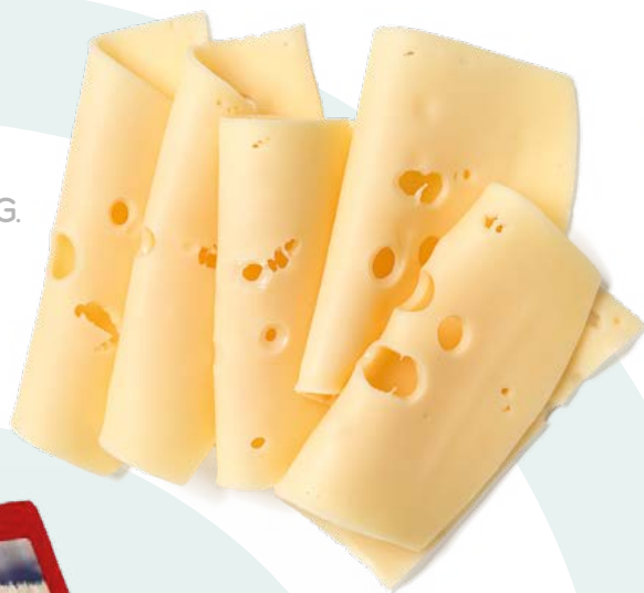
LONCHEADO SANDWICH PREMIUM BREDAM – 6X1KG.