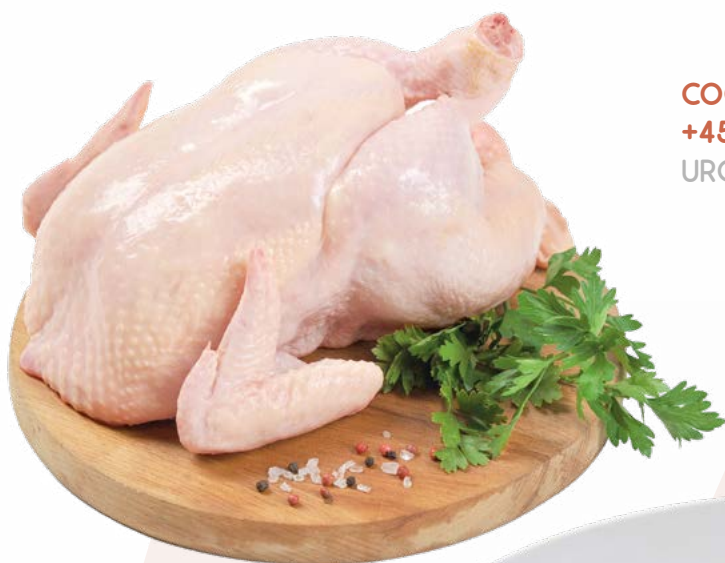
COQUELET CAT B +450 GRS URGASA – 6X2 UDS