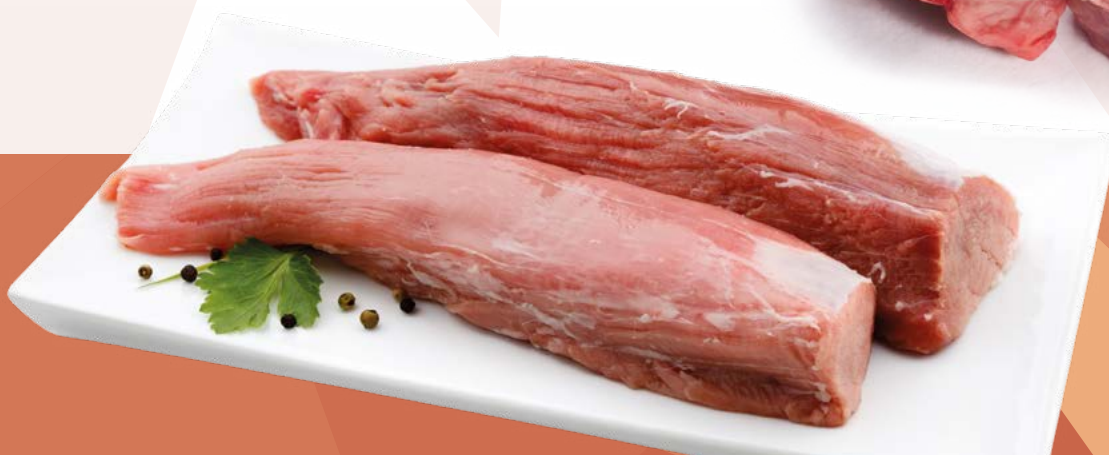
SOLOMILLO DE CERDO S/C OLIVA – 6KG.