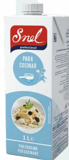
NATA LIQUIDA COCINAR SNEL – 12X1L.