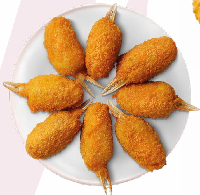
MUSLITO CON PINZA PESCATRADE – 10X1KG.