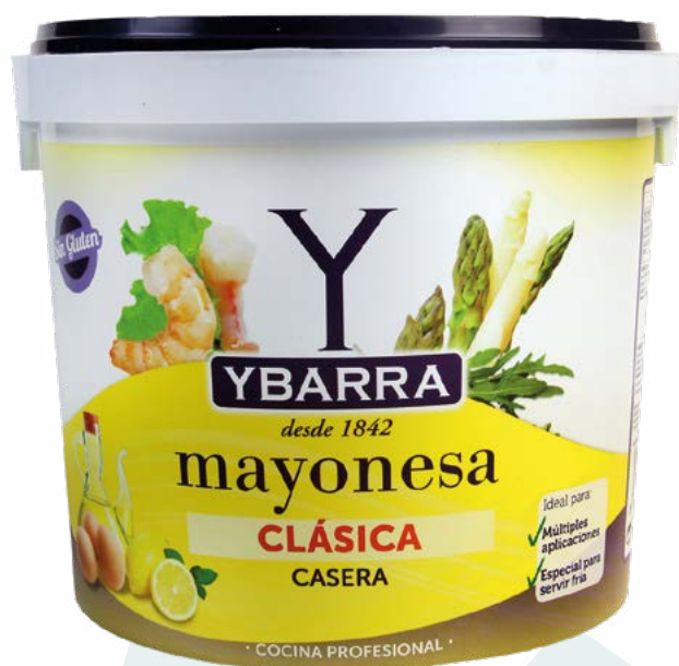
MAYONESA CUBO YBARRA – 2X5KG.