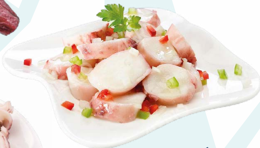
RODAJA DE POTÓN COCIDA GELVIGO - 5X1KG.