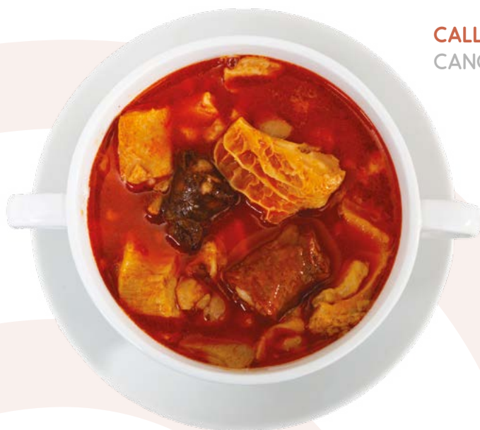
CALLOS MADRILEÑA CANORTE – 5X1 KG APROX