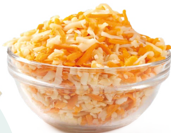
RALLADO GRATINAR MIX HEBRA BREDAM – 6X1KG.