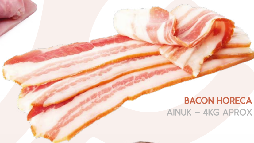
BACON HORECA AINUK – 4KG APROX