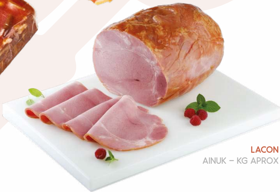
LACON AINUK – KG APROX