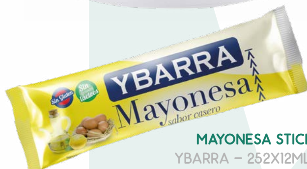
MAYONESA STICK YBARRA – 252X12ML.