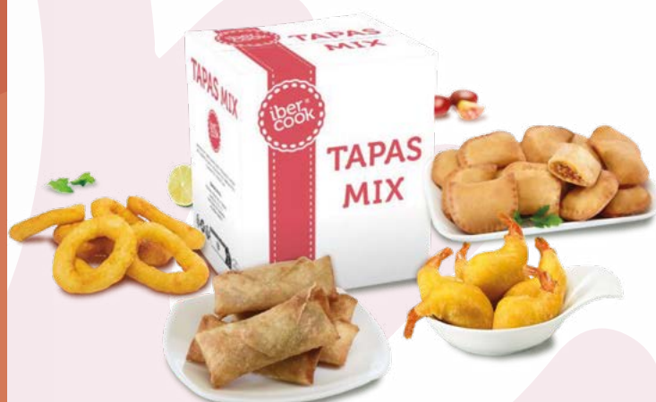
TAPAS MIX IBERCOOK – 4X1KG.