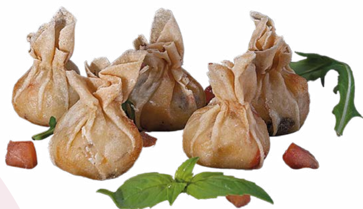
SAQUITO DE MARISCO DELEITA – 1,5 KG