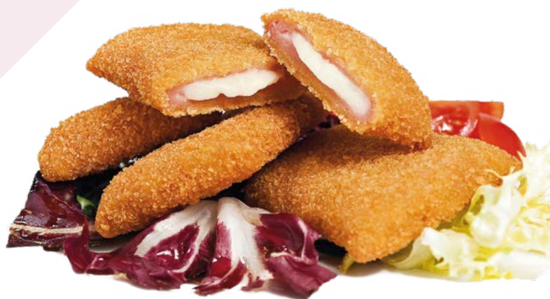
MINI SAN JACOBO AINUK – 8X500 GR.