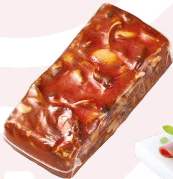
OREJA SALSA CANORTE – 5X1 KG APROX