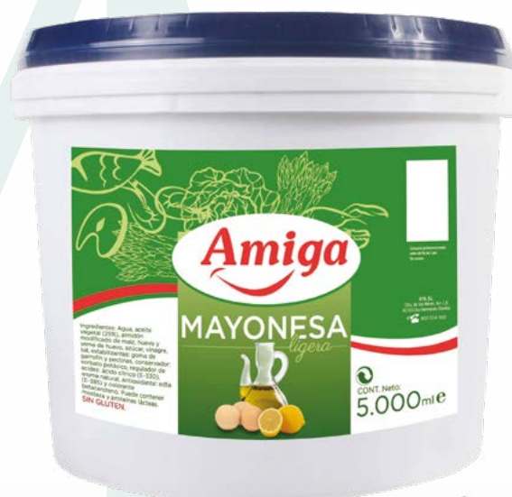
MAYONESA AMIGA YBARRA – 5KG.