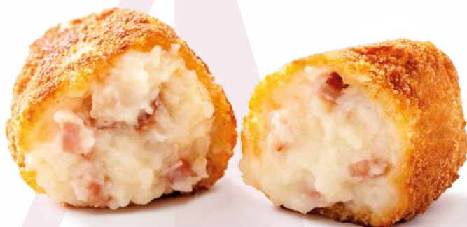
CROQUETA SUPREMA JAMON AINUK – 8X500 GR