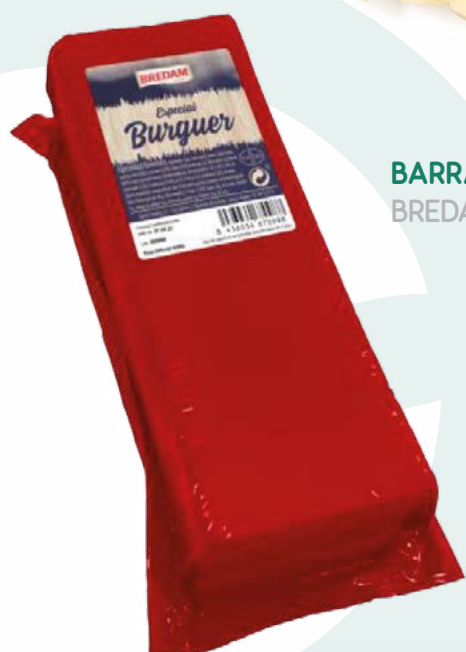
BARRA SANDWICH PREMIUM BREDAM – 3 KG. APROX.