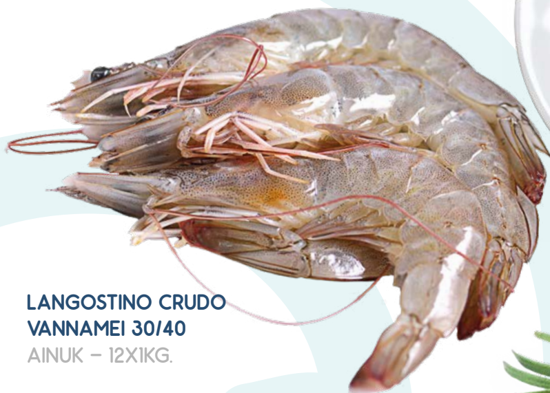
LANGOSTINO CRUDO VANNAMEI 30/40 AINUK – 12X1KG.