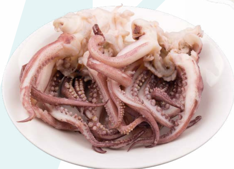
REJO DE POTA IQF ALFRIO - 5KG.

PLANCHA DE SALMON AHUMADO PRECORTADO EL DUENDE - 1,6GR.