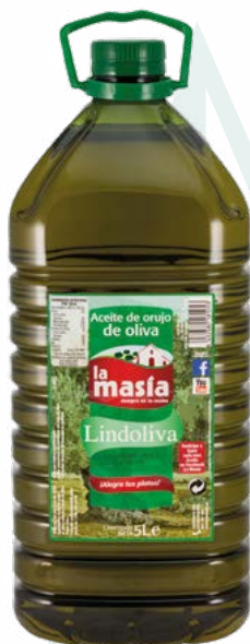
ACEITE DE ORUJO LINDOLIVA LA MASIA – 3X5/L