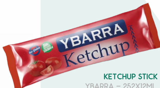
KETCHUP STICK YBARRA – 252X12ML.