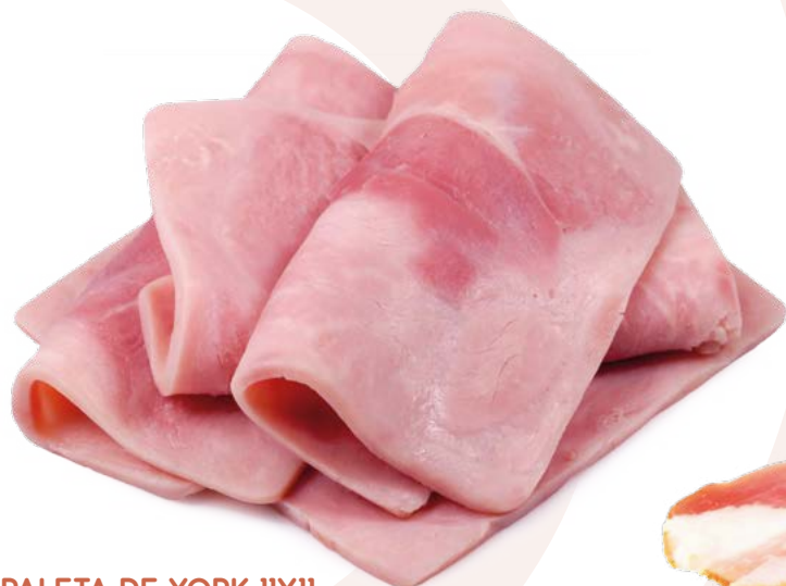
PALETA DE YORK IIXII AINUK – 2X3,5KG.