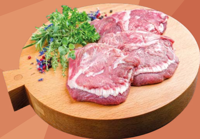
CARRILLADA CERDO MARBEIRA – 6KG.