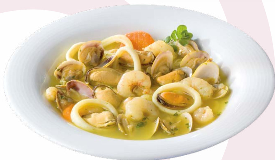
PREPARADO SOPA MARISCO AINUK – 4X1KG