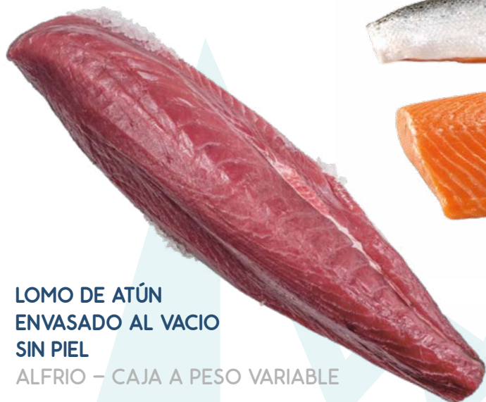
LOMO DE ATÚN ENVASADO AL VACIO SIN PIEL ALFRIO - CAJA A PESO VARIABLE