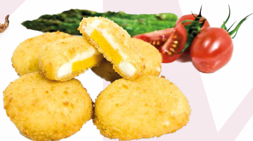
HUEVO BECHAMEL AINUK – 8X500GR