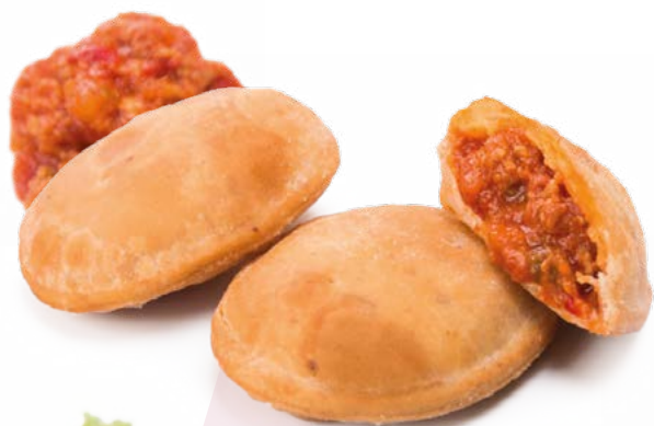
EMPANADILLA CRIOLLA CLAVO – 4X1 KG