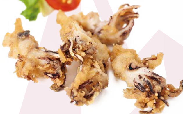
PUNTILLA ENHARINADA CLAVO – 1X2KG