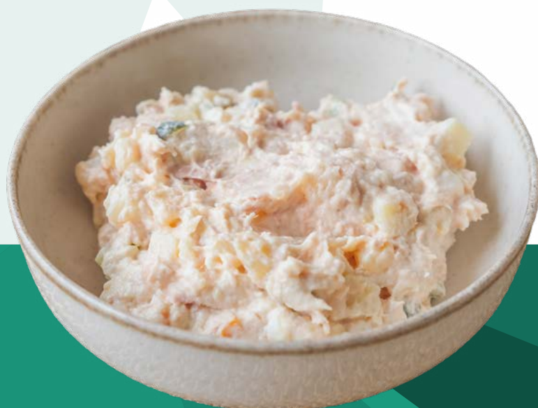
ENSALADILLA MEDITERRÁNEA ENSALANDIA – 4X1 KG