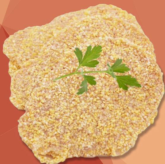
CINTA DE LOMO EMPANADA AINUK – 3KG.