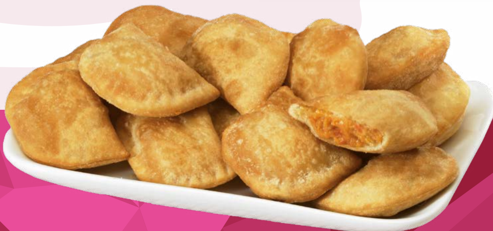
MINI EMPANADILLA ATÚN AINUK – 4X1