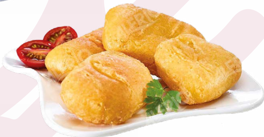
BACALAO REBOZADO GELVIGO – 4X1 KG