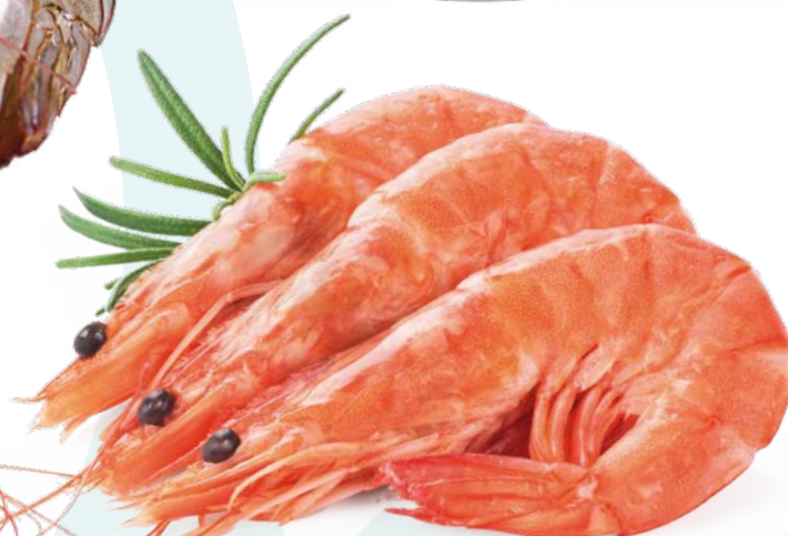
LANGOSTINO COCIDO 25/35 PESCATRADE – 4X2KG.